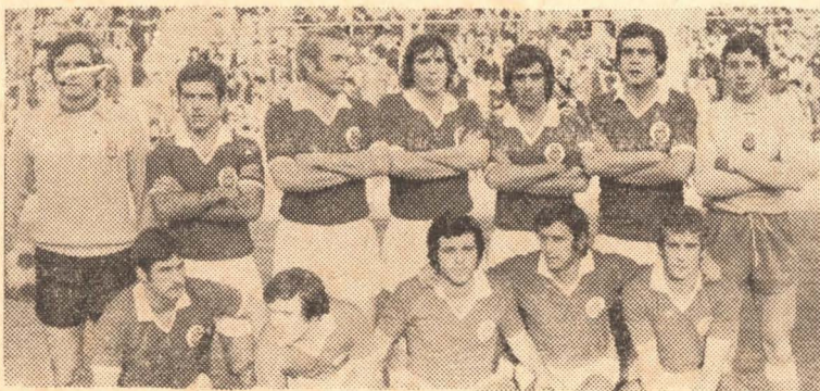
Este es el NÀSTIC 76-77, que aspira a lograr una plaza para la Segunda B, gran novedad para el fútbol nacional en la venidera temporada.

Cumplimentado el último paréntesis, el torneo entra en su recta final. La Segunda B está cada vez más cerca y un nutrido lote de equipos van a enzarzarse en cruenta lucha, mente, una de las plazas con premio. El campeonato, a partir de la próxima jornada, alcanzará un nivel inusitado y los puntos en litigio tendrán un valor decisivo. El Vinaroz Club de Fútbol disputará mañana la primera de las siete finalísimas. El Nàstic de Tarragona, un rival de empaque, con ánimo de meterse cuanto antes en la zona agraciada. Tratará el cuadro bermellón de la Imperial Tarraco sacarse la espina de la derrota que