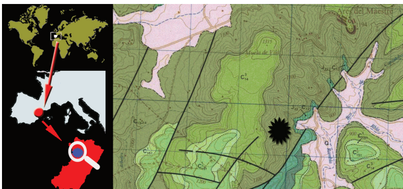
FIGURA 1. Lloc on es va trobar Acriaster sp. i entorn geològic.

El sistema apical està en la part més alta, molt desplaçat a la part anterior. L'únic exemplar de què disposem el té molt deteriorat però es poden apreciar millor els porus genitals 1 i 4, de contorn rodó, i la placa genital 5 sense porus genitals (Làm. II, Fig. A), i s'insinuen els altres dos. Podem indicar, per tant, un sistema tetrabasal.