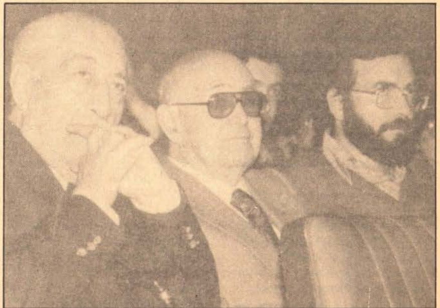
«Les Normes no varen nàixer d'una acadèmia que legislava com qui garvella aigua.»

—Tampoc n'hi havien massa. Crec que els universitaris científicament aclarits sobre la identitat valenciana no n'eren tants com ara. De totes formes, la segona República va obrir unes enormes perspectives al nacionalisme valencià. Varen aparèixer grups valencianistes, tant