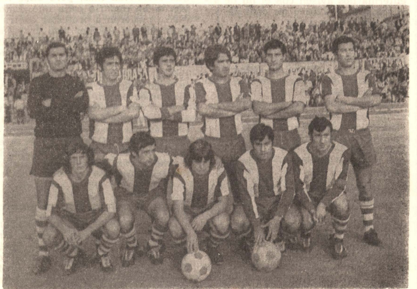
Reportaje gráfico del Vinaroz - Tarrasa jugado el domingo