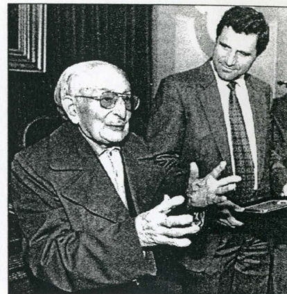
Beüt agradece el homenaje recibido. C. PASCUAL