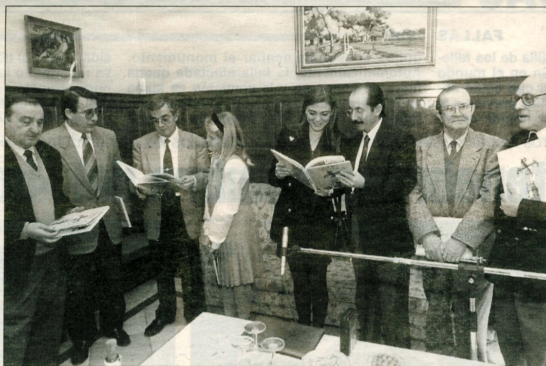
La presentación fue un acontecimiento cultural en el calendario festivo.

Bé tinga el guardó que honora la trajectòria coherent d'una vida i la fidelitat equànime a uns principis que han sortit com a fruit del raonament i del rigor científic.