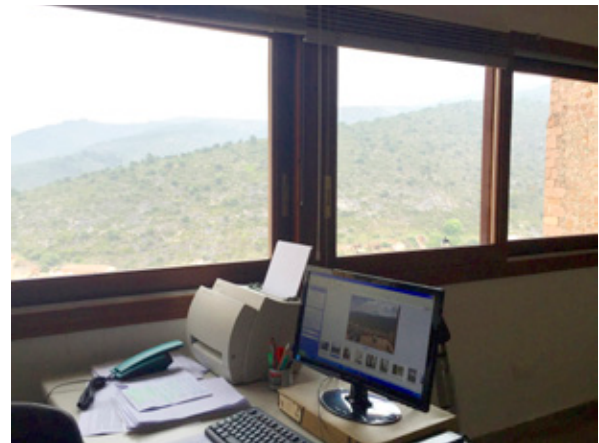
Unidad del centro de documentación.

Tanto las fotografías de archivo, como los catálogos de exposiciones y los artículos de