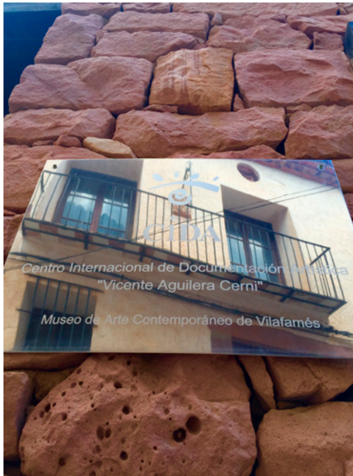
Rótulo señalético del CIDA.

El pasado año 2015 se cumplieron veinte años de la puesta en funcionamiento del Centro Internacional de Documentación Artística (CIDA) de Vilafamés.