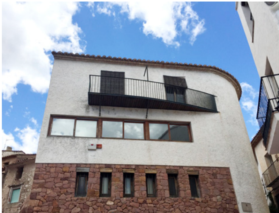
Edificio sede del CIDA situado en la calle Mestre Bernat, nº 14 de Vilafamés.

núcleo principal y originario del centro de documentación, al que se le han ido sumando los fondos personales donados por artistas y críticos de arte vinculados al museo, las donaciones de otras instituciones, el intercambio de duplicados con otros centros de documentación así como toda aquella documentación que durante estos 20 años ha sido recopilada por el propio museo de Vilafamés (MACVAC).