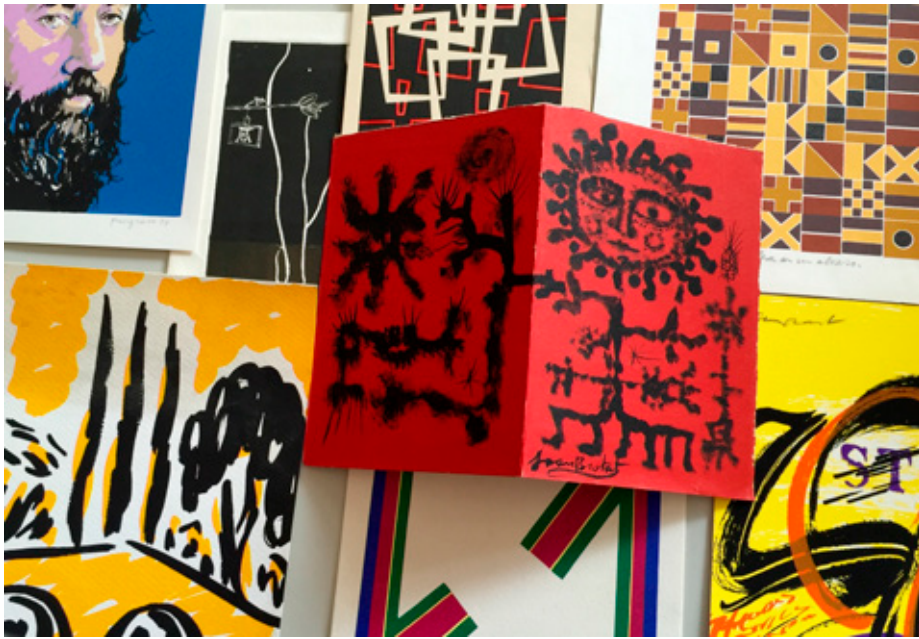
Documentación del legado de Vicente Aguilera Cerni, en la cual podemos ver obras originales a él dedicadas.