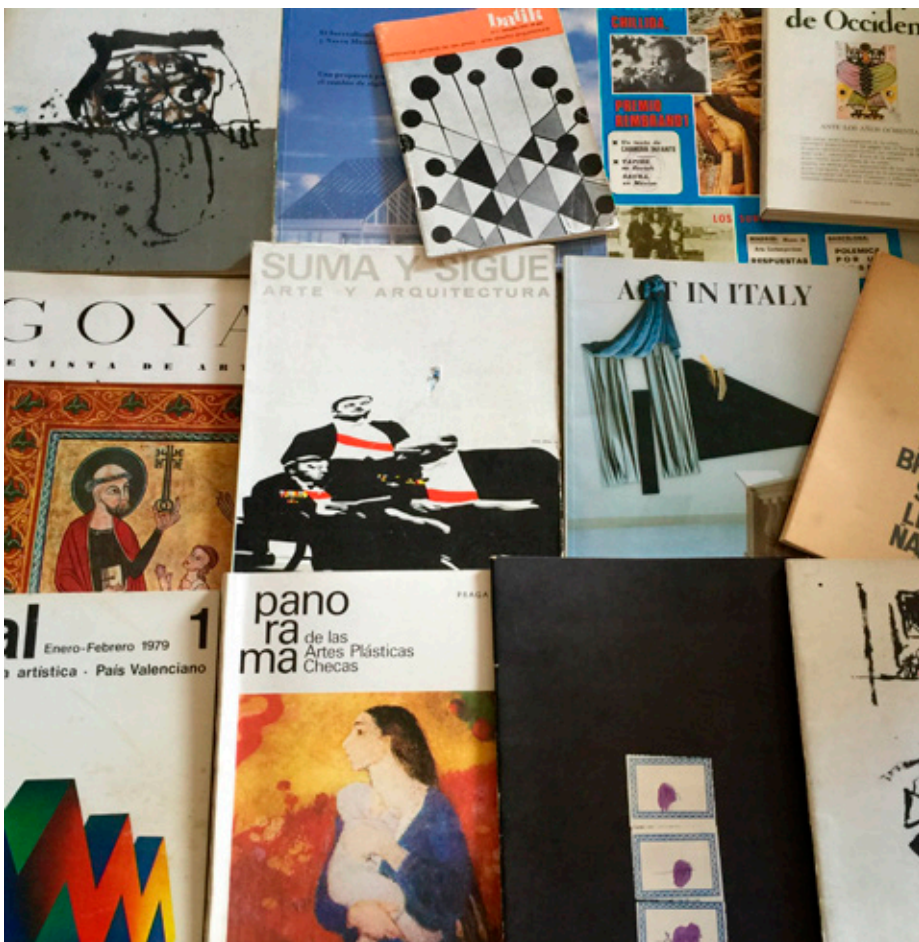
Revistas catalogadas en el fondo del CIDA.