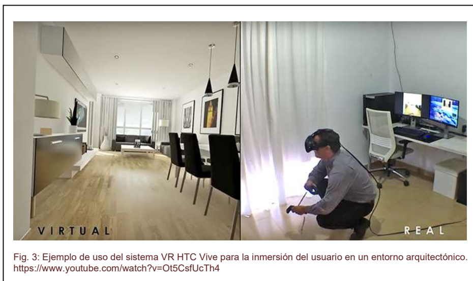
Fig. 3: Ejemplo de uso del sistema VR HTC Vive para la inmersión del usuario en un entorno arquitectónico. https://www.youtube.com/watch?v=Ot5CsfUcTh4

A priori, el mayor inconveniente reside en la necesidad de unión mediante cables, a modo de cordón umbilical, del casco con el