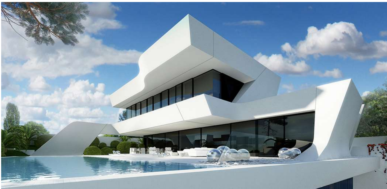
Fig. 1: Ejemplo de proyecto del Estudio A-Cero para una vivienda unifamiliar en Murcia. https://a-cero.com/es/portfolio/house-in-murcia/

Por ello, resulta relevante la implicación del propio usuario final en la fase de diseño del proyecto. Para ello, se propone seguir una metodología co-creativa (7) (8), yendo más allá de la realización de algunas entrevistas previas, de la selección inicial de alternativas constructivas o distributivas