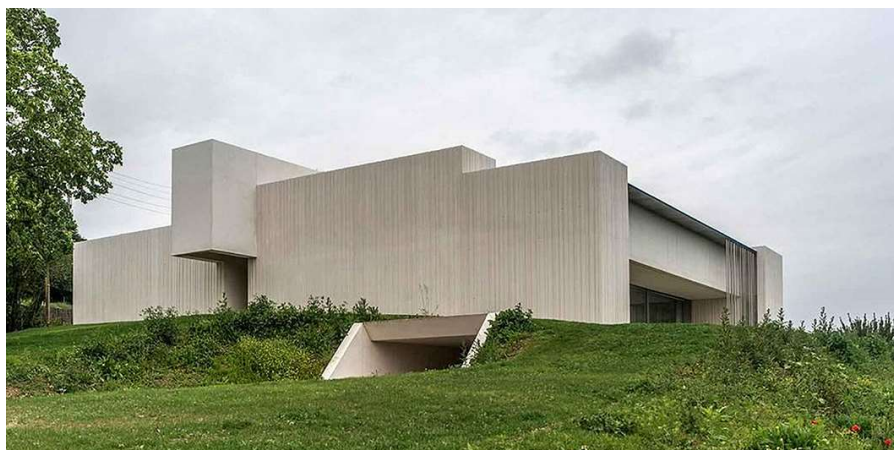
Fig. 5: Vista exterior de la Casa Malecaze, Estudio RCR Arquitectes. Ejemplo de vivienda unifamiliar con paramento de vidrio que comunica la estancia interior con el espacio exterior. http://afasiaarchzine.com/2017/03/rcr-25/rcr-malecaze-house-vieille-toulouse-4/

La presente propuesta plantea la inmersión del usuario en su futura vivienda unifamiliar durante la fase de diseño, utilizando dispositivos VR que permitan rastrear los mo-