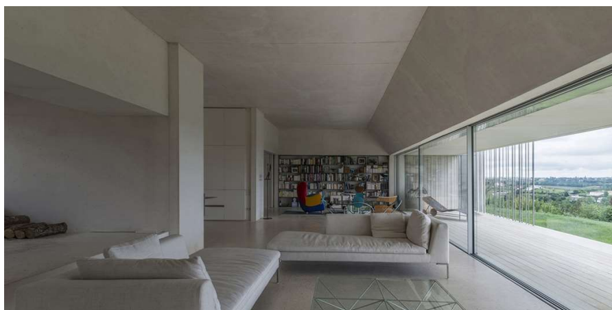
Fig. 6: Vista interior de la Casa Malecaze, Estudio RCR Arquitectes. Ejemplo de vivienda unifamiliar con paramento de vidrio que comunica la estancia interior con el espacio exterior. http://afasiaarchzine.com/2017/03/rcr-25/rcr-malecaze-house-vieille-toulouse-19/

Dichas experiencias sensoriales, pueden cambiar los procesos de valoración de los espacios arquitectónicos diseñados, tanto por parte de los propios arquitectos, como de los clientes finales en caso de incorporarlos al proceso creativo. Además, el hecho de incorporar a varios usuarios dentro de una experiencia multiusuario puede favorecer el diálogo y la discusión sobre la percepción sensorial de la escena, dando lugar a una valoración más completa de las diferentes alternativas presentadas del proyecto arquitectónico. Sin embargo, la adopción por parte de los estudios de dichas tecnologías requerirá de un periodo de aprendizaje y posiblemente de la contratación de personal con perfiles específicos. Por ello, una adopción temprana de dichos sistemas, junto a la realización de proyectos icónicos, puede constituir una ventaja competitiva para el estudio, que permita potenciar su posicionamiento a través de diferentes medios sociales especializados.