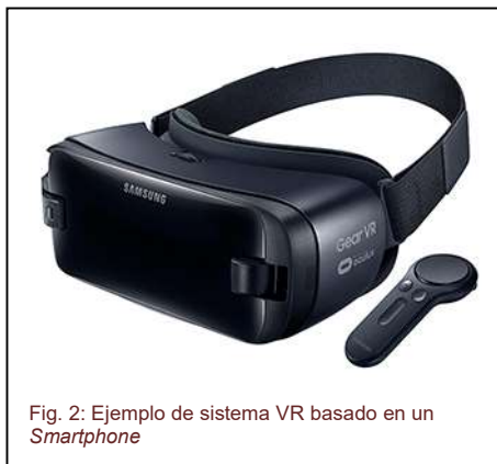
Fig. 2: Ejemplo de sistema VR basado en un Smartphone

Este tipo de sistemas, solamente distingue el movimiento de la cabeza del usuario, de modo que un