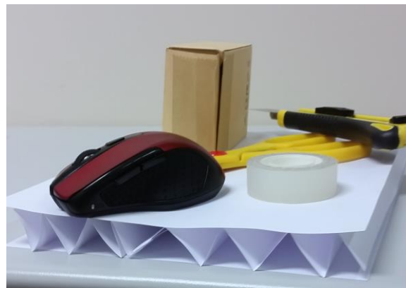
Figura 6. Utilizando folios y un poco de cinta adhesiva se pueden crear estructuras con alta rigidez específica.

La rigidización que se produce en los compuestos estructurales (paneles tipo sándwich) al aumentar el espaciado entre caras externas se puede visualizar empleando origamis estructurales. Doblando en forma de acordeón un folio y colocándolo entre dos hojas, se puede observar in-situ el efecto rigidizador del elemento intermedio. Adicionalmente, se puede animar a los alumnos a que realicen y evalúen estructuras sencillas empleando diferentes parámetros de diseño (número de folios, distancia entre caras, ubicación de la carga y puntos de apoyo) para guiarlos hacia la influencia de la estructura en las propiedades finales de los productos. La Fig. 6 ilustra esta experimentación que puede servir de introducción al cálculo de paneles sándwich.