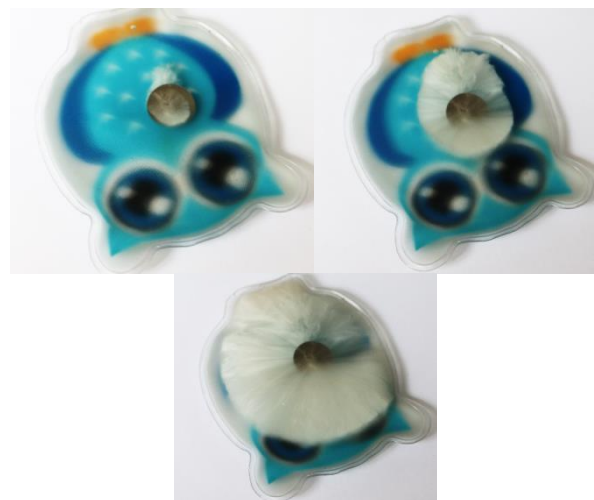
Figura 4. Un calentador de bolsillo o pocket warmer en una secuencia de su funcionamiento, cristalizando una solución sobresaturada de acetato de sodio.

El fenómeno de la cristalización implica una serie de condicionantes que suelen suponer un problema conceptual para los alumnos, como que un suceso sea espontáneo (termodinámicamente favorable) pero no sea instantáneo (cinéticamente lento o improbable). Esto lleva a situaciones aparentemente paradójicas como el subenfriamiento de los metales previo a su cristalización. Sin embargo, empleando pocket warmers (Fig. 4) se pueden evidenciar estos fenómenos de una manera sencilla de retener en la memoria. Sirve de base para explicar el subenfriamiento, la nucleación heterogénea, el crecimiento cristalino, la exotermicidad en la cristalización y la formación de esferulitas en la cristalización de los polímeros [11].