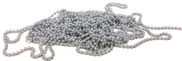
Figura 5. Las cadenas de bolas son un recurso muy adecuado para introducir el concepto de enmarañamientos ( entanglements ) en polímeros.

Empleando segmentos de cadenas de bolas, como las que se emplean en cortinillas, se puede visualizar el efecto que tiene la masa molecular en los enmarañamientos ( entanglements ) moleculares y cómo estos afectan a las propiedades físicas del material. Cuando los segmentos son muy pequeños se comportan como un fluido y se pueden trasvasar de un recipiente a otro sin problema. Cuando la longitud es intermedia, de unos 5 cm, el comportamiento sigue siendo fluido, pero tiende a comportarse más como un bloque, con la formación de algunos agregados. Cuando los segmentos son mayores, a partir de 20 cm, ya no es posible estirar uno sólo sin que arrastre a los demás y no es posible hacer que fluya de un recipiente de boca estrecha.