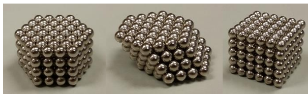
Figura 2. Modelo de enlace metálico y formación de cristales con esferas magnéticas [8].

El enlace metálico y la formación de estructuras cristalinas compactas se pueden mostrar fácilmente empleando esferas magnéticas (Fig. 2). Los siguientes enlaces dirigen a videos explicativos sobre cómo realizar estas estructuras compactas [8,9].