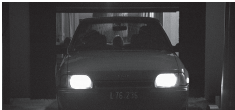
De arriba abajo: matrícula, faro y rueda del coche; familia Shöber; salida del autolavado