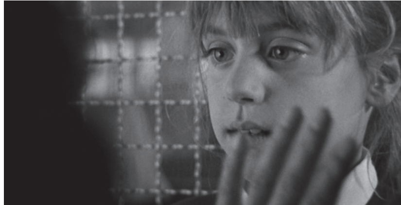
Eva está ciega

Así pues, la solución adoptada es la que ya conocemos con la película terminada: el seguimiento de las actividades cotidianas de una familia de clase media durante un día a lo largo de tres años sucesivos. La primera parte comienza en 1987 tras el prólogo inicial donde vemos de forma fragmentaria el lavado del coche de la familia protagonista mientras se suceden los títulos de crédito. A lo largo de este primer bloque narrativo Haneke nos presen-