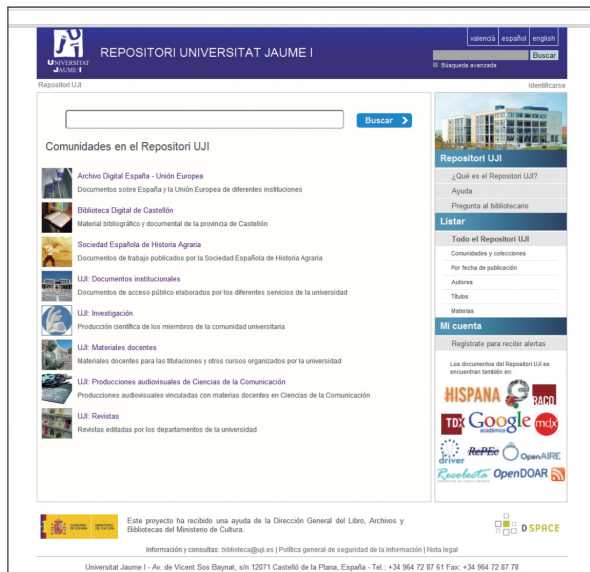
Pantalla de inicio del Repositori UJI

un “producto” de la universidad pero su misión va más allá de ser exclusivamente el archivo de la producción científica propia. Desde sus inicios se proyecta como un servicio orientado a los usuarios, para satisfacer sus necesidades y demandas de acceso a la información, en concreto, a recursos digitales. Así, la preservación y difusión, finalidades de todos los repositorios, se aplican a contenidos de procedencia tan diversa como son el patrimonio documental de la provincia de Castellón, la producción científica, docente e institucional de la universidad, y a otros recursos externos, de interés para la comunidad universitaria.