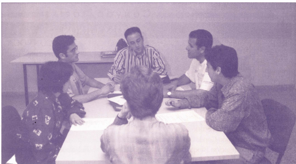
Una imagen de la reunión de la Comisión Permanente de la Delegació d'Estudiants

La Comisión Permanente estima que ha de trabajar más directamente con los representantes en Departamentos y Unidades Predepartamentales, con los de las Juntas de Centro, y los de las comisiones, a fin de informar con mayor eficacia a la asamblea y al resto de los estudiantes de aquellas cuestiones que resulten de interés. Otros acuerdos adoptados son la integración