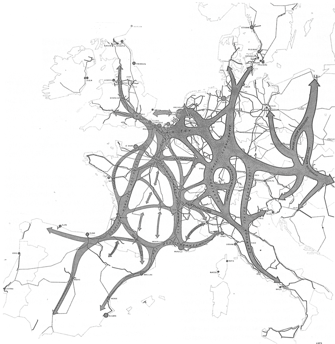
Gráfico n.º 3. Grandes Corredores europeos