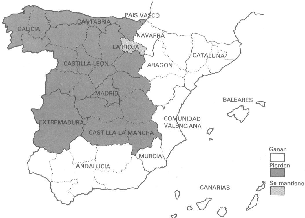
Gráfico n.º 2. Peso del P.I.B. sobre el total español. 1985-1988