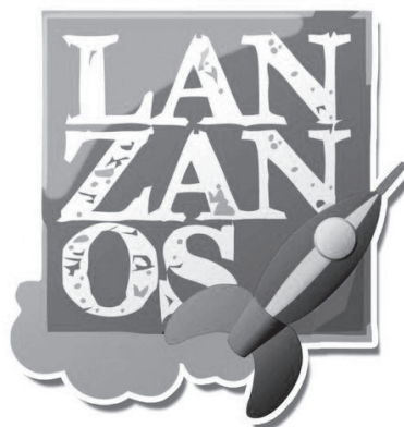
Figura 5. Imagen de la plataforma web Lánzanos.

Durante los dos meses naturales en los que se extiende este ejercicio, y para aquellos vecinos sin acceso a Internet, se dispondrá de un teléfono de información para conocer el estado de las donaciones, ya que –como dictan las reglas del crowdfunding – de no alcanzar en su totalidad la