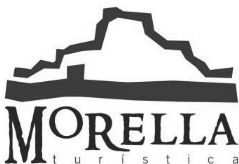
Figura 4. Identidad Corporativa de la marca Morella turística.

complejo, desde los criterios físicos que determinarán la adecuación de los espacios arqueológicos a su visita hasta el entramado técnico que dará soporte a la misma, obligan a definir meticulosamente las acciones a desarrollar y programar consecuentemente un estricto calendario de aplicación. En la tarea de agregar valor a un recurso en bruto –esto son los yacimientos arqueológicos– con objeto de extraer un rendimiento práctico, empresa que además entronca con la socialización del conocimiento, ninguna particularidad estructural, y ningún agente implicado, debe escapar a la planificación. Como se advertía en el encabezamiento de este texto, se referirán de seguido exclusivamente aquellas acciones que de modo más sintético capitalizan la singularidad de este itinerario arqueológico.