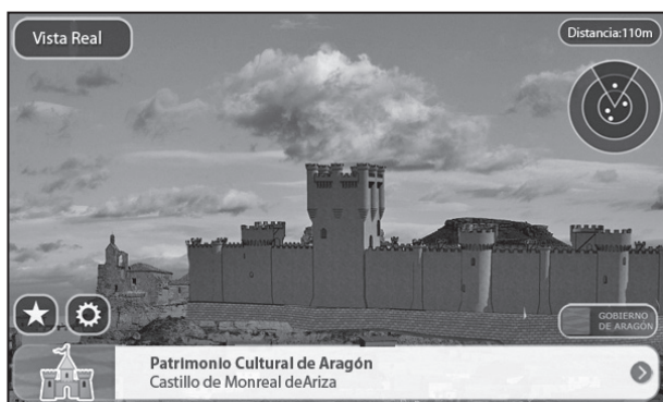
Figura 2. Aplicación de realidad aumentada sobre el castillo de Monreal de Ariza (Zaragoza)

superarán en inicio el número total de cinco lugares. Se ajusta esta moderada elección al tiempo efectivo que supondría su recorrido, que en ningún caso debe sobrecargar al interés del visitante, y desde luego a la contenida inversión económica que podrá plantearse al comienzo del proyecto. Serán indicados, en cualquier caso, los elementos secundarios y contenidos transversales que completen el paquete cultural.