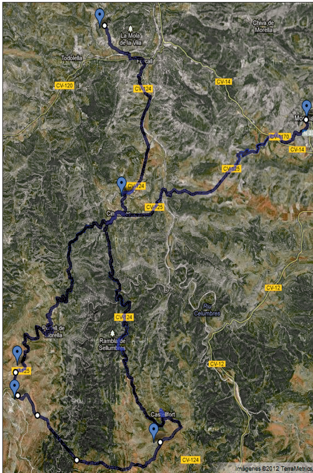
1. Trazado de la ruta circular propuesta, con inicio en la ciudad de Morella y parada en cada uno de los cinco sitios arqueológicos referidos.