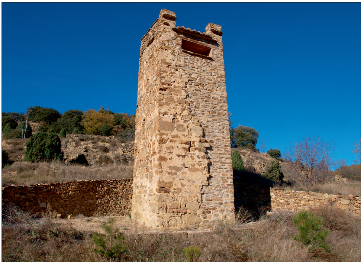
2. Vista general de la Torre dels Moros (Cinctores) tras su última restauración.