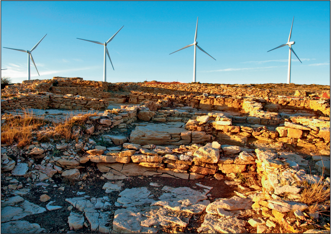
1. Vista general del estado del sitio arqueológico de la Lloma Comuna (Castellfort)