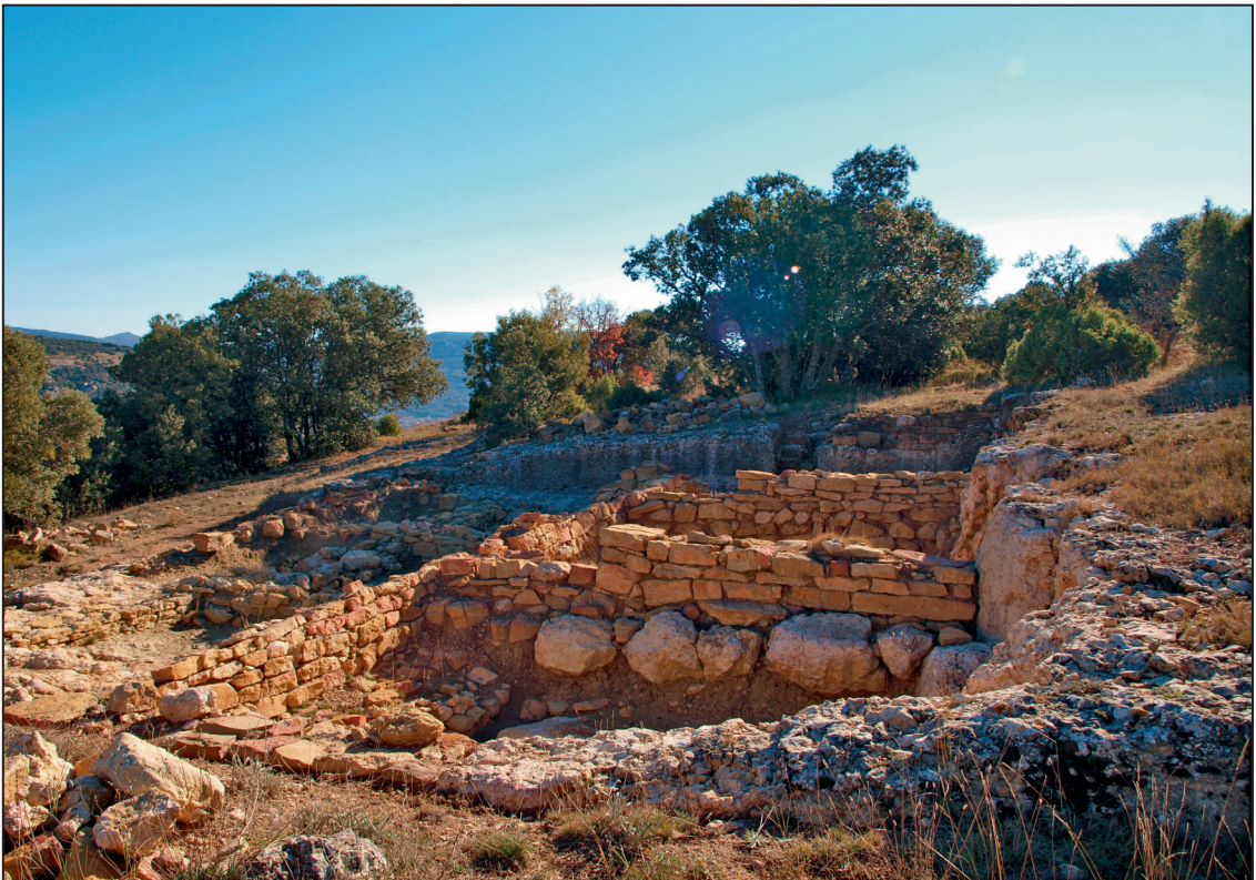
2. Estado del la Domus del Triclinium en el sitio arqueológico de Lesera (Forcall).