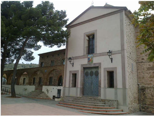
Figura 15. Ermita de la Sagrada Familia