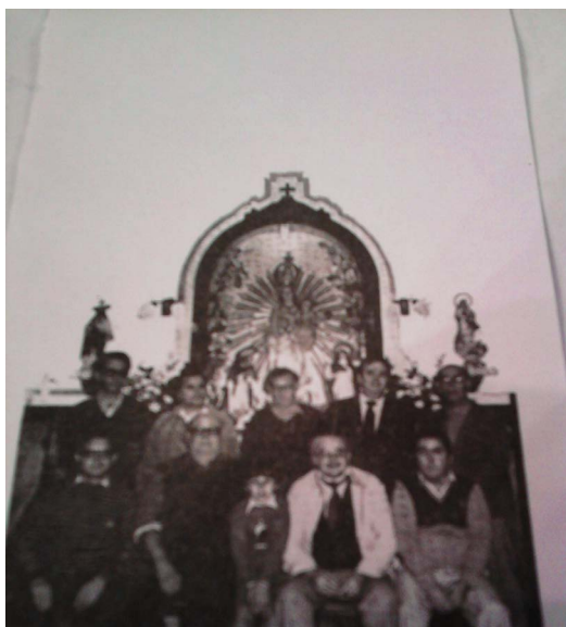
Figura 2. Grupo de auroreros, 1983

En la postguerra (s. XX) desaparecieron casi el 90 % de los auroreros debido a que los párrocos querían que estos se reconvirtieran en coros parroquiales, pero los auroreros han sido un grupo de espíritu libre y no han querido depender de nadie y solamente están bajo la tutela de la parroquia.