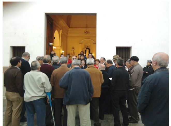
Figura 18. Cantando en la ermita de S. Vicente

En el día de hoy se celebra en esta capilla una gran función; y todos los de la Villa vienen en esta mañana a oír el sermón. ¡Qué dichosas son! Las que tienen de nombre Rosario y llevan antorcha en la procesión.