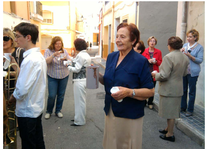
Figura 8. Invitando a chocolate