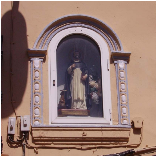
Figura 19. Sto. Domingo de Guzmán