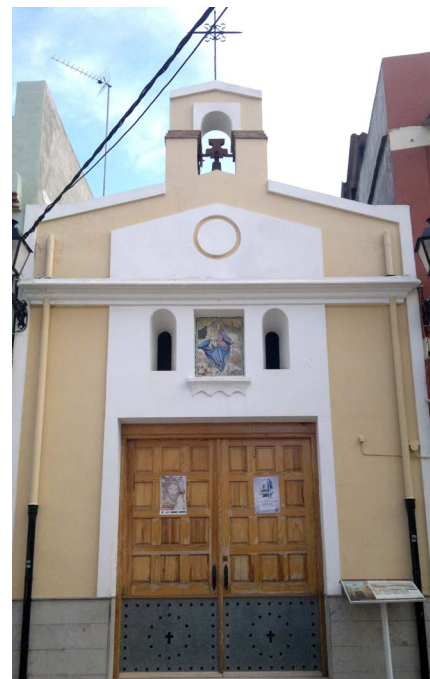
Figura 5. Ermita de Nta. Señora del Rosario

Las bellas coplas que entonan, aún teniendo por tema principal la devoción a la Virgen del Rosario, van recogiendo también los motivos litúrgicos del santoral, propios de las distintas épocas del año en que se cantaban. Las hay de carácter local y de carácter general.