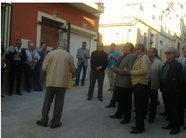
Figura 7. Cantando la Salve al finalizar el Rosario

A continuación de este rosario, se forma también en la ermita un rosario, en el cual participan hombres y mujeres, siendo el recorrido por las calles que pertenecían a la parroquia del Santo Ángel. Los meses de octubre y mayo, que son dedicados a la Virgen, cuando termina el rosario, le cantan la salve a la Virgen en la puerta de la ermita invitando