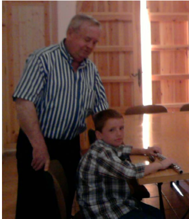
Figura 12. Una generación dará paso a otra