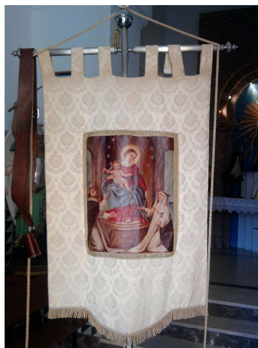
Figura 3. Guión de la Virgen del Rosario

Se formó un pequeño grupo, al cual se fueron incorporando poco a poco personas que tenían la misma afición y entusiasmo. Como no tenían guión, decidieron hacer uno a la Virgen del Rosario. Ni que decir tiene que enseguida hubo personas que se hicieron cargo de hacerlo completamente gratis o incluso a cambio de alguna copla.