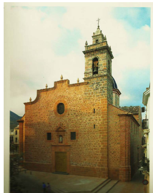
Figura 14. Iglesia de S. Ángel

En el monte llamado L'Alcudia y por otro nombre, se llama El Rosal se reparten todos los domingos rosas saludables para todo mal. Las vais a tomar el que quiera parte de estas rosas y de su fragancia quiera disfrutar.