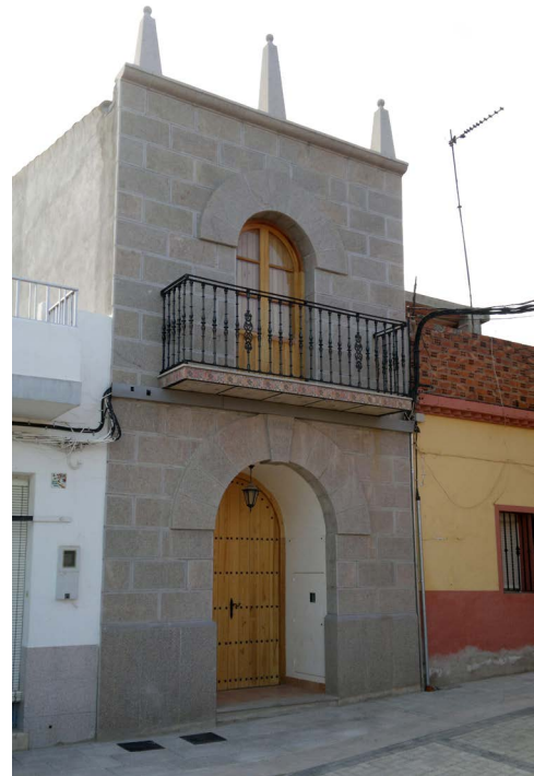
Figura 11. Sede de la aurora

Antiguamente, se salía el sábado a mediodía y se hacía el camino a pie hasta el monasterio de los Franciscanos de Santo Espíritu. Cuando llegaban, cenaban y se acostaban en el monasterio.