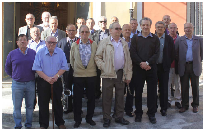
Figura 21. Auroreros 2013