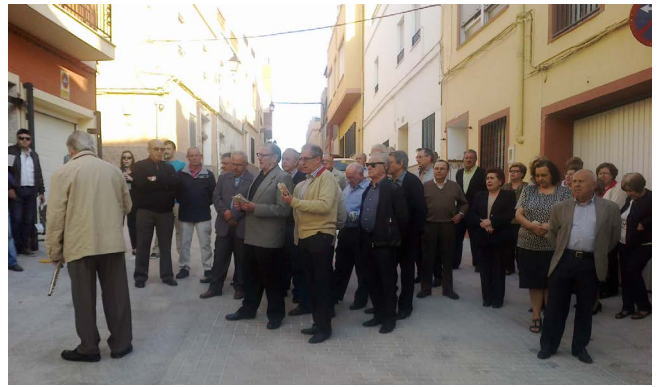
Figura 20. La última copla