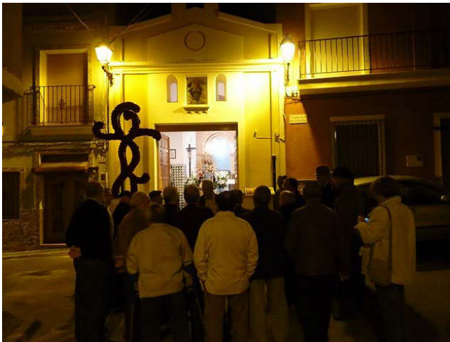
Figura 6. La primera copla en la ermita de la Virgen del Rosario

Asunción. Las de carácter general son las relativas al ciclo de Navidad, de la Pasión, Pentecostés, Trinidad, etc.