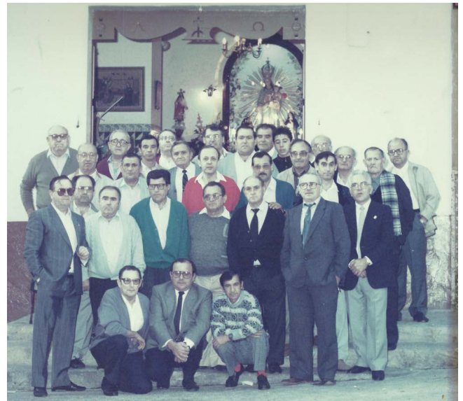
Figura 4. Grupo de auroreros, 1985

Los auroreros, como se ha mencionado anteriormente, cada domingo de octubre y mayo, al romper el alba, van desgranando coplas sobre la ciudad dormida, trayendo envueltas con sus acordes las sublimes creencias de los que fueron abuelos de nuestros abuelos.