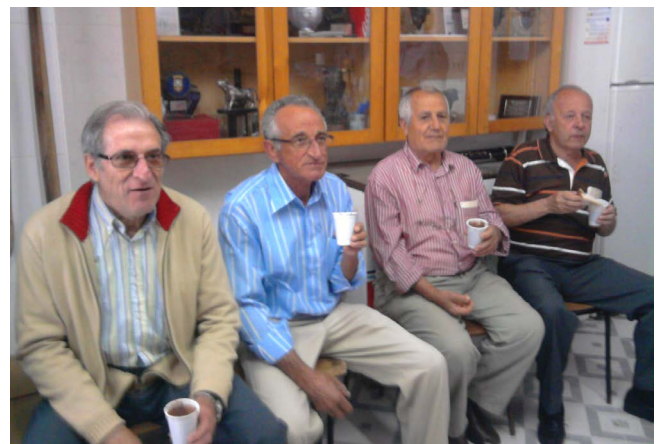
Figura 9. Auroreros después del rosario

a los asistentes a tomar chocolate y coca, costeándolo los propios auroreros.