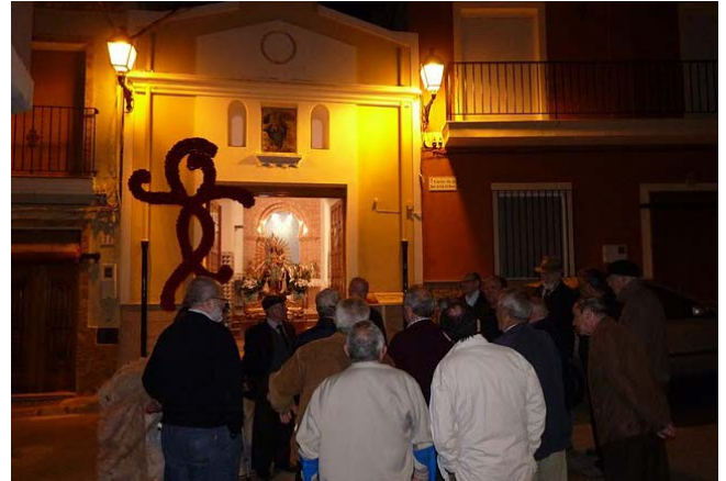
Figura 13. Cantando en la ermita del Roser

die se ha quejado de que se canten las coplas y el rosario por estos barrios tan antiguos: el Roser, el Parral, L'Alcudia, aunque siempre es obligatorio pasar por la iglesia del Sto. Ángel.