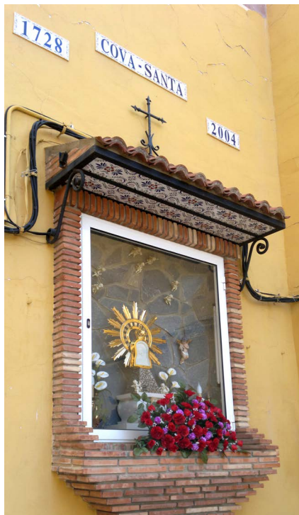
Figura 17. Virgen de la Cueva Santa

En el ventre de sa Mare estava ja se manifestava gran predicaor.