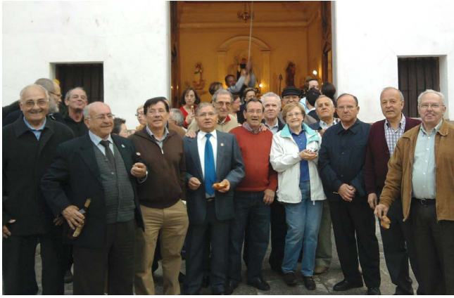
Figura 10. Después de cantar a S. Vicente con una invitada

ban a sus cantos con otro tono de voz; o sea, que si se reunían cuatro o cinco personas, cantaban con tres o cuatro tonos de voz diferentes. Esto es algo innato en algunas personas de La Vall d'Uixó.