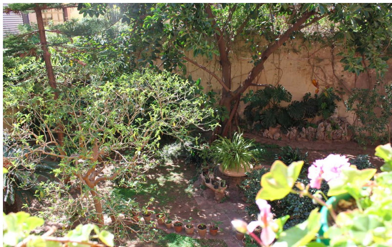
Figura 17. Jardín, patio interior