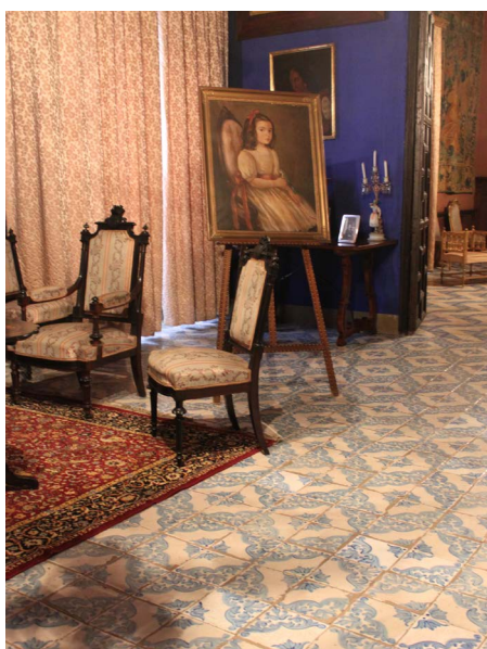
Figura 3. Salón azul