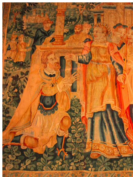
Figura 14. Detalle del tapiz