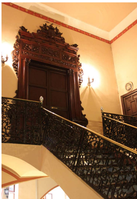
Figura 7. Escalera principal