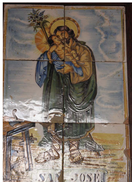
Figura 17. Retablo cerámico san José