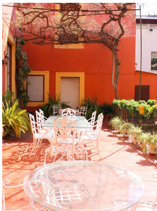
Figura 10. Terraza