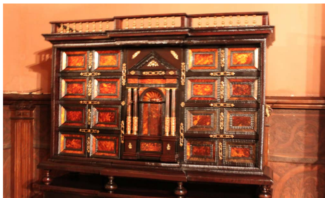
Figura 5. Barqueño