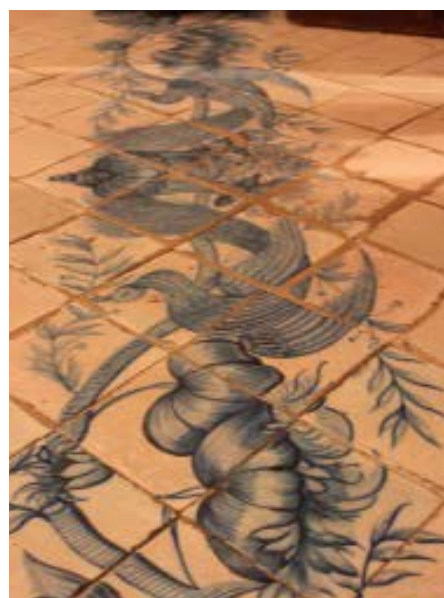
Figura 4. Detalle cerámica, habitación principal