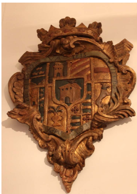
Figura 9. Escudo de madera heráldico de la familia. Barón de la Pobra Tornesa