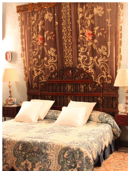
Figura 12. Dormitorio principal