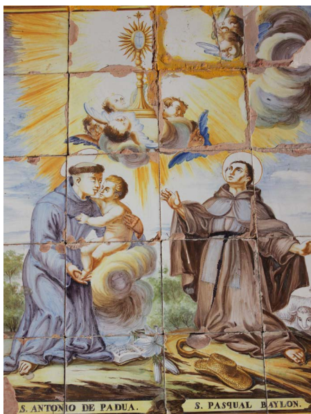
Figura 15. Retablo cerámico san Antonio y san Pascual