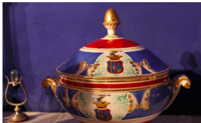
Figura 6. Vajilla Alfonso XII