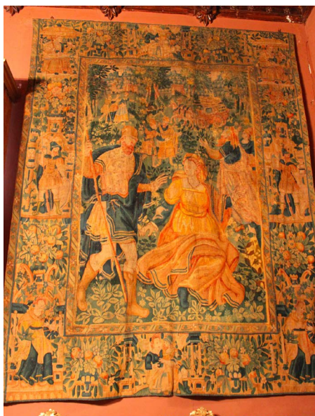
Figura 13. Tapiz