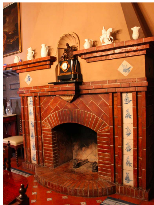
Figura 8. Chimenea de la cocina