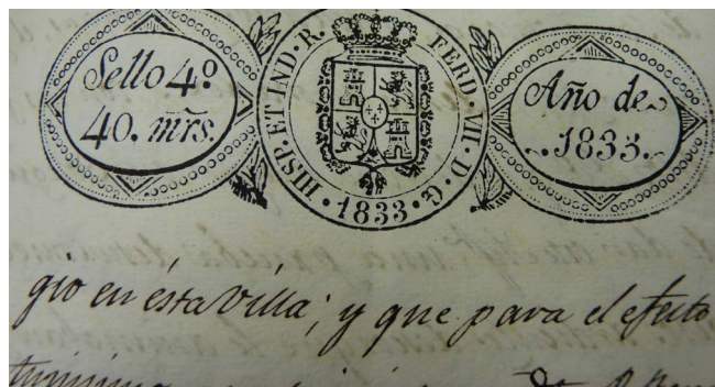
Figura 2. Carta de 1833. Archivo municipal de Castellón

En 1835, el Gobierno español, consciente de la dificultad de sofocar él solo la sublevación, solicitará con éxito ayuda militar a Francia, Portugal y Gran Bretaña, cargando así de razones morales a los car-