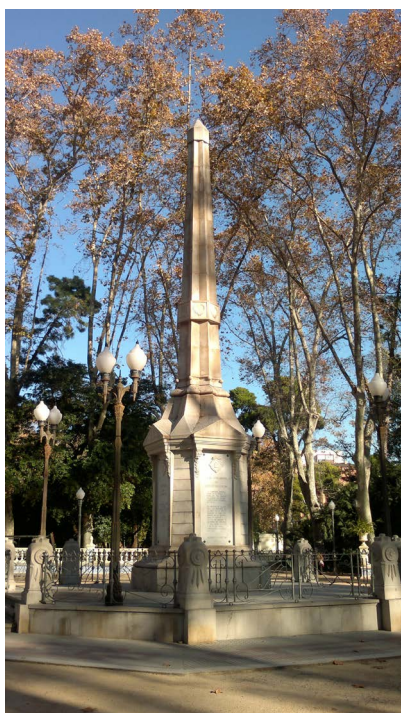
Figura 1. Obelisco en el parque Ribalta dedicado a los castellanenses defensores de la libertad

tendiente y Cabrera con el nulo resultado del mensaje, se presentaron los días 7, 8 y 9 de julio ante los muros de Castellón con la intención de ocuparlo, pero todas las tentativas que hicieron se estrellaron ante los pechos de los bravos castellanenses que por todas partes les arrebatan el paso a falta de murallas consistentes que pudieran frenar la osadía de sus contrarios. Castellón presentaba aquellos días una escena aterradora.