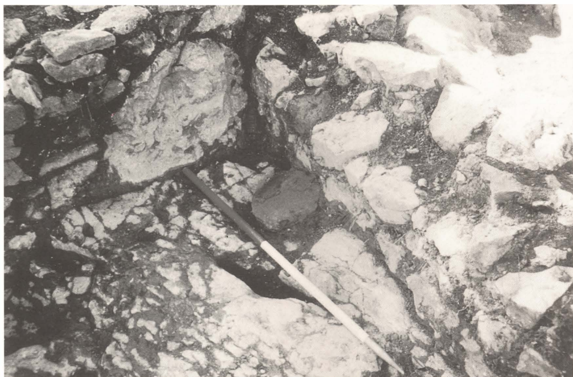
2. Troballa del motlle per foneria en l'estança C2.