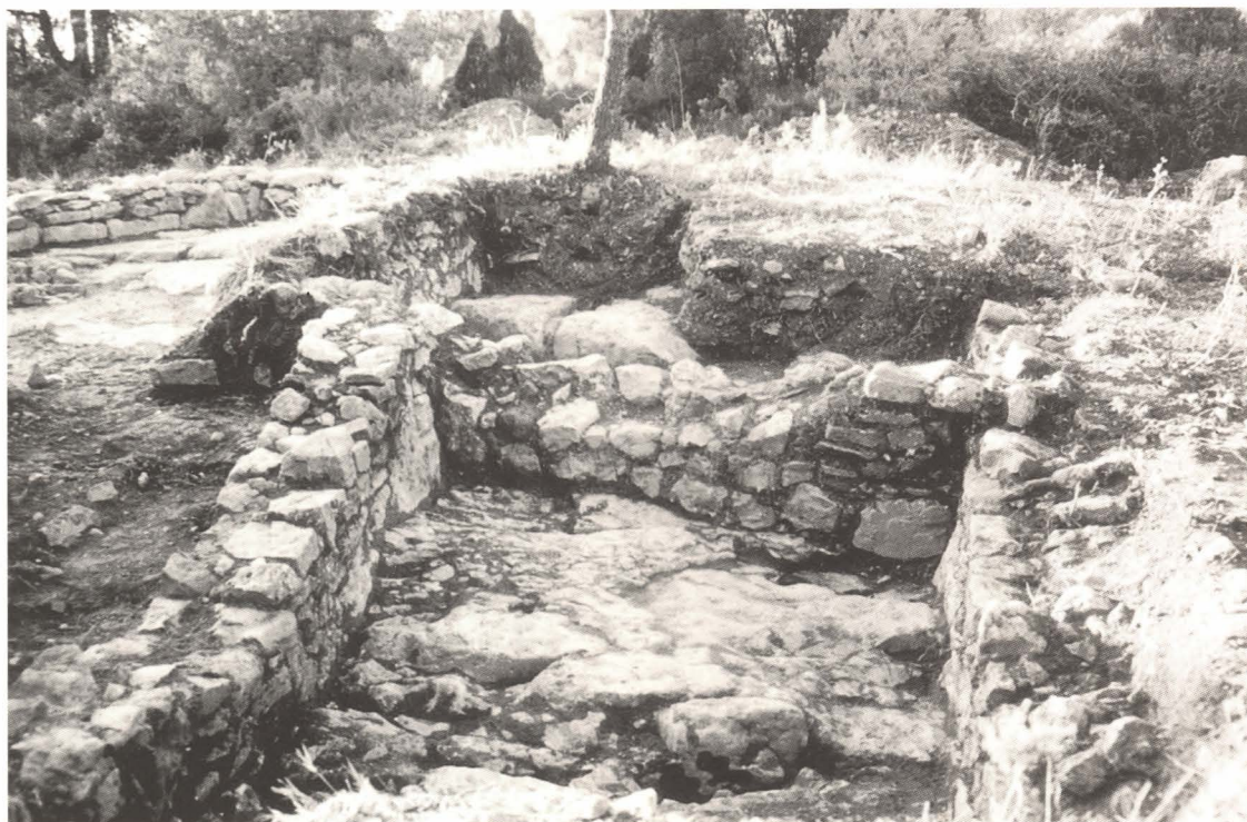
1. Estances C1 i C2.