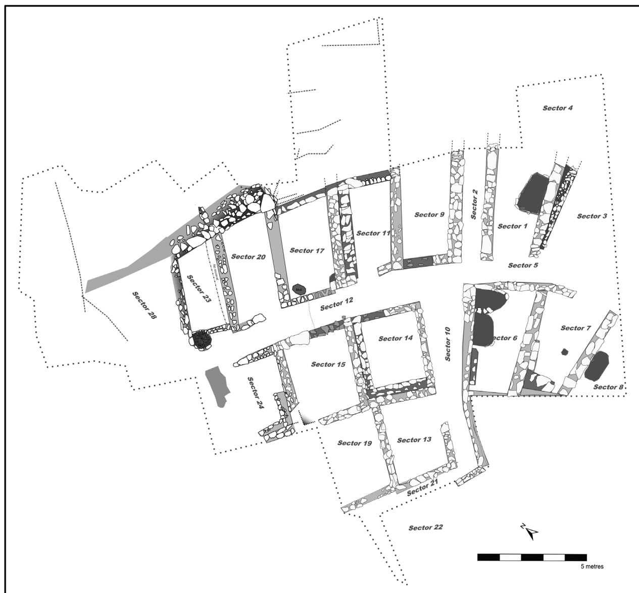
Figura 3. Planta de las estructuras correspondientes a la fase 1 del hierro antiguo.

en esencia no deben de invalidar muchas de las consideraciones vertidas en aquella ocasión, de modo que remitimos a aquel trabajo para obtener más detalles referentes a la técnica constructiva, la fauna, la cronología o la cuantificación de la cerámica entre otros aspectos (no así la interpretación funcional del asentamiento, actualmente en revisión). Lógicamente lo allí expresado necesitará de la necesaria actualización con los nuevos datos y materiales recuperados, pero es lógico pensar que en líneas generales los resultados no variarán en exceso.