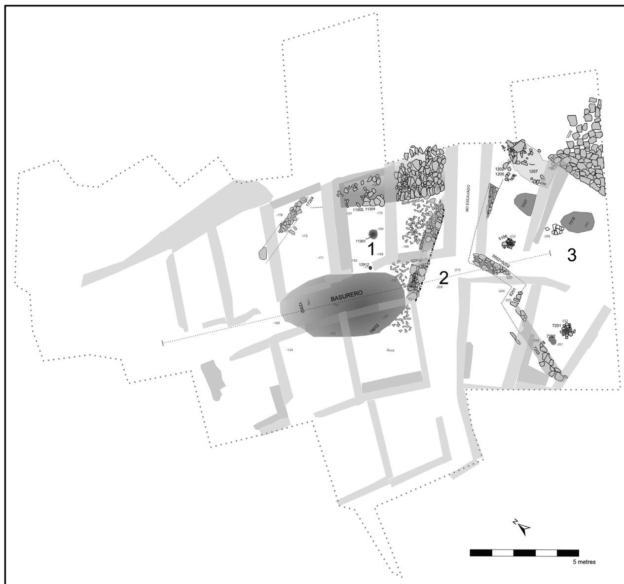
Figura 4. Planta de las estructuras correspondientes a la fase 2, bronce tardío o final.

da a la mencionada fase 5, aunque por el intervalo cronológico también puede ser considerada como perteneciente a la fase 4.