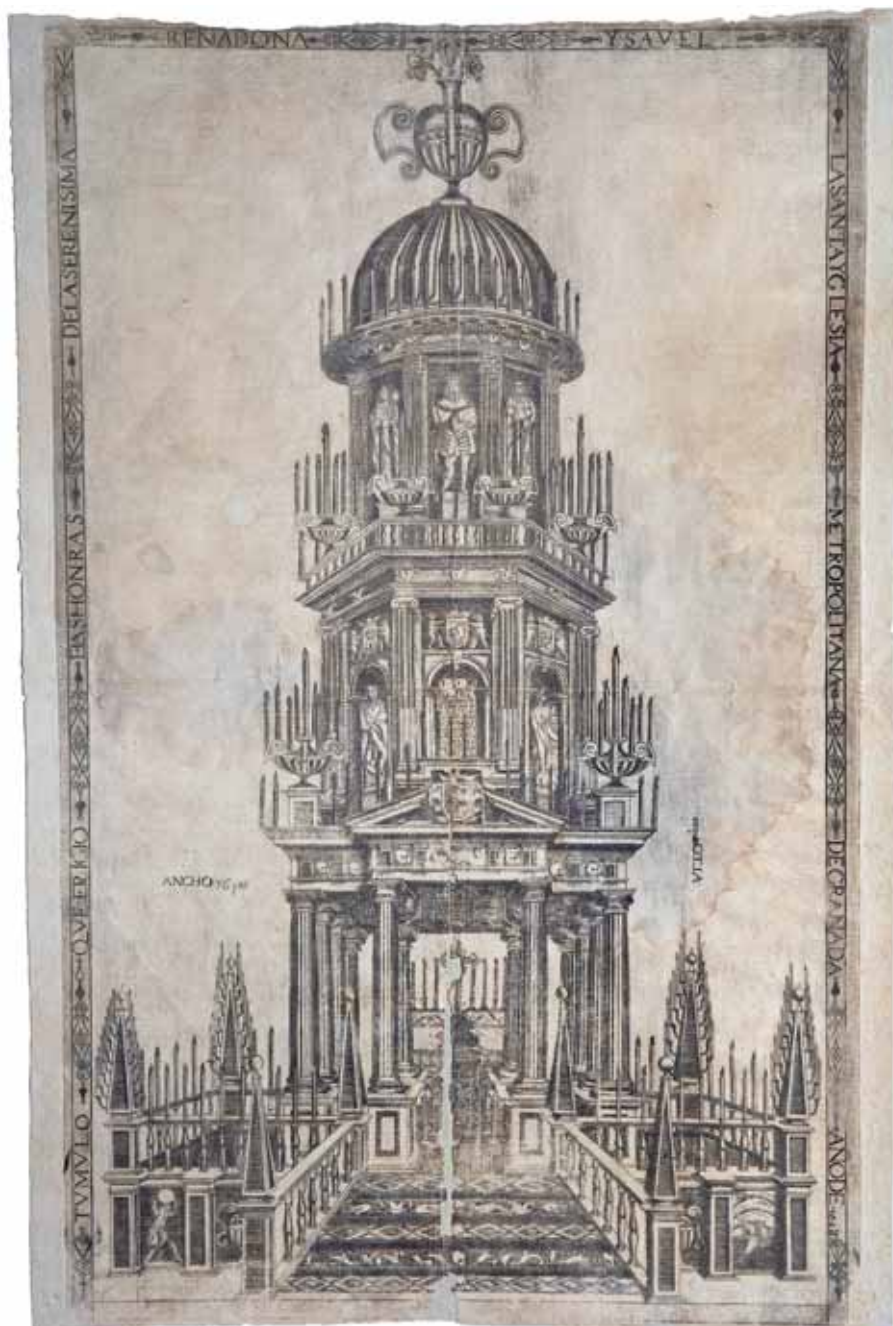
Fig. 5. P. LÓPEZ. «TUMULO QUE ERIGIO EN LAS HONRAS DE LA SERENISIMA REINA DOÑA YSAVEL LA SANTA YGLERIA METROPOLITANA DE GRANADA AÑO 1644». Estampa que ilustra la descripción Relacion Historial de las exequias, tumulos y pompa funeral que el Arçobispo, Dean y Cabildo de la Santa y Metropolitana Iglesia, Corregidor, y Ciudad de Granada hizieron en las honras de la Reyna nuestra señora doña Ysabel de Borbón.... », de M. A. SÁNCHEZ DE ESPEJO, Granada, 1645. Hospital Real Universidad de Granada. BHR/A-003-206.