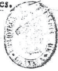
Fig. 4. Anna HEYLAN. Escudo de Granada con los Reyes Católicos, Biblioteca Universitaria de Granada Hospital Real Universidad de Granada. BHR/ Caja B-038 de L. PARAQUELLOS CABEÇA DE VACA, Triunfales celebraciones... Granada, 1640

NON ALIVD FACIT AETERNVM, atque stabile Imperium, nisi Fides.