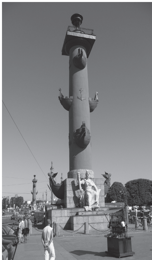
Abbildung 3: Zwei rote columnae rostratae in der Nähe der alten Börse in Sankt Petersburg. Sie wurden zur Zeit Katharinas der Großen errichtet. An den Sockeln sind die personifizierten Flüsse Volga, Volchov, Dnjepr, und Neva. Neben der Repräsentationsfunktion dienten die Säulen mit ihren an der Spitze installierten Feuern als Leuchttürme.