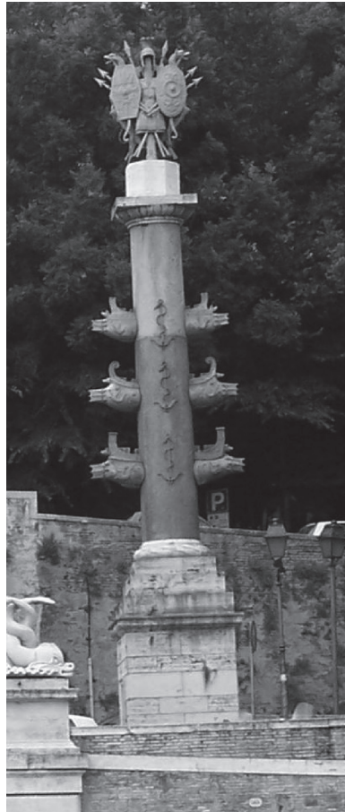
Abbildung 2: Eine der beiden columnae rostratae, welche die Fontana di Dea Roma auf der Piazza del Popolo flankieren. Sie wurden auf Befehl Napoleons von dem Architekten Giuseppe Valadier errichtet.