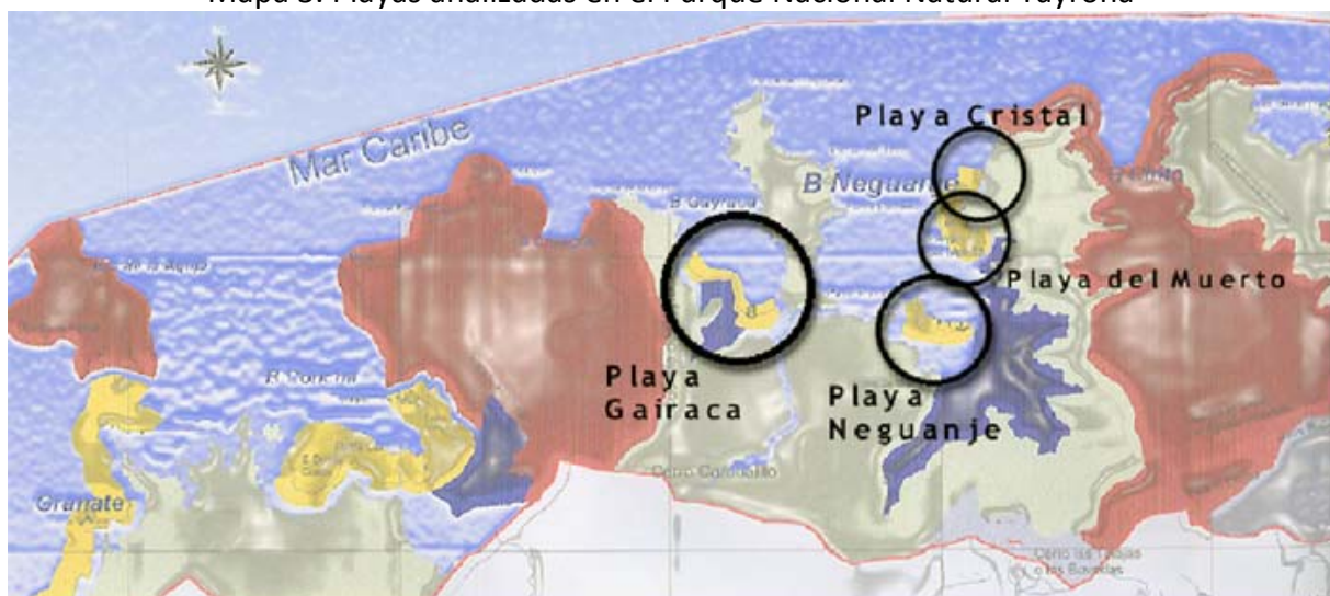
Mapa 3. Playas analizadas en el Parque Nacional Natural Tayrona

Más al noreste de Taganga se encuentran las playas aisladas, unas en las inmediaciones del Parque Nacional Natural de Tayrona y otras dentro del mismo parque (Mapa 3). El PNN Tayrona es una de las 8 áreas protegidas de playas en el Caribe con 15.000 has. y con longitud de 21,65 Km. desde la playa de los Naranjos hasta la playa Bonito Gordo. En 2008 tuvo un total de 184.778 visitas (Parques Nacionales Naturales de Colombia). En esta costa sobresalen las playas de Gairaca y de Cristal, ambas se ubican en bahías muy cerradas lo que hace que el oleaje sea poco intenso, periodos de 4 y 8 segundos y alturas que no alcanzan el metro, no obstante, el acceso se realiza generalmente por tierra a través del Parque Tayrona. Son playas con baja batimetría, de unos 800 a 1.000 metros de longitud y una anchura de entre 30 y 60 metros. Destaca la calidad de la playa Cristal, con áreas coralinas y arena de tonos blanquinosos y de granulometría muy baja. Si bien son playas que están bastante bien conservadas y presentando buena calidad, sus aguas, empiezan a presentar dificultades por la masificación (siendo peligroso que se presenten como recambio de las playas urbanas) y ocupación del área marítima terrestre.