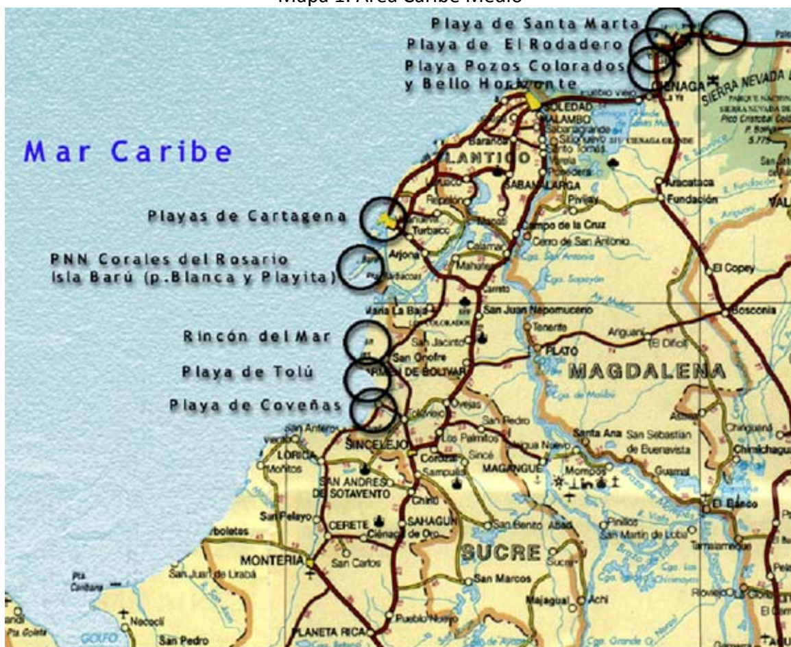
Mapa 1: Área Caribe Medio