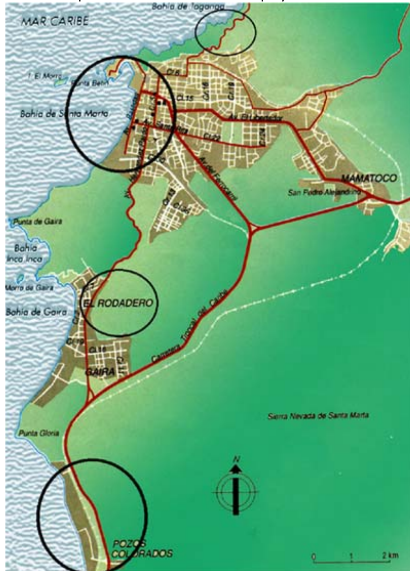
Mapa 2: Santa Marta. Zonas de playa analizadas