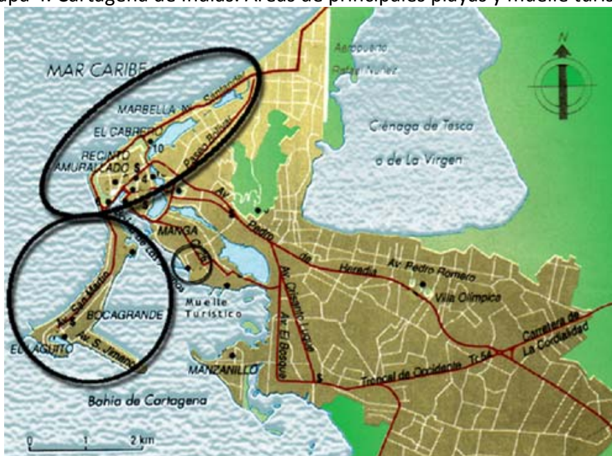
Mapa 4. Cartagena de Indias. Áreas de principales playas y muelle turístico