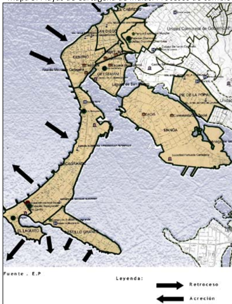
Mapa 5. Playas de Cartagena de Indias. Procesos de cambio