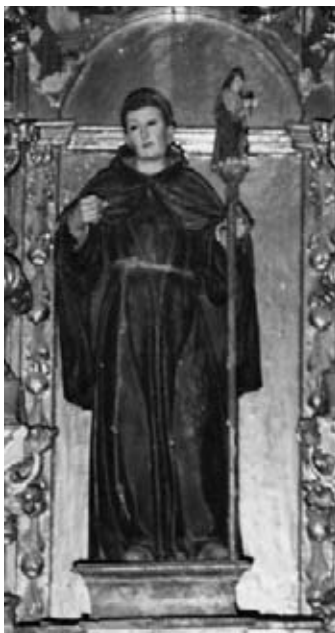
San Pascual. Parroquia de Santa Catalina. Jerez de los Caballeros. (Badajoz)

Dadme, Señor, aumento de fe y crecimiento de caridad, fortaleza de esperanza y cumplimiento de todas las virtudes, con las cuales os sirva y alabe toda mi vida por fe, y