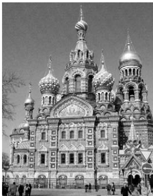
Catedral de San Salvador en San Petersburgo, Rusia.

Fue una unión demasiado frágil la que salió del Concilio, y no duró ni siquiera un decenio; sin embargo, los misioneros franciscanos, esparcidos por todo el Oriente, hacían una obra de acercamiento “ecuménica” importante con el ejemplo de la vida y con el testimonio de la palabra. Durante todo el siglo se multiplicaron las expediciones de los Hermanos en Bulgaria, Serbia, Rusia, Georgia, Armenia, Líbano y Persia. Fray Juan de Pian del Carpine logró traer a la comunión con la Iglesia de Roma a un duque de Moscú y a un prelado de Albania. Otros Hermanos aseguraron las buenas relaciones entre Georgia y Roma y consolidaron la unión de Armenia, al punto que el rey armenio Haytón II llegó a recibir el hábito franciscano con el nombre de fray Juan. En los Balcanes, en