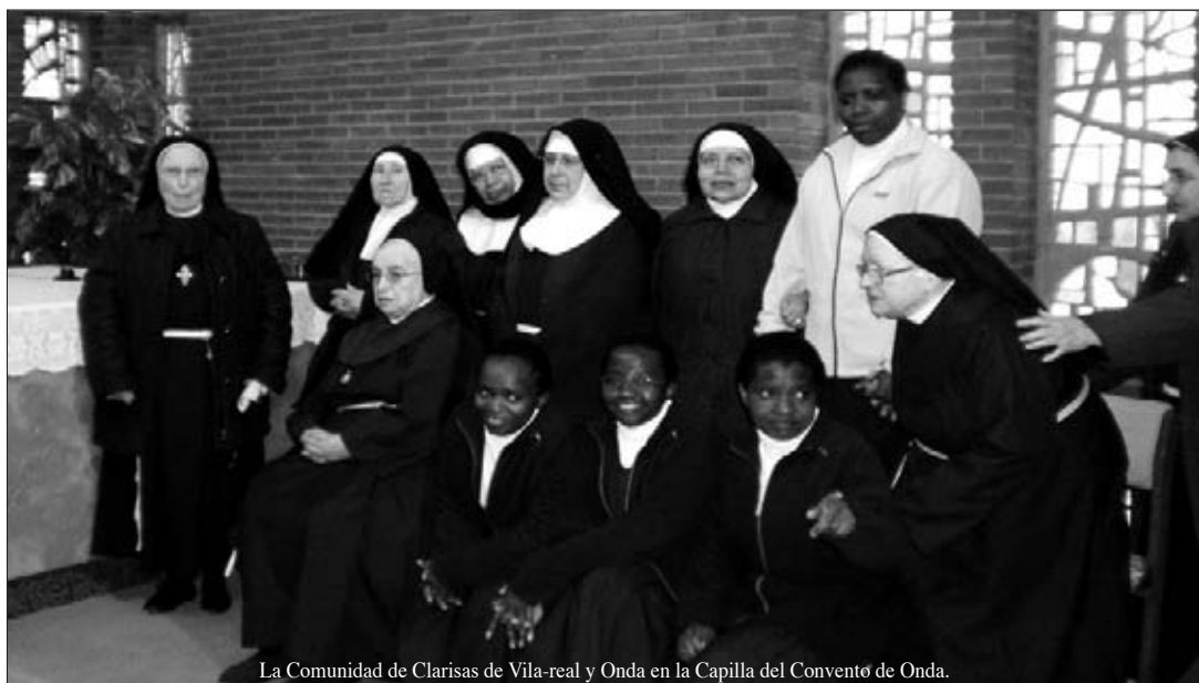
La Comunidad de Clarisas de Vila-real y Onda en la Capilla del Convento de Onda.