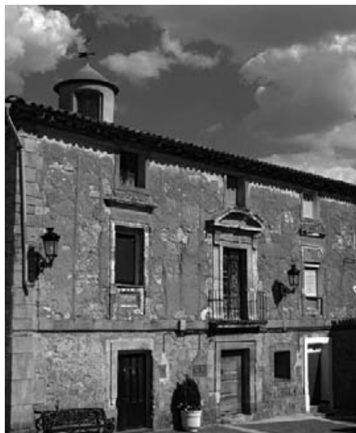
Casa Palaciega del Arzobispo Fabián y Fuero en la Plaza Villarreal de Torrehermosa (Aragón).

Todo había sido urdido por el duque de la Roca, para lograr la separación del