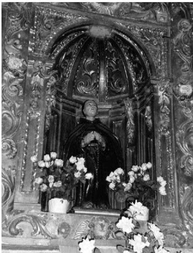
Imagen de San Pascual en el altar de la Ermita de Torrehermosa.

Después de la comunión celebrada en la capilla provisional, instalada en el antiguo