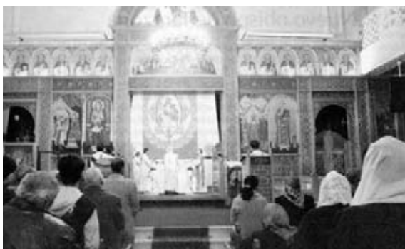
Cristianos egipcios rezan en la iglesia de los Santos, en Alejandría, por las víctimas del atentado sufrido en este templo.

Al ser restablecido el patriarcado el 26 de noviembre de 1895, fue recreada la Eparquía de Alejandría, y se separa de ella a las nuevas eparquías de Luxor o Tebas y Menia. Al ser nuevamente revivido el patriarcado el 10 de agosto de 1947 fue creada la eparquía de Asiut, separada de la de Luxor. El 13 de septiembre de 1981 fue erigida la Eparquía de Ismailia, separada de Alejandría. La última Diócesis copta católica fue la Eparquía de Guiza, separada de la de Alejandría el 21 de marzo de 2003.