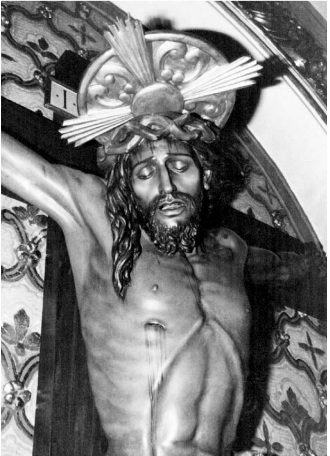
Santísimo Cristo del Hospital. Preciosa imagen, obra de D. Pascual Amorós 1940. Venerada en su capilla de la calle Hospital.