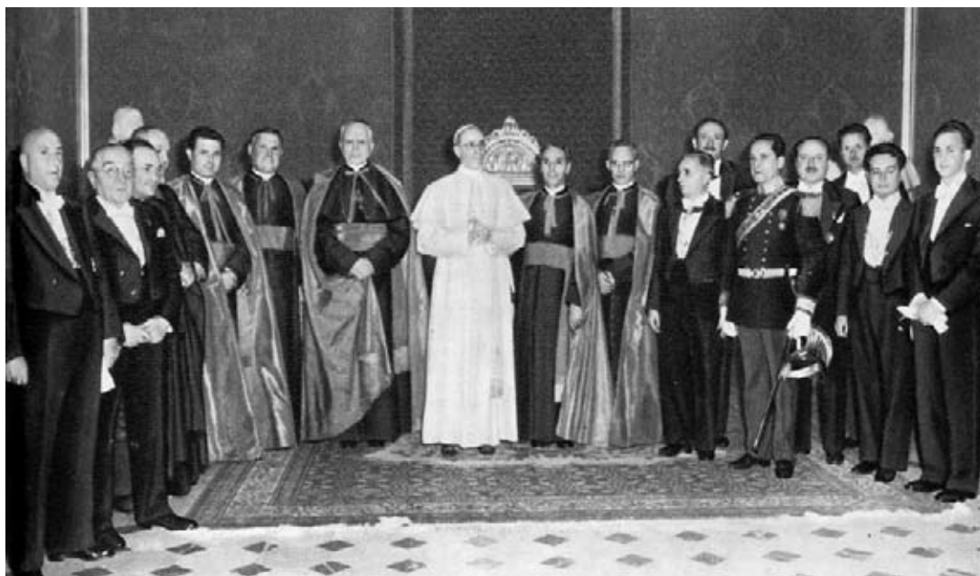
S.S. Pío XII, con la Misión Pontificia para el congreso Eucarístico de Barcelona.

“León Papa XIII: Para perpetua memoria.- La suma providencia de Dios, que dispone todas las cosas de un modo a la vez fuerte y suave, atendió a su Iglesia por manera tan particular, que precisamente cuando las circunstancias se muestran menos favorables la ofrece motivos de consuelo suscitados de la misma acerbidad de los tiempos. Esto, que en otras edades se ha visto con frecuencia, puede apreciarse sobre todo en las actuales circunstancias de la sociedad religiosa y civil, en las que, levantándose los atentadores de la pública tranquilidad con creciente insolencia y procurando con ataques fortísimos destruir la fe de Cristo y aún toda la sociedad, plugo a la Bondad divina oponer a estas perturbaciones los preclaros trabajos de la piedad cristiana. Lo cual, ciertamente, manifiesta la devoción al Sagrado Corazón de Jesús, difundida por todas partes; el celo que en todo el mundo se despliega en acrecentar