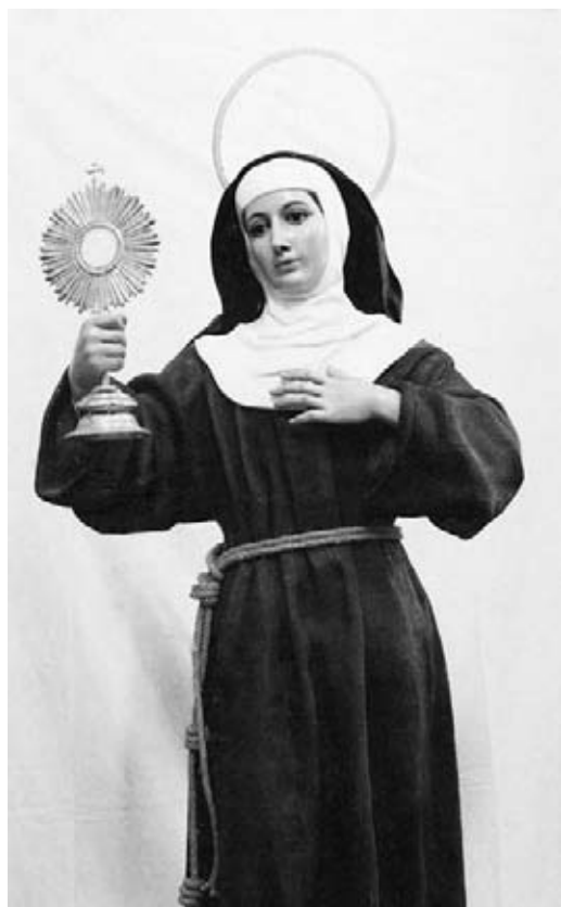
Santa Clara. Talla para vestir. Onda.

Fueron pasando unos días de aparente calma. Los Ofreducci no quieren escándalos. La noble solera familiar huye y evita comenta-