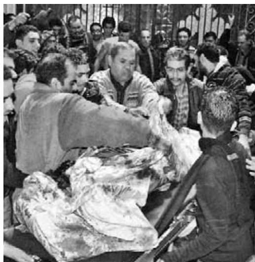
Una de las víctimas de la explosión en Alejandría.

Los cristianos coptos son los egipcios conversos al cristianismo en el siglo primero. No sucumbieron al Islam y constituyen el 10 por ciento de los más de 80 millones de egipcios que habitan en el país. De hecho sufren discriminación para ocupar puestos en el Estado y en el ejército, y desde hace años son objeto de atentados islamistas.