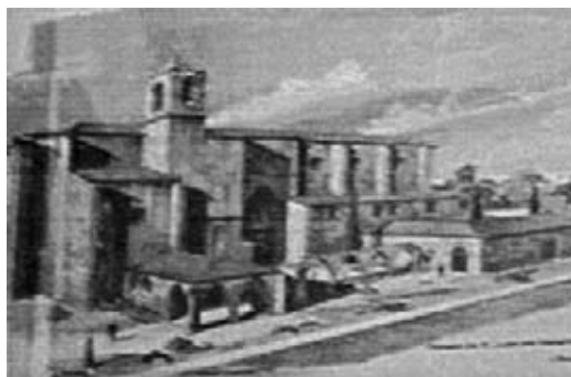
Conjunto de San Juan del Hospital.

Otras actividades que se realizaban consistían en volteos de campanas, recorrido de dulzainas por las calles y disparo de fuegos artificiales durante los nueve días, cuarenta horas de oración, una misa cantada con orquesta, serenata nocturna a la puerta de la parroquia, festejo popular conocido como “entrá de la murta” consistente en una gran cabalgata alegórica con carros adornados y artísticas grupas, que recorría los caminos hasta el Grao de la ciudad acompañada por una banda de música, una procesión claustral, disparo de una traca de grandes dimensiones que saliendo de la iglesia de Santo Tomás recorría la calle del Mar, la Glorieta, el Llano