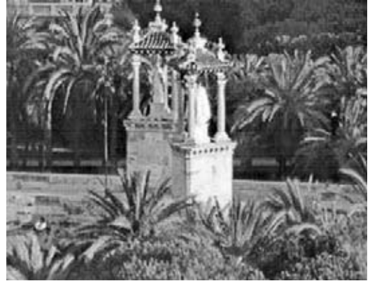
Altarcillos sobre el puente del Mar de Valencia, uno dedicado a San Pascual Baylón y otro a la Mare de Deu, por este puente se accedía al convento de San Juan de la Ribera.

Esta cofradía tiene como objetivo: fomentar el culto al Santísimo Sacramento y a San Pascual Baylón, transmitir la doctrina