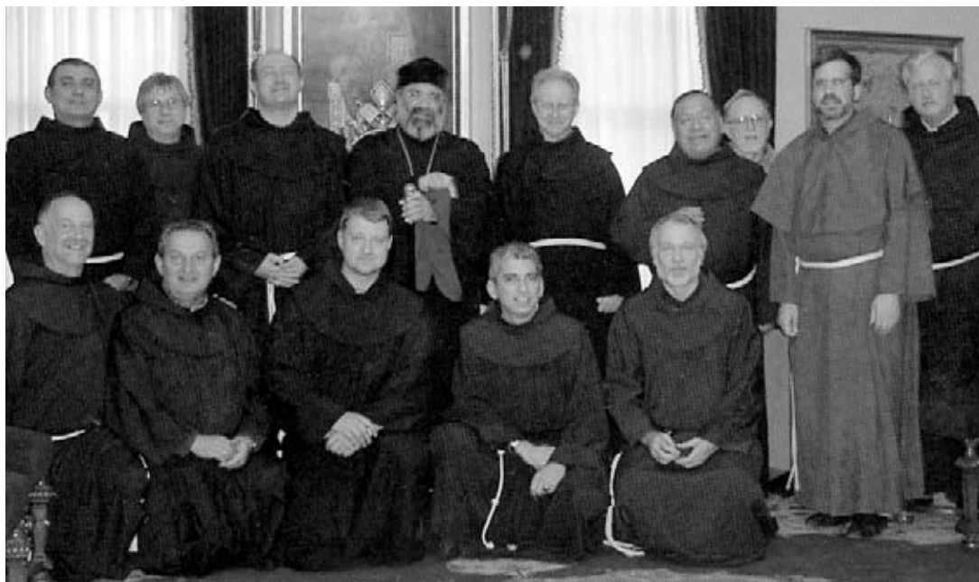
Encuentro Ecuménico con el Patriarca Armenio.

pastoralmente a las pequeñas y numerosas comunidades católicas esparcidas por todo el territorio. Mientras se abrían las nuevas presencias, los Franciscanos organizaban otros encuentros con el monaquismo ruso y reflexiones sobre las afinidades entre la espiritualidad franciscana y la ortodoxa. En 1997, la Orden creyó maduro el tiempo de constituir también jurídicamente, en 1997, una nueva Entidad franciscana dependiente del Ministro general, la Fundación de San Francisco en Rusia y Kazajstán.