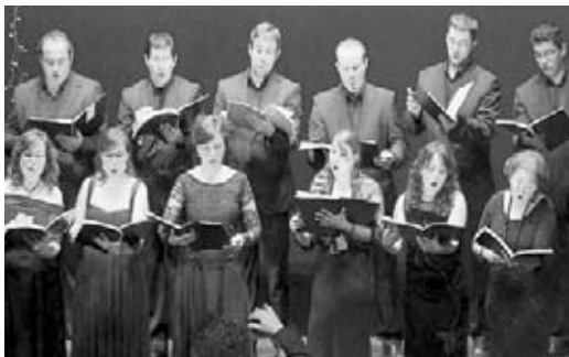
La Agrupación “Veus de Cambra”.

SÁBADO 9 ABRIL.- A las 22 horas Vigilia Ordinaria en la Basílica, de la Adoración Nocturna Femenina.