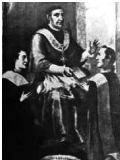
D. Francisco Fabián y Fuero entregando los evangelios a unos seminaristas.

Enterrado en la Iglesia de Santa María la Blanca de Torrehermosa, bajo una lápi-