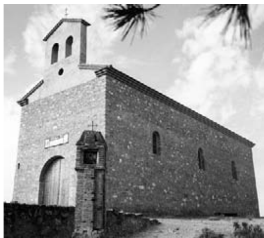
Ermita de San Pascual en Torrehermosa (Aragón).