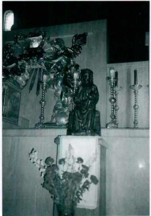
Imagen de Ntra. Sra. de Gracia Patrona de Vila-real en el altar Mayor de la Basílica.