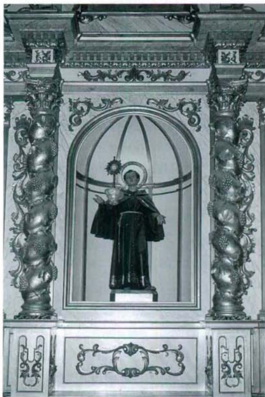
Altar e imagen de San Pascual en el Santuario de la Vallivana de Morella.