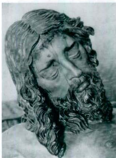
Juan de Mesa. Cristo de la Buena Muerte, en la Capilla de la Universidad de Sevilla.

Triste Ella... te confunde. Tu mirada agoniza y tus ojos penetrantes suplican perdón y dicha.