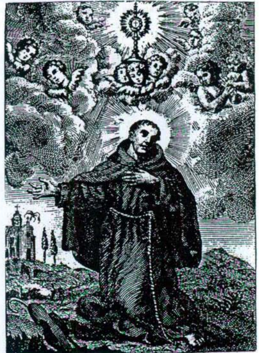
SAN PASQUAL BAYLON.