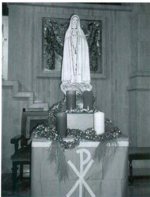
La Corona del Adviento y Ntra. Sra. de Lourdes en la Basílica.