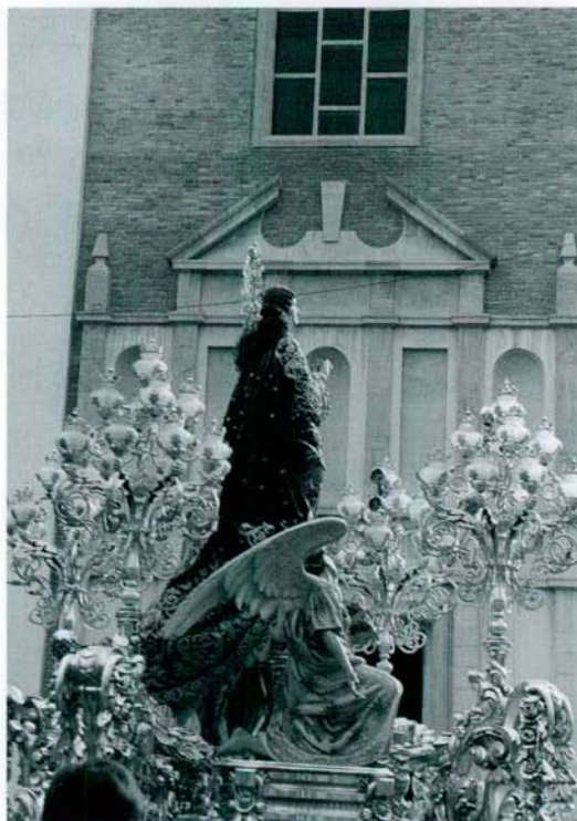
La Inmaculada en la fachada de la Basílica.

“Sois concebida María sin pecado original.”