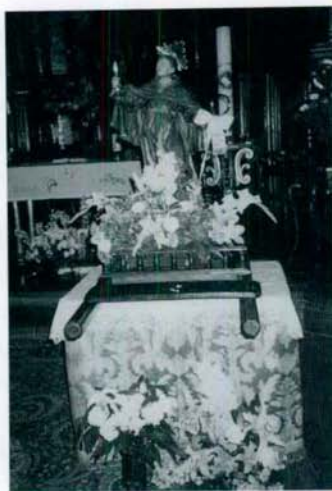
Imagen de San Pascual Baylón, denominada popularmente como: "El fraile del garrotillo de plata".