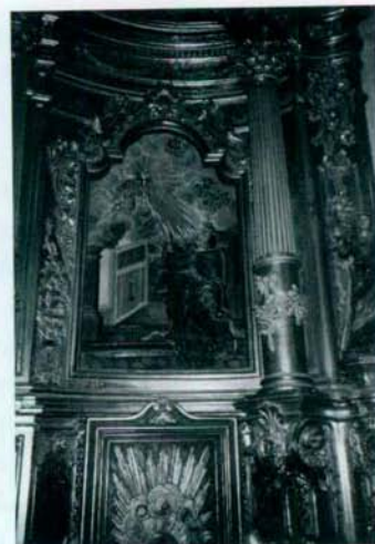
Detalle altar mayor Iglesia de San Pedro.