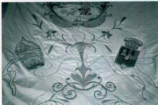
Actual Bandera de San Pascual.

Les informamos a todos los lectores, a través de estas líneas de la Vida del Santuario, que en la próxima revista de San Pascual, publicaremos una lista, con la relación de todos los donativos, que nos han hecho llegar a la Basílica. Al mismo tiempo que agradecemos el interés de todos los devotos de San Pascual y simpatizantes para culminar pronto la Bandera del Santo y poderla bendecir en vísperas de su festividad.