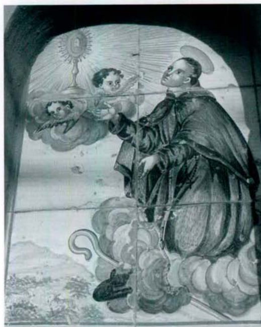
Cerámica de San Pascual en un peiron de Alcorisa (Teruel).

Pascual, al llegar a Vila-real, en su última estancia y definitiva (otras serían de paso o sólo de alguna corta temporada), venía preparado su cuerpo y su espíritu con la penitencia, de la que bien podían hacer gala los frailes alcantarinos, a ejemplo de su fundador, más bien reformador, S. Pedro de Alcántara. Santa Teresa de Jesús conocía bien las penitencias de este santo y lo definía, al recordar su figura, como "hecho de raíces de árboles" y así lo apreciamos en la Imagen que el escultor Ignacio Vergara talló para la