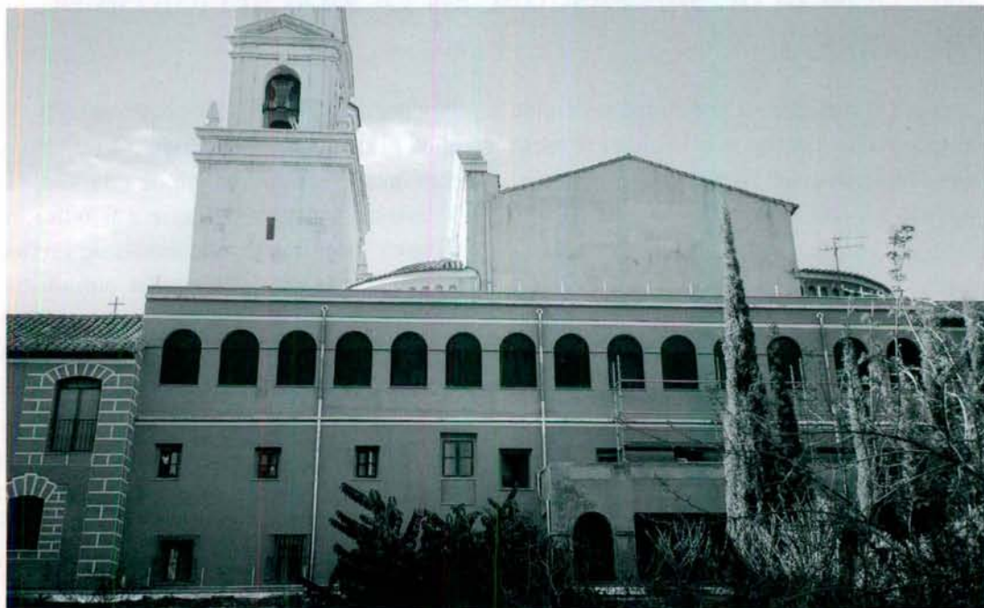
Las fotografías nos muestran como van quedando las fachadas del convento de San Pascual después de su restauración por los técnicos de la Generalitat Valenciana.