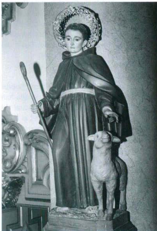
Imagen de San Pascual. Iglesia de la Natividad de Almazora.

En un mundo donde el Hombre basa su primacía en el poder o en el dinero, en la