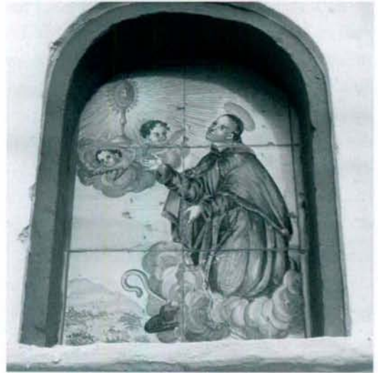
Cerámica de San Pascual Alcorisa (Teruel).

Contemplemos, así, el esquema que S. Pascual se construye para la meditación de la Pasión: a) empieza por la traición de Judas, tomando pie del Salmo que dice: “El hombre que tenía paz conmigo y que comía de mi pan, magnificó sobre mí su engaño para derribarme” ; y sigue poniendo en labios de Cristo la queja amorosa del que se siente traicionado por su mejor amigo: “Si mi enemigo me maldijera, lo hubiera sufrido y si el que me aborrecía hubiera hablado grandes cosas contra mí, por ventura me hubiera escondido de él; pero, tú, hombre, que te mostrabas ser mi amigo y de una voluntad conmigo, capitán mío y conocido mío, que juntamente conmigo comías de los dulces manjares y que anduvimos en la casa de Dios con sentimiento y concordia..(Salmo 54 13-15) . Como quien dice: ¡que tú habías de ser el que habías de hacer una traición como ésta!”. S. Pascual siente en si mismo la realidad del Cristo traicionado y padece lo horrible de la traición que comporta todo pe-