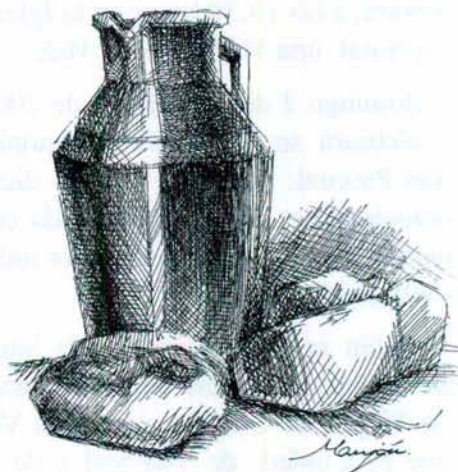
El cántaro de aceite y el pan.

Un día, la prueba del Señor se hizo más patente que de costumbre. Aquella tarde llovía casi torrencialmente. Desde el Subasio bajaban verdaderas cortinas de agua impulsadas por ráfagas de viento, que azotaban implacables las débiles paredes del bastión de La Pobreza. El frío era más intenso que de costumbre ya que la lluvia provenía de las alturas nevadas de los montes vecinos. El sol no se había dejado ver en toda la tarde y ya era casi