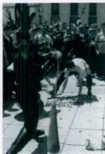
Los Zarrones dando zambombazos