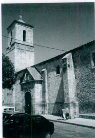
Iglesia de San Pedro.