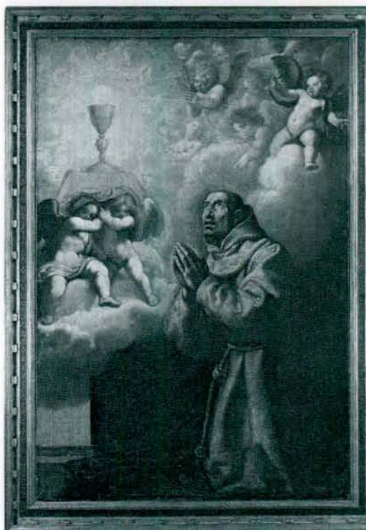
San Pascual. Óleo de Vicente Carducho.

El Santo Cura de Ars afirmaba que "todas las buenas obras del mundo reunidas no equivalen al Santo Sacrificio de la misa, porque son obras de los hombres, mientras