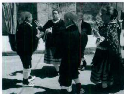
Grupo de danzantes y palillero.