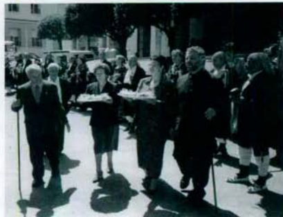
Mayordomo y cofrades con las roscas de ofrenda a San Pascual.

Con el tiempo al tratar de defenderse los zarrones con la zambomba, animaban a la gente a desafiarlos con actos de valentía, dando pie a la popular tradición que se sigue hoy manteniendo.