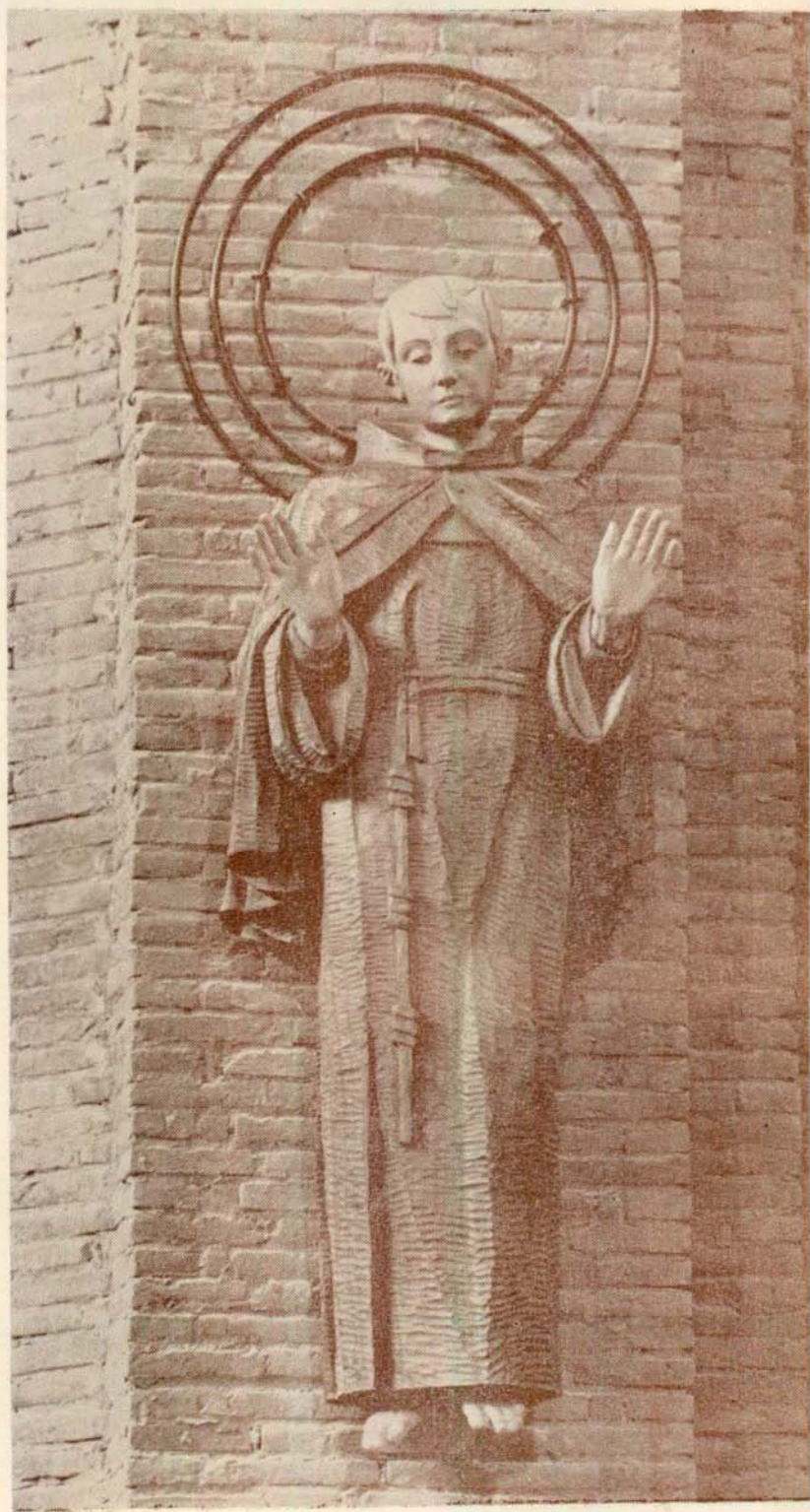
Imagen de San Pascual que se venera en su Templo de Villarreal, obra del escultor Rdo. H. Pedro Gil, S.I.