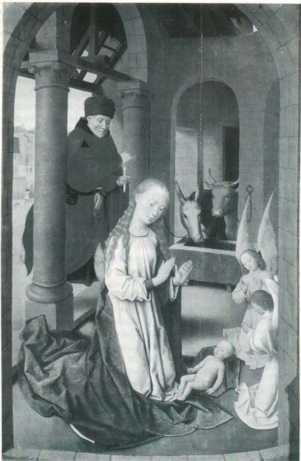
LA NATIVIDAD. OBRA DE MEMLING. MUSEO DEL PRADO.