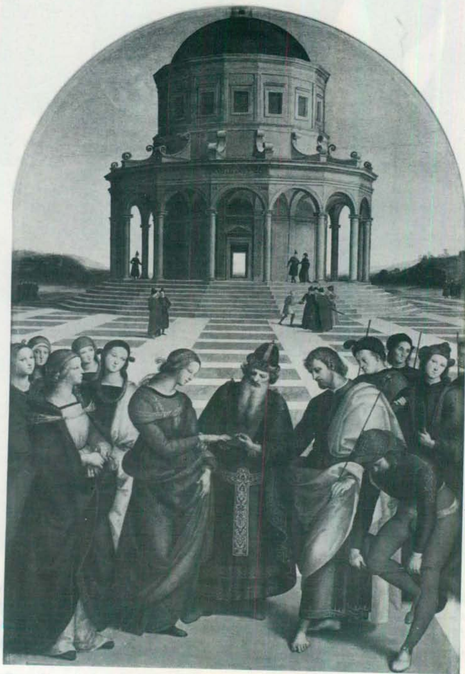
LOS DESPOSORIOS DE LA VIRGEN. OBRA DE RAFAEL. MILAN