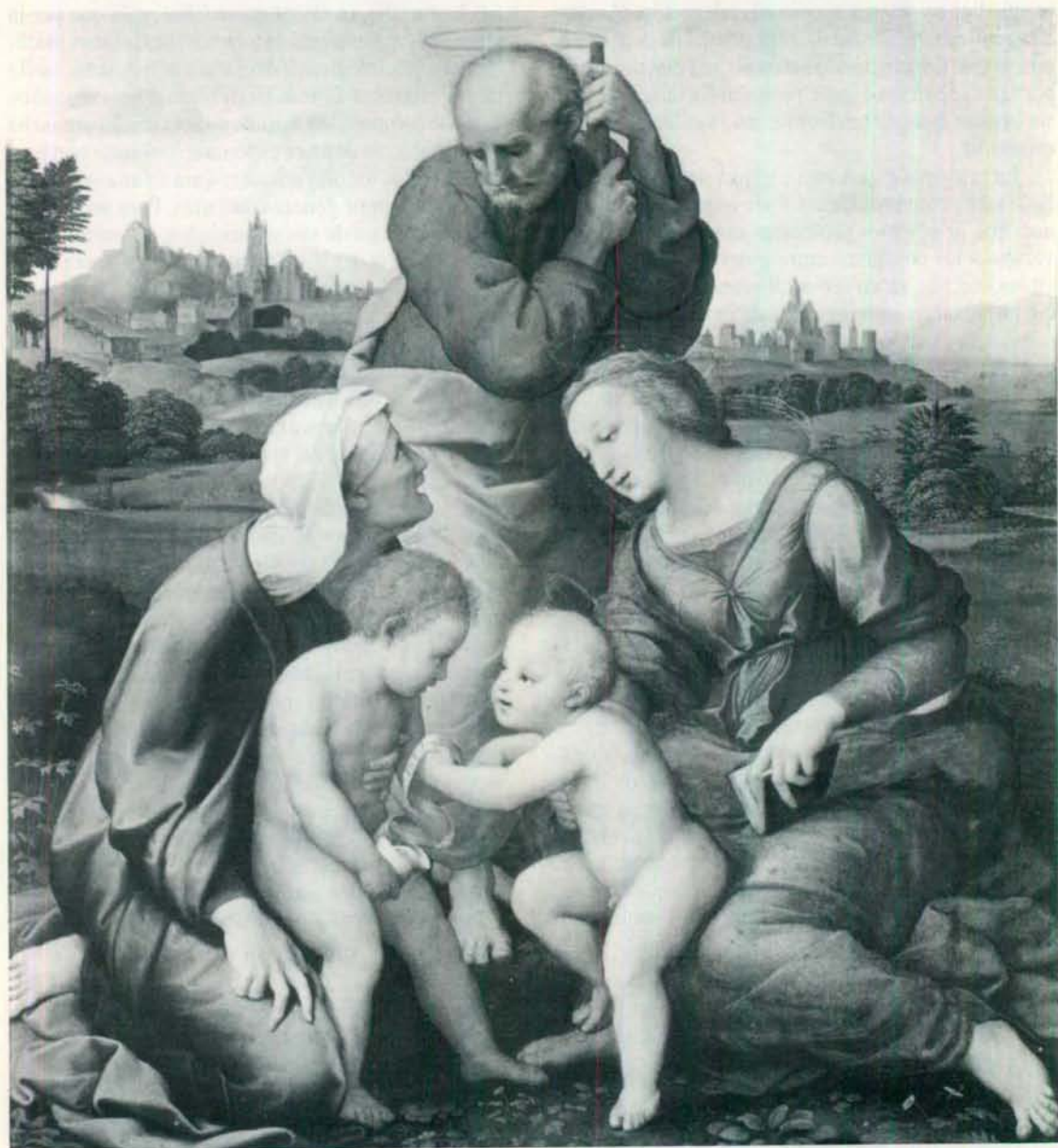
SAGRADA FAMILIA. OBRA DE RAFAEL. PINACOTECA DE MUNICH.

Nunca como hoy, el ser humano ha asistido a tantos y tan frecuentes cambios que condicionan su forma de vivir e incluso de pensar. En un mundo en transformación, ¿Qué cambia y qué permanece de la familia? ¿Cuál debe ser el perfil y la misión de la