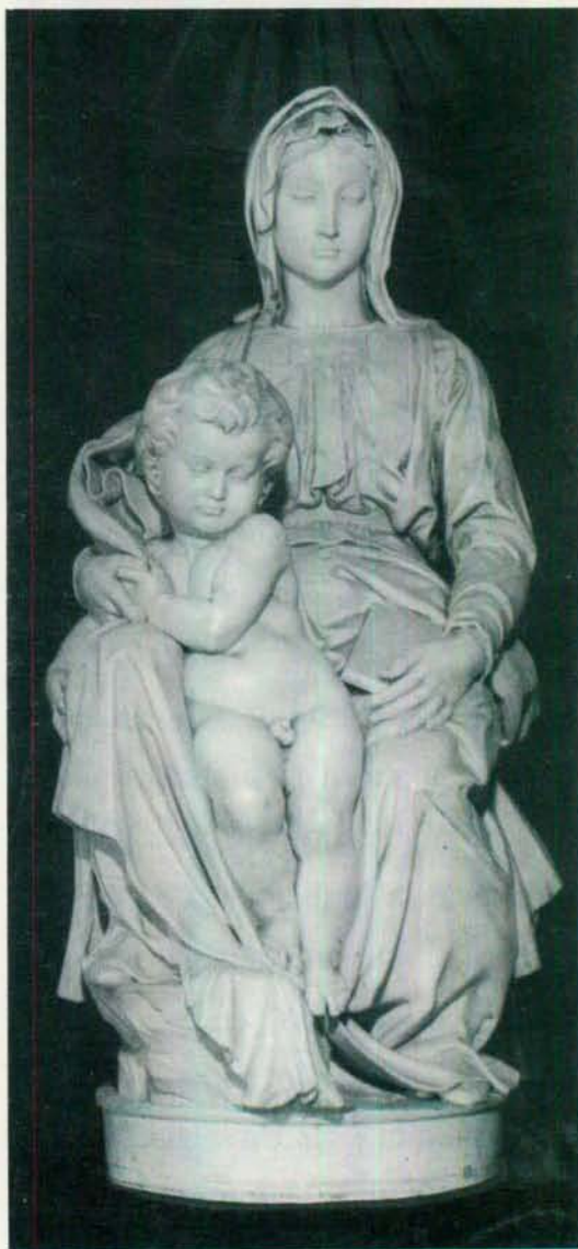
MADONNA. OBRA DE MIGUEL ANGEL

carne" (Gn 2, 18, 25). Que esto significa una unión indefectible de sus dos vidas, el Señor mismo lo muestra recordando cuál fue "en el principio", el plan del Creador: "De manera que ya no son dos sino una sola carne" (Mt 19, 6).