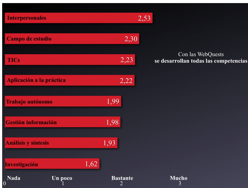
Figura 1 Desarrollo de competencias con WebQuests

Por lo que respecta a tipos de competencias, las competencias que más se han desarrollado han sido las interpersonales, seguidas de las instrumentales y de las sistémicas. La representación gráfica de esta conclusión, se presenta en la Figura 2.