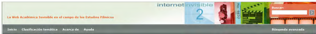
Figura 1. Acceso al menú y opciones de búsqueda del DTE

Su función principal, además de mostrar al usuario los últimos registros introducidos en el sistema o novedades y la sección de noticias o advertencias que desee publicar el administrador, es ofrecer las dos posibilidades de consulta de los recursos.