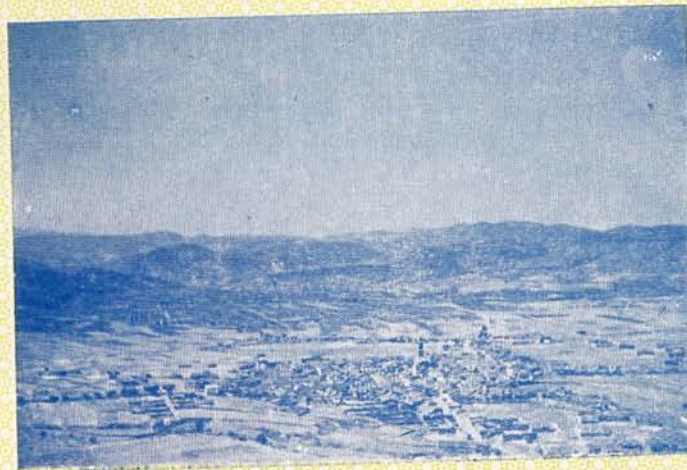
PANORÁMICA DE ALCUBLAS DESDE EL CERRO DE LOS MOLINOS

ORGANIZADAS POR LA COLONIA ALCUBLANA EN VALENCIA PATROCINADAS POR EL ILMO. AYUNTAMIENTO DE ALCUBLAS