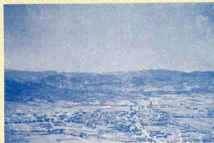
PANORÁMICA DE ALCUBLAS DESDE EL CERRO DE LOS MOLINOS

ORGANIZADAS POR LA COLONIA ALCUBLANA EN VALENCIA PATROCINADAS POR EL ILMO. AYUNTAMIENTO DE ALCUBLAS