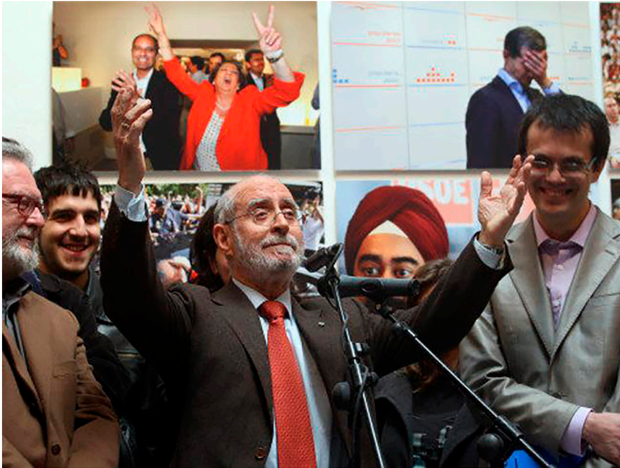
Reinauguració de Fragments , març de 2010.

mostres titulades: «La impremta valenciana al segle XVIII» (2006), «Del carbonet al píxel», «Els hotels de la imaginació» (2007), «Ramón Casas i el Cartell» (2005), «Els cartells de Toulouse Lautrec» (2005), «Els Ex-libris i la seua història» (2007), «D'après, versions, ironies i divertiments» (2005), «El mono de l'Anís», «100 cartells valencians al Museu de Wilanów» (2007), «Artel: el disseny a la vida quotidiana» (2010), «Escrits al marge», «Els cartells de cinema de Muñoz Bas» (2007), «Els teatrets de cartró» o «Suma i segueix del disseny a la Comunitat Valenciana» (2009). També caldria apuntar la convocatòria de rellevants congressos com, per exemple, «Cartellisme i Modernitat» (2005) o «La memòria de les