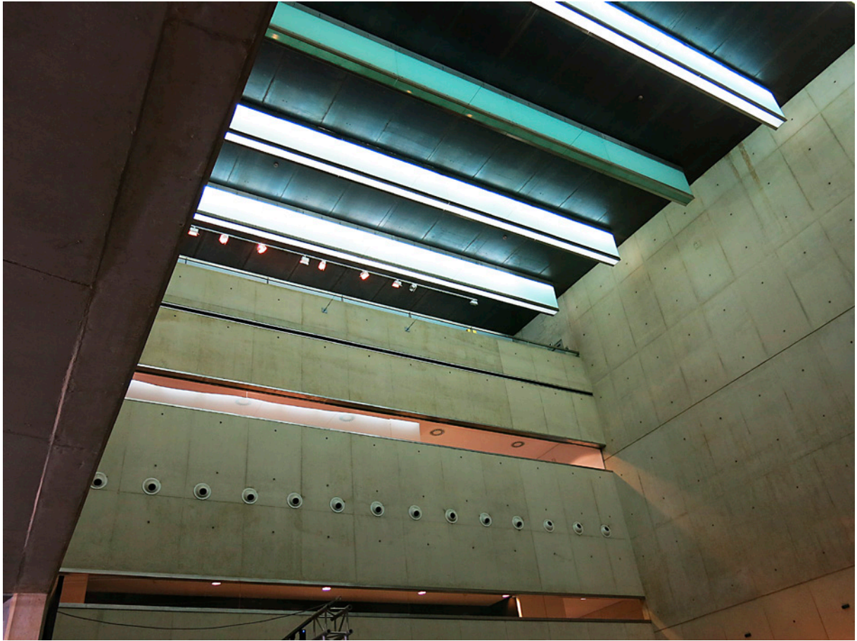
«MUVIM, Museu Valencià de la Il·lustració i de la Modernitat, interior»

Quin seria el fil conductor del meu programa? Amb aquest interrogant, marcat al front, vaig anar recurrent, de nou, –encara com a simple/curiós i atent visitant– els diferents espais del museu, en la seva grandesa i rotunditat. En poc temps, les coses havien canviat i per a mal, respecte a l'elogiat centre. Alguns d'aquests espais eren utilitzats, gairebé sistemàticament, des del (aleshores) prepotent Consorci de Museus de la Generalitat, per muntar les seves pròpies exposicions, mentre que la zona dels despatxos i d'altres serveis de l'edifici, havien estat, també, ocupats a distància, manu militari , pel conjuntural director de la Institució Alfons el Magnànim. El repte estava, doncs, ben clar. Caldria començar desallotjant