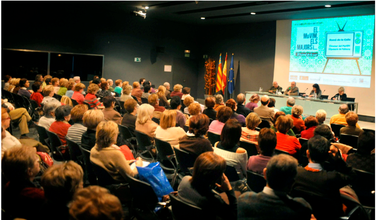
MUVIM, saló d'actes.

sempre agudament interrogatives i directes, a les seves convocatòries i assemblees més properes a aquelles dates. Poques vegades, al meu cicle vital, m'he sentit tan directament connectat a la flagrant actualitat, en decisions i propostes referents al museu, com aleshores.