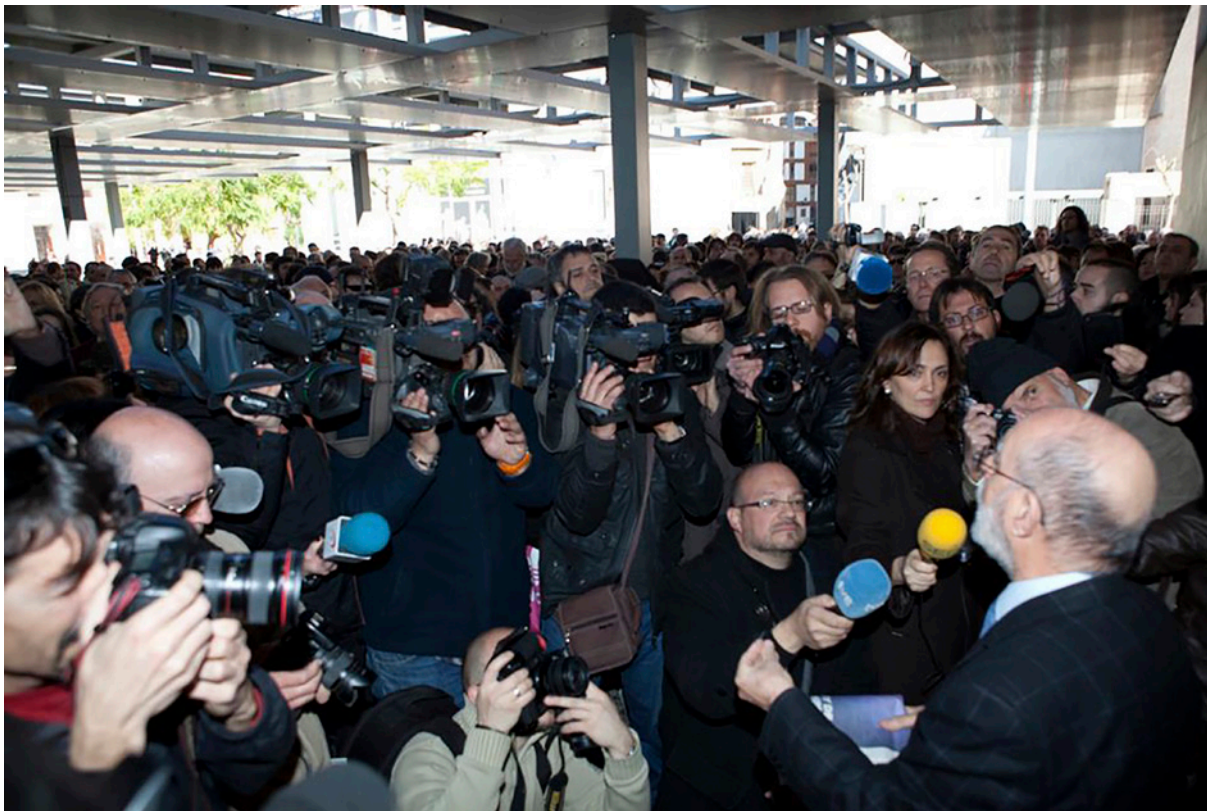
Manifestació enfront del MUVIM, després de la dimissió del director, per la censura exercida institucionalment. 8 de març de 2010.

En aquesta línia de commemoració, volem finalitzar apuntant com, a partir del Postgrau d'Educació Artística i Gestió de Museus, engegat fa més de cinc lustres, a l'Institut de Creativitat & Innovacions Educatives de la Universitat de València –que ha merescut el reconeixement de la seva «Excel·lència» per part de l'ADEIT, Fundació Universitat-Empresa– s'ha creat AVALEM (Associació Valenciana d'Educació Artística, Museus i Patrimoni), el 2013, per gestionar i defensar els professionals d'aquest segment educatiu, propiciant formació, integració i perfeccionament. Associació oberta a tots aquells que estiguin interessats en aquesta àmplia i complexa tasca que correlaciona l'art i l'educació, els museus, la gestió i el patrimoni. Associació que encara està funcionant excel·lentment.