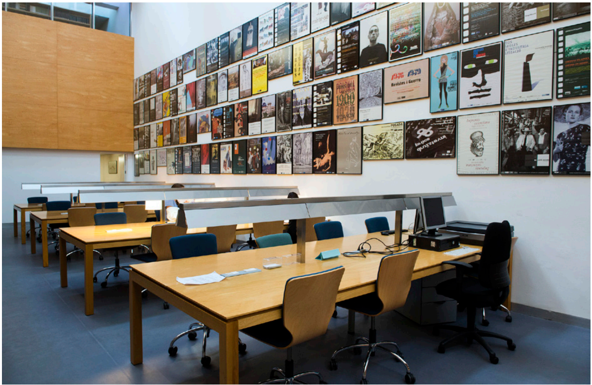
Biblioteca del MUVIM.

censura institucional i la consegüent dimissió del director i, com a allau, el debat social, posterior, hagut. De fet, doncs, les experiències d'aquells programes, que volien acostar la ciutat al museu i el museu al barri, eren certament perilloses. I així queda recollit pel pols de la història, de la nostra història ciutadana i museística.