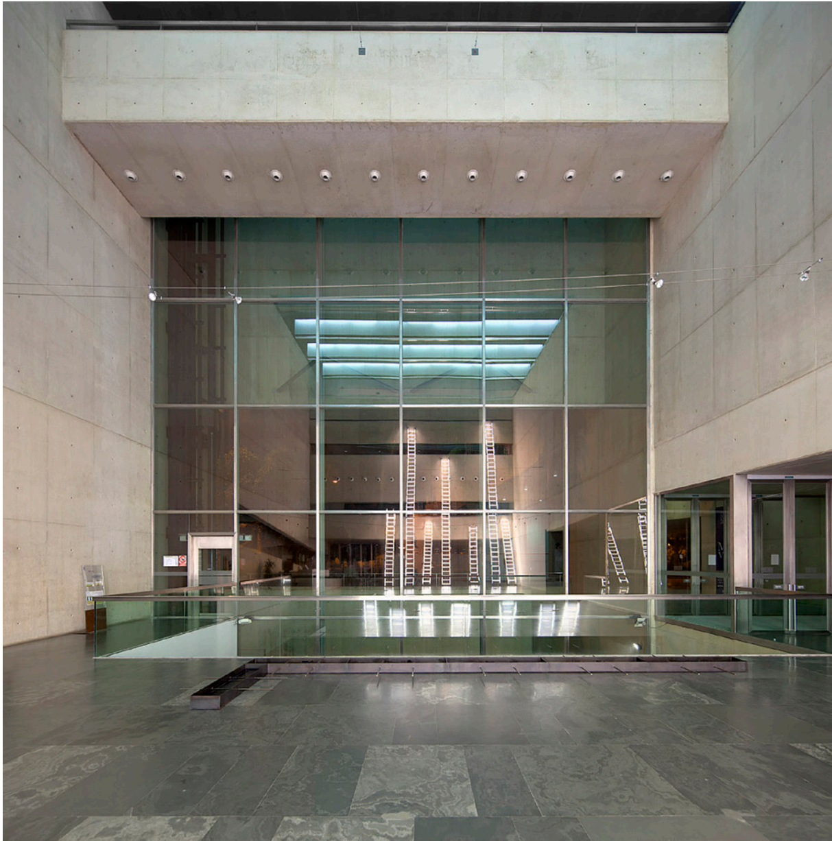
Vestíbul del muVIM, espai visitable.

decidir. I aquesta és la història que, operativament, voldria exposar, en les pàgines d'aquesta revista, especialitzada en museus, com a lliçó estratègica i metodològica, davant de les possibilitats, que realment vaig viure, de sobte, com a protagonista involuntari, barrejant el destí, en aquesta partida de cartes, jugada contra mi mateix, mentre anava engegant-se –al meu cap i als meus papers– l'allargada ombra del nou