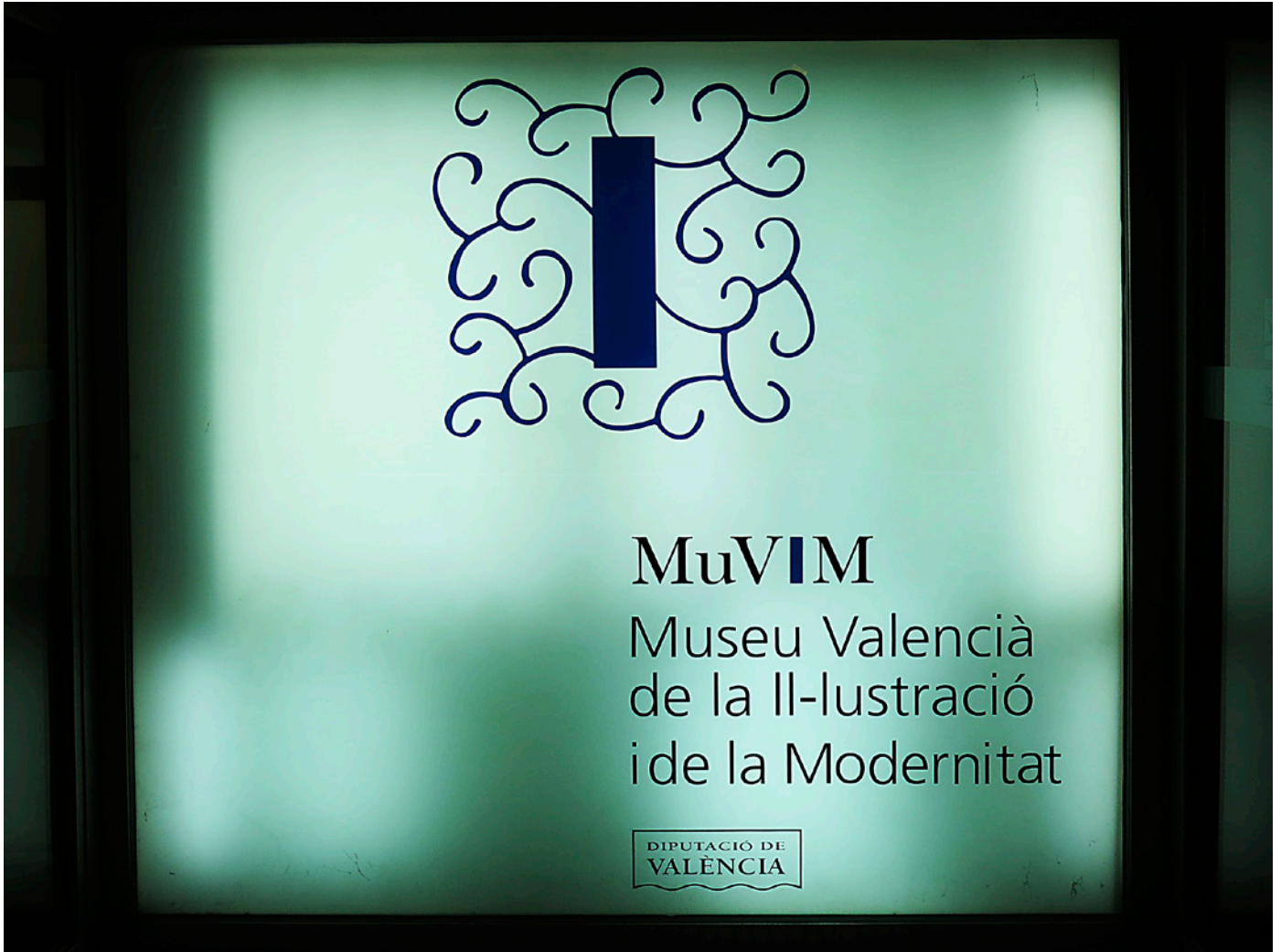
«MUVIM, Museu Valencià de la Il·lustració i de la Modernitat, logotip» per Enric sota llicència CC-BY-SA 4.0.