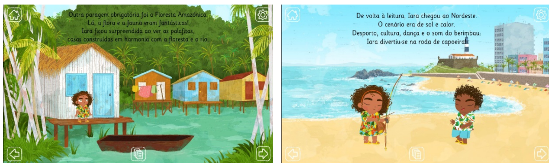
Figura 4. Uso de colores fríos en la representación de elementos naturales.

Además de estos aspectos, en lo referente a la representación de lo que se focaliza, el análisis reveló la alternancia de focalización entre episodios, con punto de vista externo (nueve) y punto de vista del personaje (uno), habiendo un caso en que se da una alternancia de focalización en el episodio entre la imagen estática, que presenta el punto de vista del personaje, y la imagen en movimiento, que presenta el punto de vista externo. Esta alternancia de focalización puede entenderse como una estrategia para la implicación de la lectora o del lector.