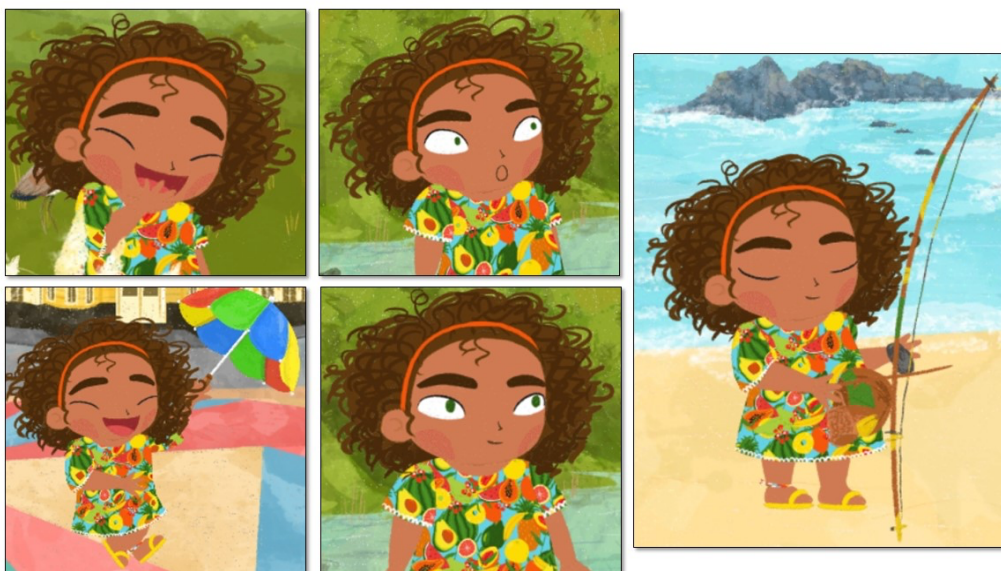
Figura 2. Estilo genérico de representación del personaje.

Otras características de la representación del personaje –distancia social, implicación, contacto visual y poder– contribuyen igualmente a la construcción de este posicionamiento. Así, el personaje se construye mediante varios encuadres (amplio, medio y close-up ), dependiendo del momento de la historia, lo que crea situaciones de