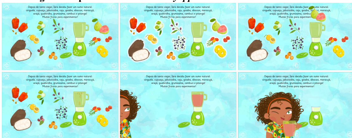
Figura 5. Episodio 6.

En el texto verbal, las relaciones del personaje son expresadas por medio de dos actitudes de apreciación, en las que el impacto positivo de lo que experimenta y ve se representa implícitamente mediante evaluaciones a partir de enfoque interno ( tanto viajar ) y de doble enfoque con discurso indirecto libre ( ¡tantas frutas para probar! ).