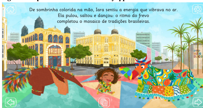
Figura 6. Episodio 10.

En la modalidad visual, la escena se representa mediante enfoque externo, con tres personajes en un encuadre medio, centrados, con ángulo horizontal frontal –indicando mayor implicación– y con ángulo vertical neutro –indicando una relación de poder neutro entre los personajes y los lectores. Los tres personajes están representados en estilo genérico, con expresiones faciales alegres y animadas que fomentan la identificación de los lectores. Con relación a la ambientación del episodio, la modalidad visual se caracteriza por la variedad de colores –sensación de familiaridad–, que crea un ambiente positivo con sensación de excitación y vitalidad (Figura 6). Finalmente, la modalidad auditiva presenta una música con ritmo de frevo y sonido de los personajes, todo ello colaborando a una ambientación realista y colorida que invita a los lectores a participar en la celebración.