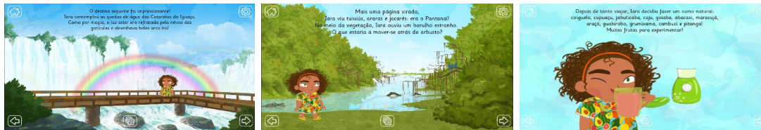
Figura 3. Diferentes encuadres en la representación del personaje (de izquierda a derecha: amplio, medio y close-up ).

El ángulo horizontal de presentación de la protagonista contribuye a una mayor implicación de la lectora o del lector, pues alterna posicionamientos semi-frontales (dominante) y frontales. Además, la protagonista es siempre presentada desde un ángulo neutro (sin dislocación de la angulación vertical), lo que permite que sea vista como «una de nosotras y nosotros», próxima a la lectora/espectadora o al lector/espectador. Por último, hay un momento en que el personaje mira directamente a la lectora/espectadora o al lector/espectador, estrategia que sirve para establecer una relación de máxima proximidad entre ambos y para que la última o último sea partícipe de su acción de apreciación.