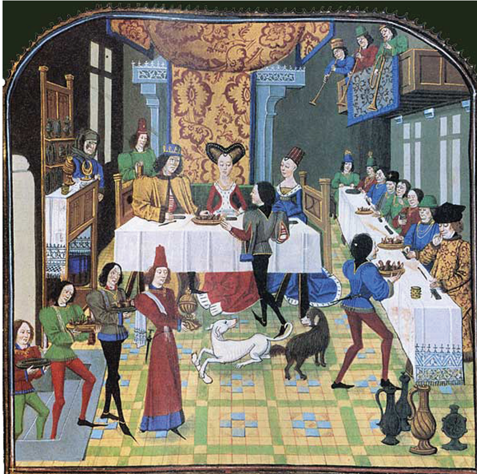
Figura 6. Histoire d'Olivier de Castille et d'Artus d'Algarbe . Banquete de bodas (fol. 181 V). Miniatura atrib. Loyset Liédet, ca. 1440 Bibliothèque Nationale de France. Français 12574

Y todo súbitamente fue arrostrada (subida) la dicha tapicería, y ellos vieron el dicho jardín. Y comenzó a aproximarse todo, movido por sutiles ingenios. Y había tres grandes ruedas más altas que el dicho jardín y esto fue la pera. 22