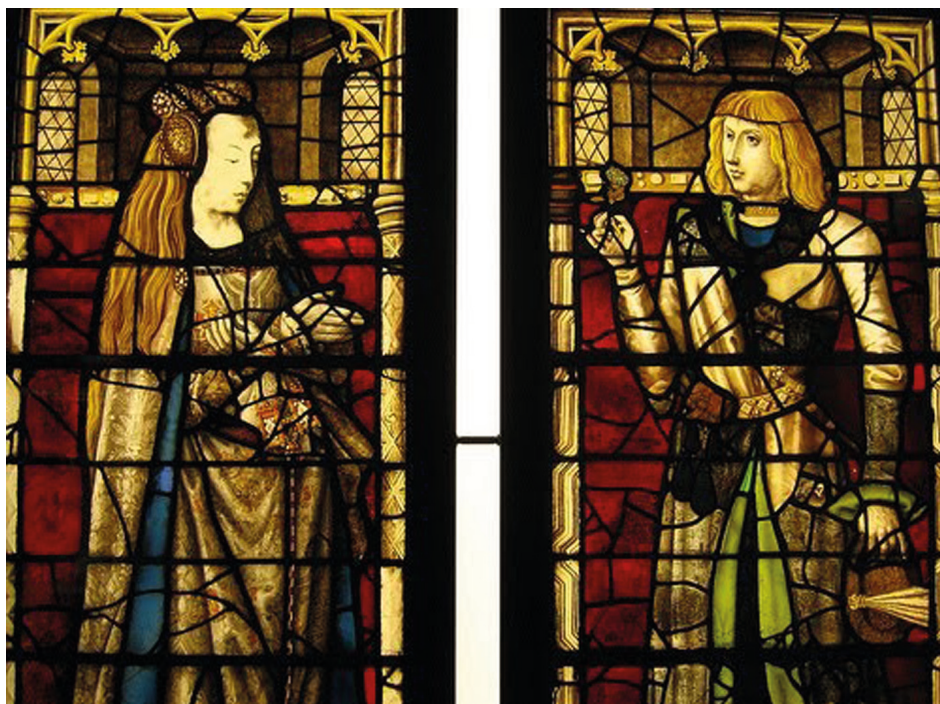
Figura 8. Juana I de Castilla y Felipe el Hermoso. Vidrieras de la Basílica de la Santa Sangre (siglo XIX, Inspiradas en los repertorios dinásticos que mostraban las vidrieras originales del siglo XV). Brujas, Bélgica.