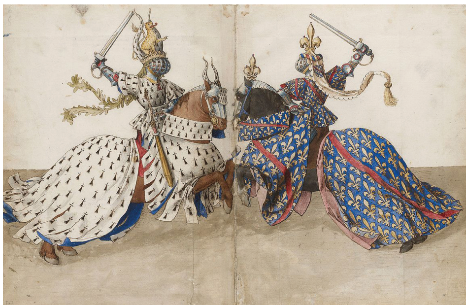
Figura 3. Libro de los torneos. Los duques de Bretaña y Borbón armados a caballo y con crestas como si estuvieran en el torneo. Biblioteca Nacional de Francia. Miniatura ca. 1460 de Barthélemy d'Eyck. Tinta lavada sobre papel

A comienzos del siglo XVI un grupo de textos, crónicas y diarios de viaje, recogen el singular viaje de aparato llevado a cabo por los archiduques de Austria que, partiendo de los Países Bajos, cruza Francia para llegar al corazón de Castilla: la ciudad imperial de Toledo. 7 A la luz de los contenidos expresados, llama la atención las diferentes fórmulas festivas desarrolladas a lo largo de dicho viaje [fig. 3]. No pueden pasarse por alto las justas que, para agasajo de los príncipes, fueron organizadas en Madrid el domingo 17 de abril, 8 o las que ofreció en Valladolid el Almirante de Castilla, a su vez, activo participante. 9 Pero, por encima de justas, juegos de cañas, entradas, misas, y otras celebraciones, lo que mayor sorpresa y «maravilla» causó entre los flamencos fue la cena banquete con la que el condestable de Castilla, Bernardino Fernández de Velasco, agasajó a los futuros príncipes.