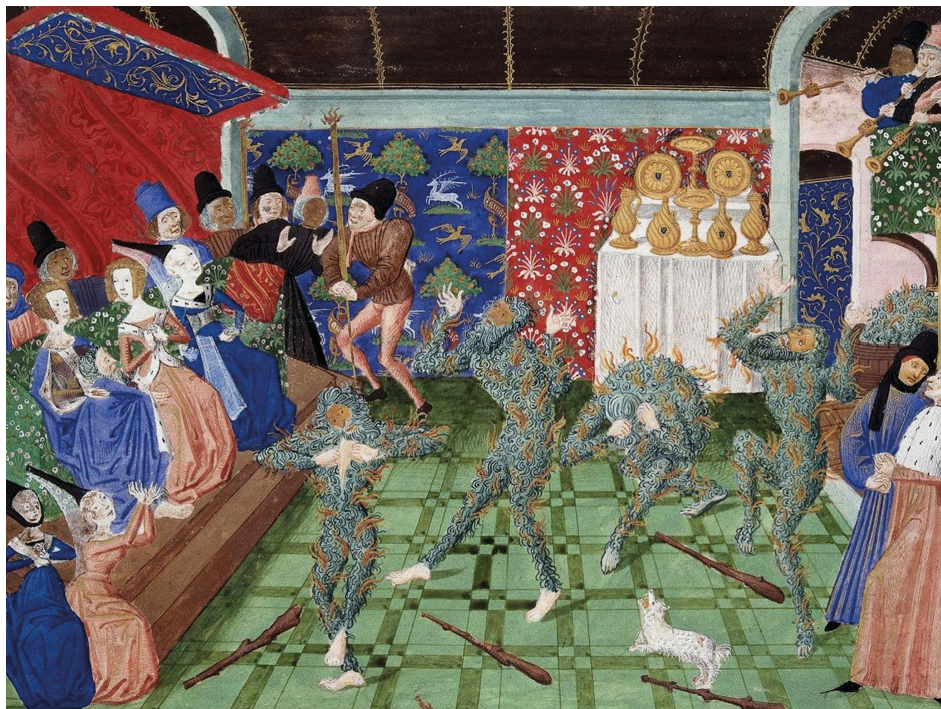
Figura 7. Crónicas de Jean Froissart. Le Bal des Ardents . Miniatura Philippe de Mazerolles, ca. 1470/1472 British Library. Harley 4380

La ficción amorosa de este tipo de textos (a diferencia de lo que sucede en los libros de caballerías en los que es el caballero/guerrero el gran protagonista) desgrana un ideario en el que la dama, por encima del caballero, es la poseedora de un ramillete de altas virtudes. 30 En este sentido, la existencia de la dama determina la del caballero quien recupera su identidad gracias a ella, reproduciéndose a través de la relación de ambos dama/caballero el reflejo especular de la habida entre señor/vasallo.