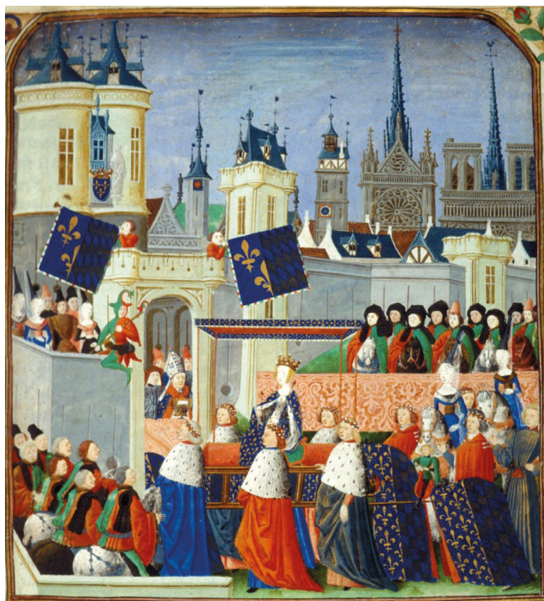
Figura 1. Crónicas de Jean Froissart. Entrada de la reina Isabel de Baviera en París en 1389. Miniatura ca. 1470/1472. BL Harley 4379. British Library (Inglaterra)

Un modelo que podría definirse como arte total , idóneo para ensalzar entradas en las ciudades, actos litúrgicos, funerales, bautizos, coronaciones y todo tipo de acontecimientos en los que, de forma sutil, habían de simbolizarse las relaciones del poder [fig. 1]. Un todo, en el que el espectador era sujeto en interacción, que cualificaba un espacio de frontera entre la realidad y la ficción. Una complejidad ambigua que alcanzó su plenitud en la fiesta, al ser esta una experiencia ceremonial con ciertos ribetes herméticos, que buscaba la recreación consciente de una especie de «Reino de la Gracia» alumbrado por el buen gobierno del «Príncipe» y los frutos derivados de este.