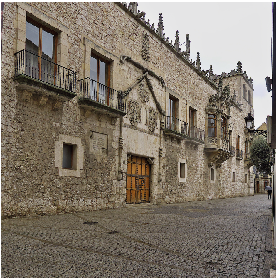
Figura 4. Fachada principal de la Casa del Cordón, Burgos . Fotografía de José Luis Filpo Cabana 2013 (Wikimedia Commons, imagen libre de derechos de autor)

misas y otros oficios litúrgicos, los príncipes fueron obsequiados con múltiples funciones entre las que se encontraban las fiestas de toros, los castillos de fuegos artificiales, los juegos de cañas y otros espectáculos dispuestos en la plaza del Mercado Nuevo, delante de la fachada principal del palacio. Para este fin, el condestable había hecho instalar, a la altura de las galerías, una tribuna que permitía a los príncipes asistir a las diversiones sin tener que sufrir la incómoda cercanía de las gentes. 15