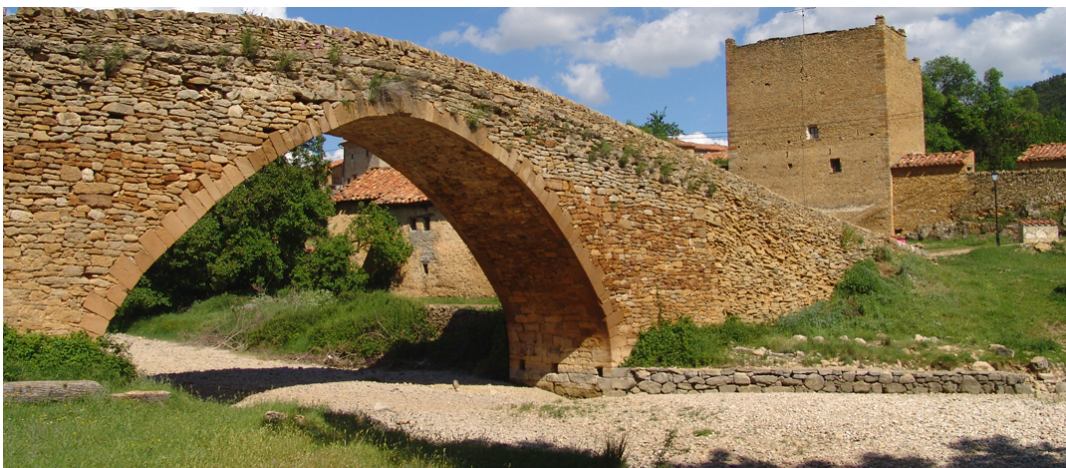
(Pont gòtic de la Pobla del Bellestar)