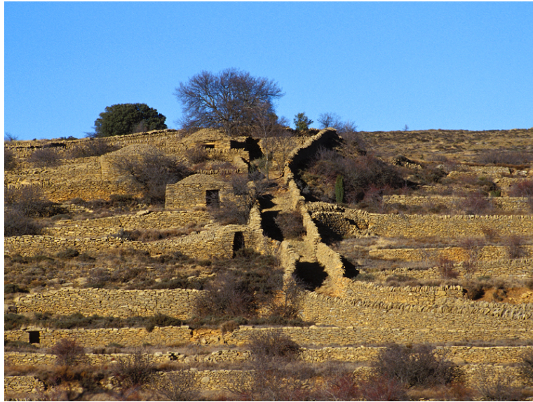
(Pedra en sec 1)