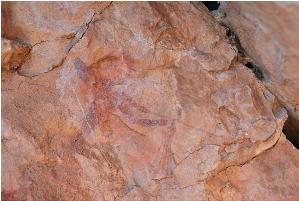
(Arquer de La Volta Espessa)