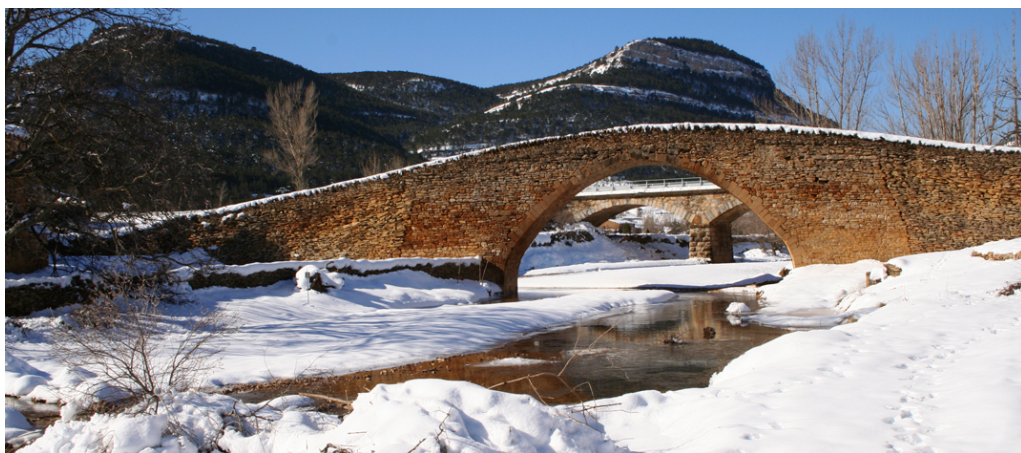
(Rambla de les Truites)