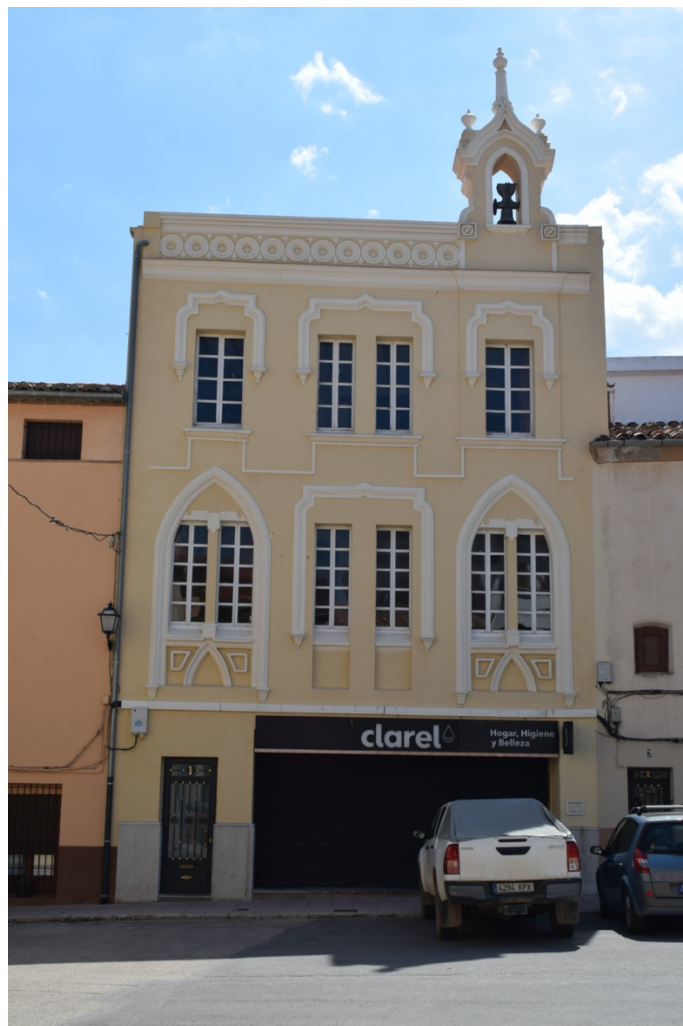
(Antic col·legi de la Consolació)