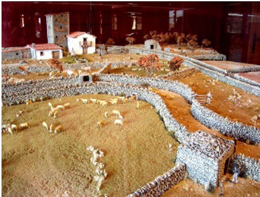
(Museu de la Pedra en Sec 2)