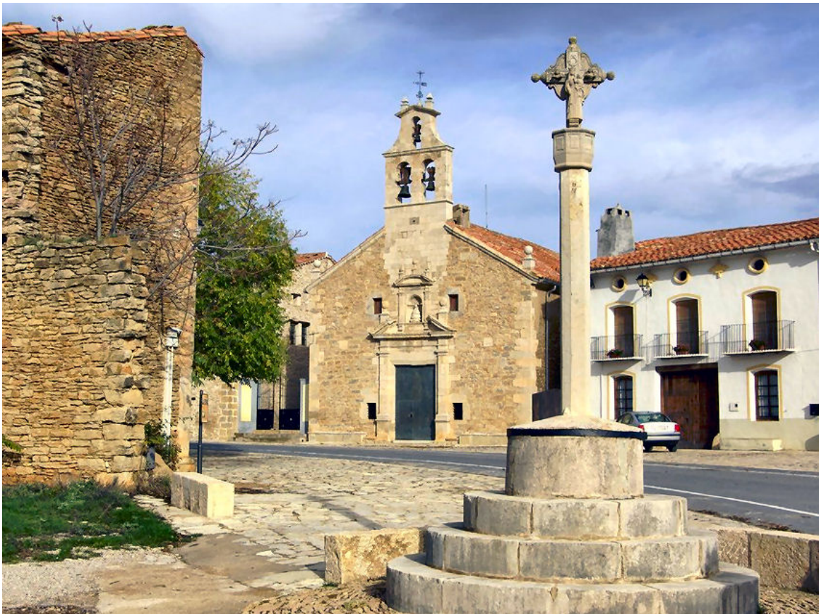
(Santuari de la Mare de Déu del Llosar)