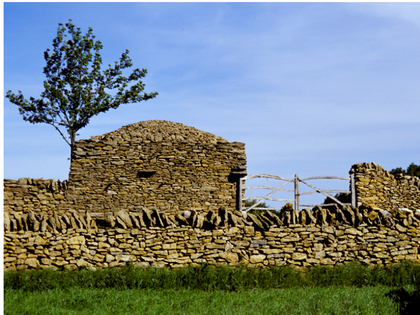
(Pedra en sec 2)