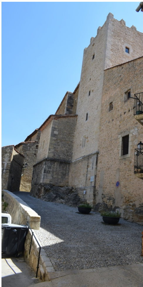
(Torre de Conjurar)