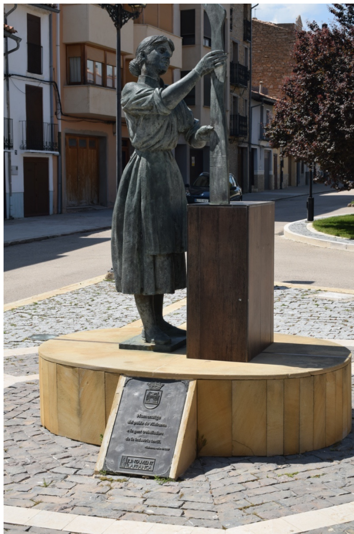
(Estàtua de la dona treballadora)