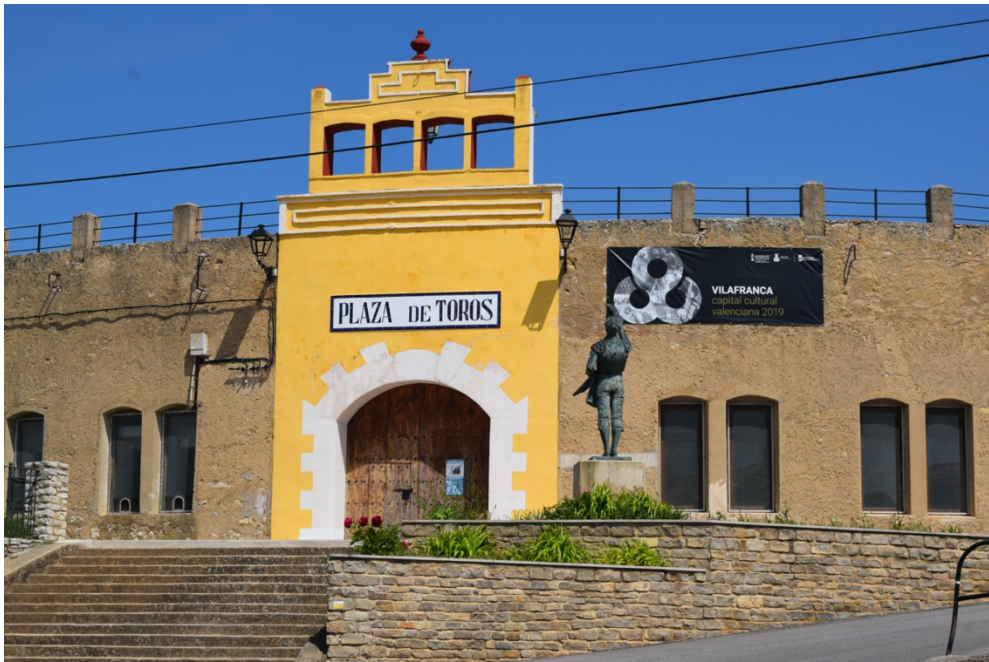
(Plaça de bous)