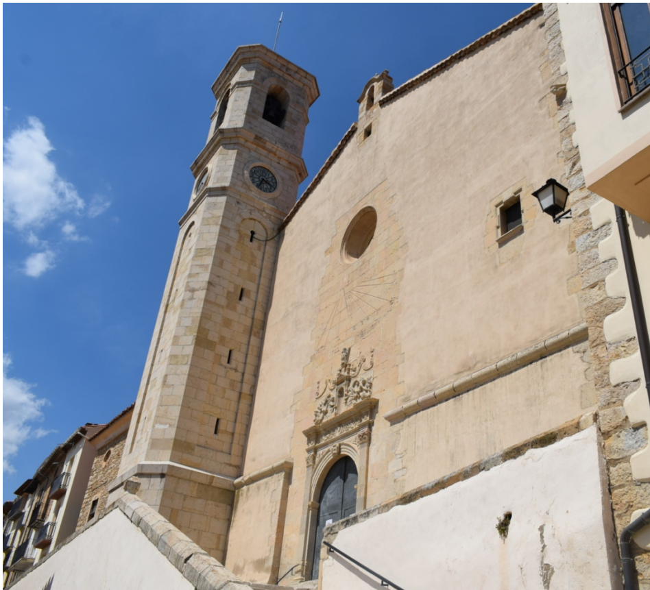
(Esgésia de Santa Maria Magdalena)