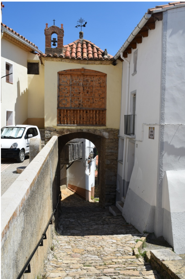
(Porta de Sant Roc)