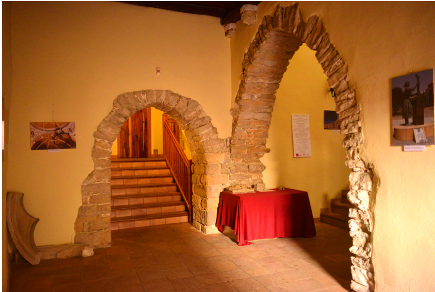
(Sales gòtiques de l'Antic Ajuntament)