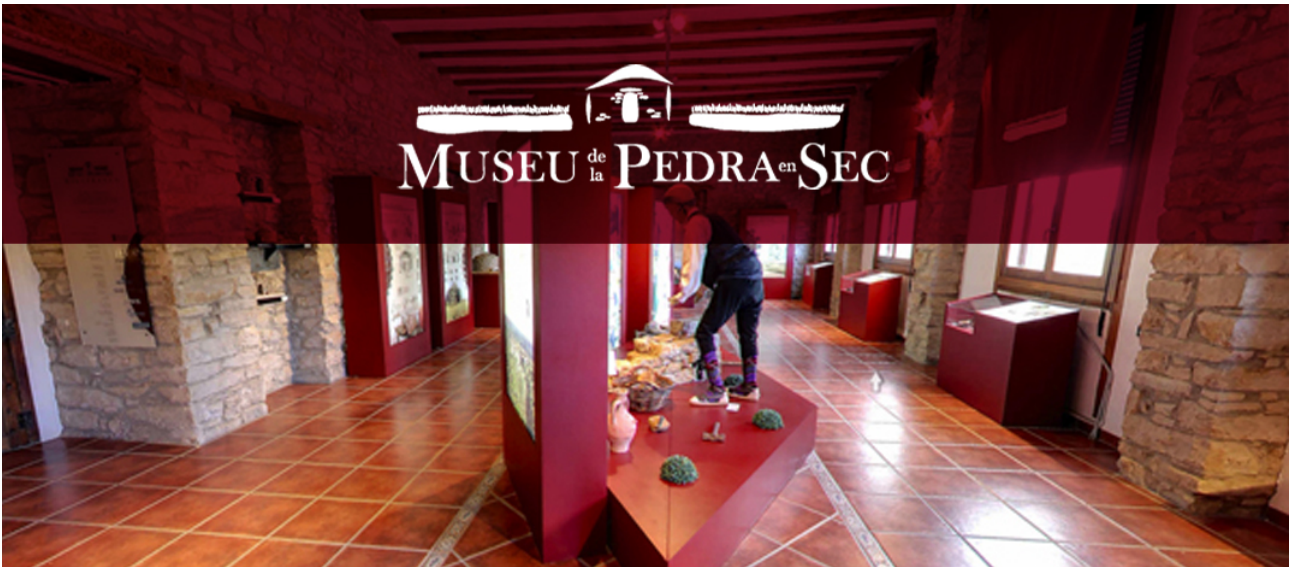
(Museu de la Pedra en Sec 1)