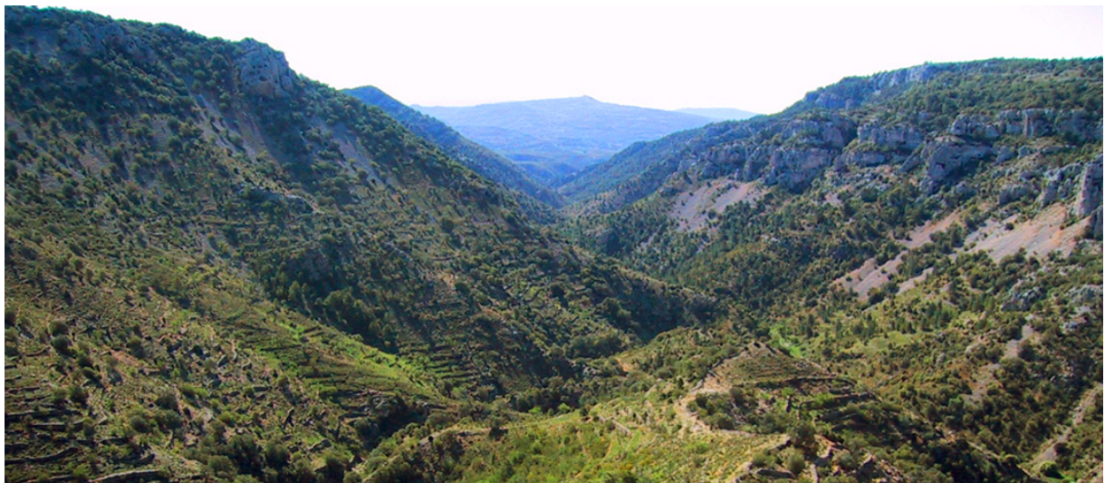
(Barranc de la Fos)