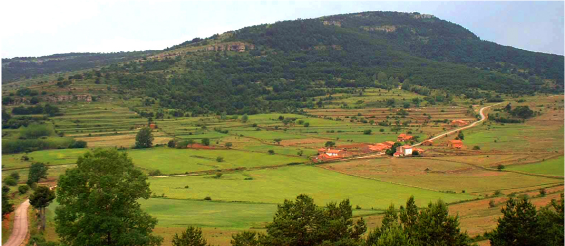
(Tossal dels Montllats)