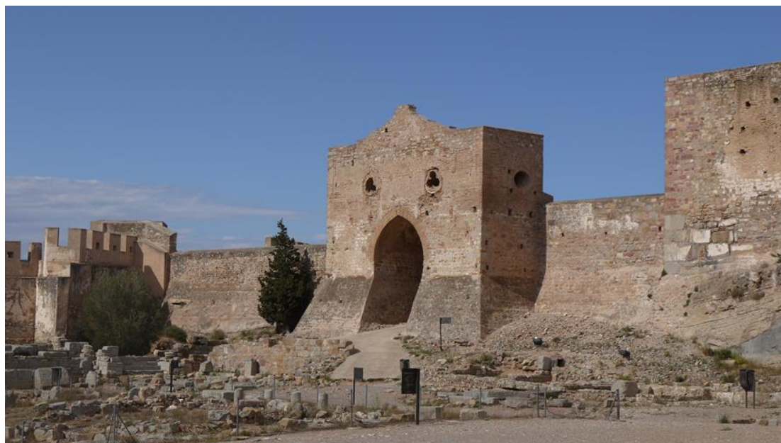
Imagen de cabecera original