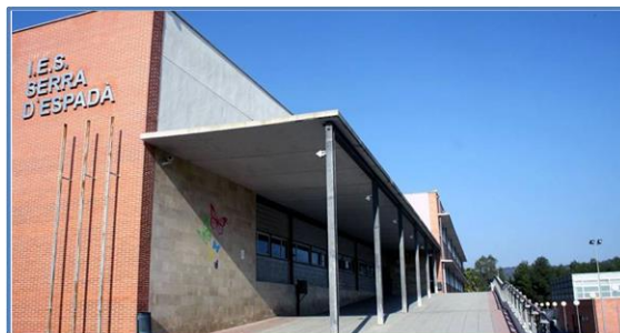
Anónimo (2014). Fachada principal del Instituto. Figura 1, Recuperado de: https://www.elperiodicomediterraneo.com

El I.E.S. Serra D'Espadà se encuentra en la localidad de Onda, como hemos desglosado más arriba. Nacido como una fusión o concentración de los antiguos centros de educación secundaria de la localidad, cuenta en la actualidad con unos 1200 alumnos y 110 docentes repartidos en la amplia oferta educativa que ofrece el centro.