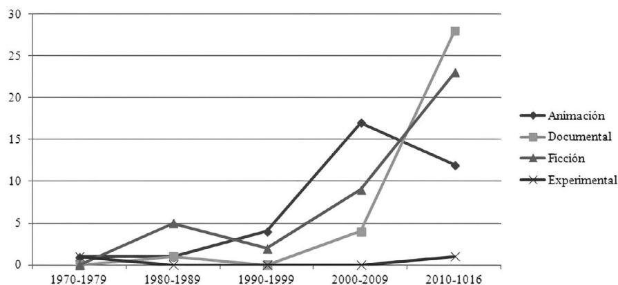
Figura 3. Distribución cronológica de los géneros

Se observa que en los años 80 la ficción tuvo una primera etapa productiva, más aún si tuviéramos en cuenta los medimétrajes de ficción que se han quedado fuera de catálogo, y, posteriormente, en los 90, descendió. Sin duda, a partir del nuevo milenio hay una subida notable bastante continuada. En el caso de los documentales, el gráfico muestra que, hasta la década del 2000, la producción es casi nula, pero desde entonces ha tenido un crecimiento exponencial, sobre todo en los últimos años. Por otra parte, cabe destacar que, desde los 80, el sector de la animación ha venido desarrollándose poco a poco y tuvo una subida considerable en la década del 2000, aunque en los últimos años parece que no ha seguido aumentando. Téngase en cuenta que el último periodo que aparece en el gráfico es algo más corto que los demás, por lo que no se puede hablar de un descenso.