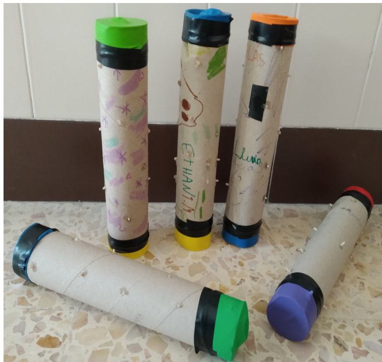
Creación de instrumentos