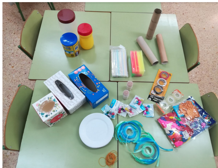
Materiales para la creación de instrumentos