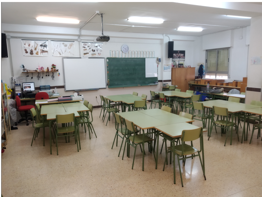
Distribución de la clase