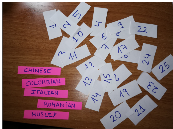
Sorteo de los grupos