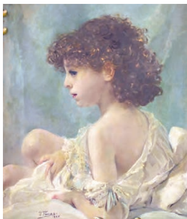
Futura Marquesa de Benicarló

Dos pisos més avall es troba l'exposició Pinazo. De la