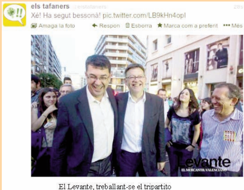
El Levante, treballant-se el tripartito

10:31 Aviso por discusión entre controlador de ORA y ciudadano