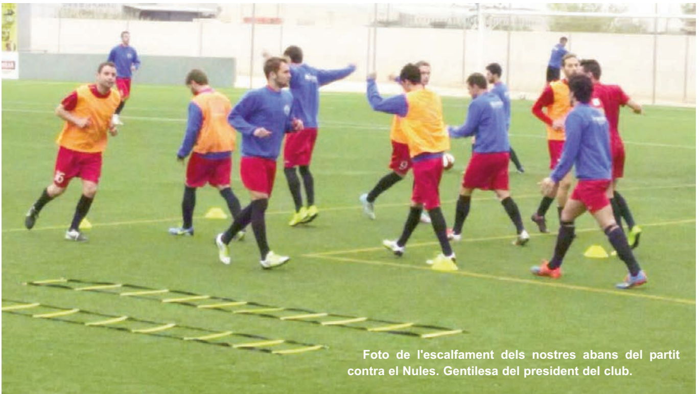
Foto de l'escalfament dels nostres abans del partit contra el Nules.

El proper diumenge, a partir de les cinc, juguem a casa contra el Torreblanca. Un partit de la nostra lliga que s'ha de guanyar sense discussió i sense dubtes. Per això jo, ara mateix, no puc concebre un altre resultat que no siga una victòria dels nostres.