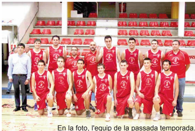
En la foto, l'equip de la passada temporada.

Per la part positiva indicar que el CB Benicarló va oferir bona imatge i segur que amb la preparació a punt, aquest