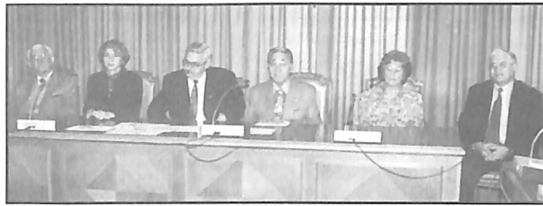
Acto de entrega de los galardones de Cruz Roja Benicarló.