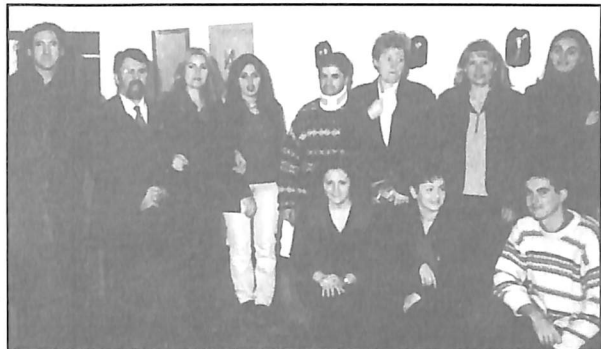
Colectivo La Mosska, cuya interesantísima Exposición de Poesía Visual puede visitarse en la Galería Le Nain hasta el domingo.