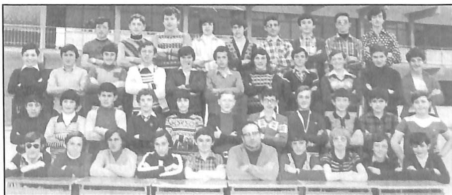
Veinte años después, 41 compañeros del Colegio La Salle de Benicarló (Curso 96/97) se han reunido en el restaurante El Cortijo.