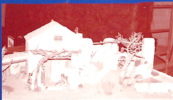
La sènia de Pau