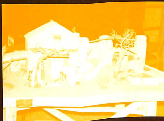
La sènia de Pau