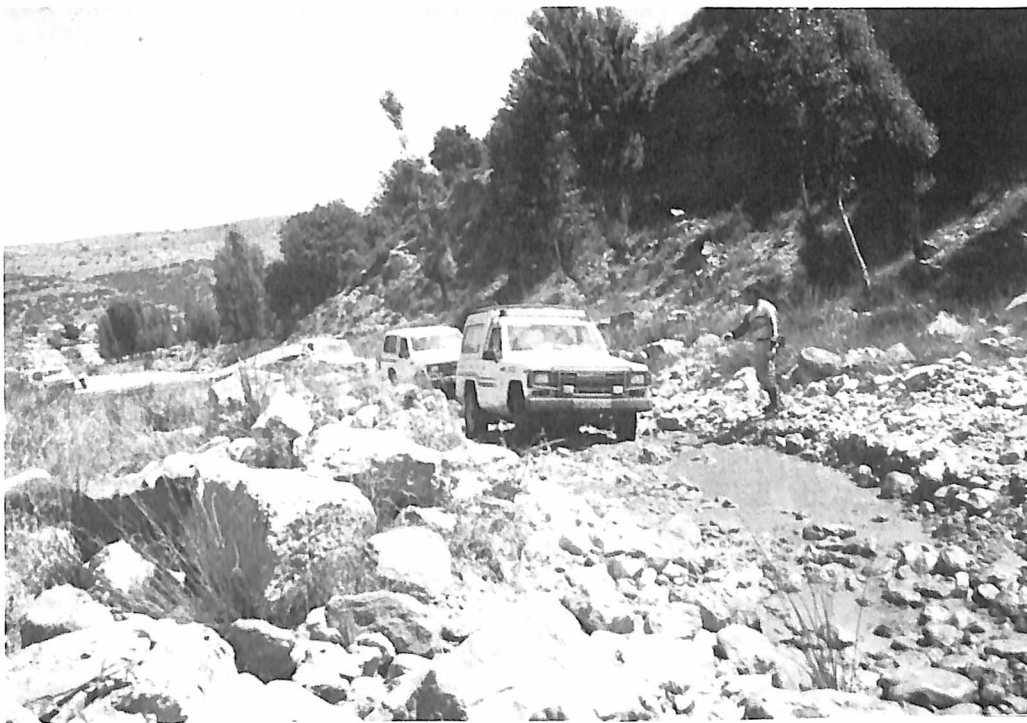
Llegando a la Cuba, no precisamente por una autovía/LAG.

Organizada por la Mancomunidad Turística del Maestrazgo, se ha celebrado, este fin de semana pasado, la III Marcha al Maestrazgo Turístico. Una cantidad respetable de coches, dada la época estival, y algunas motos, iniciaron, el sábado día 9, lo que iba a ser una de las mejores maneras de conocer el Maestrazgo.