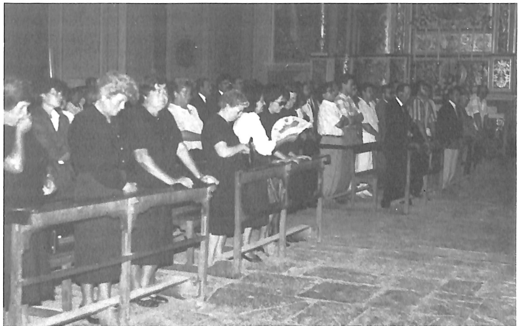
Muchos benicarlondos acudieron al Oficio Religioso