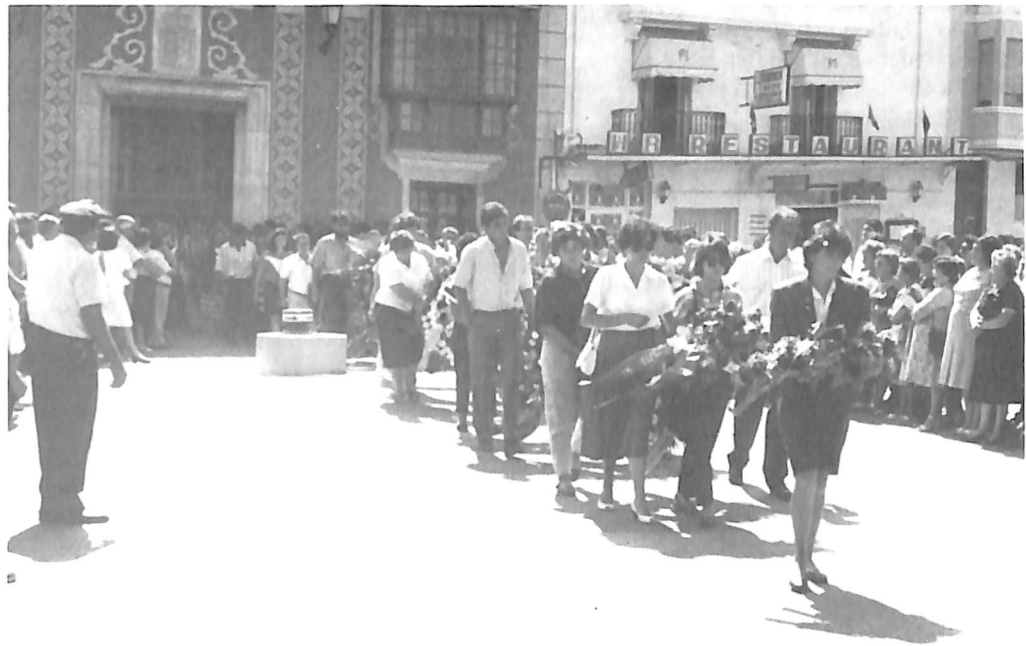
Grandes coronas y ramos en honor del difunto