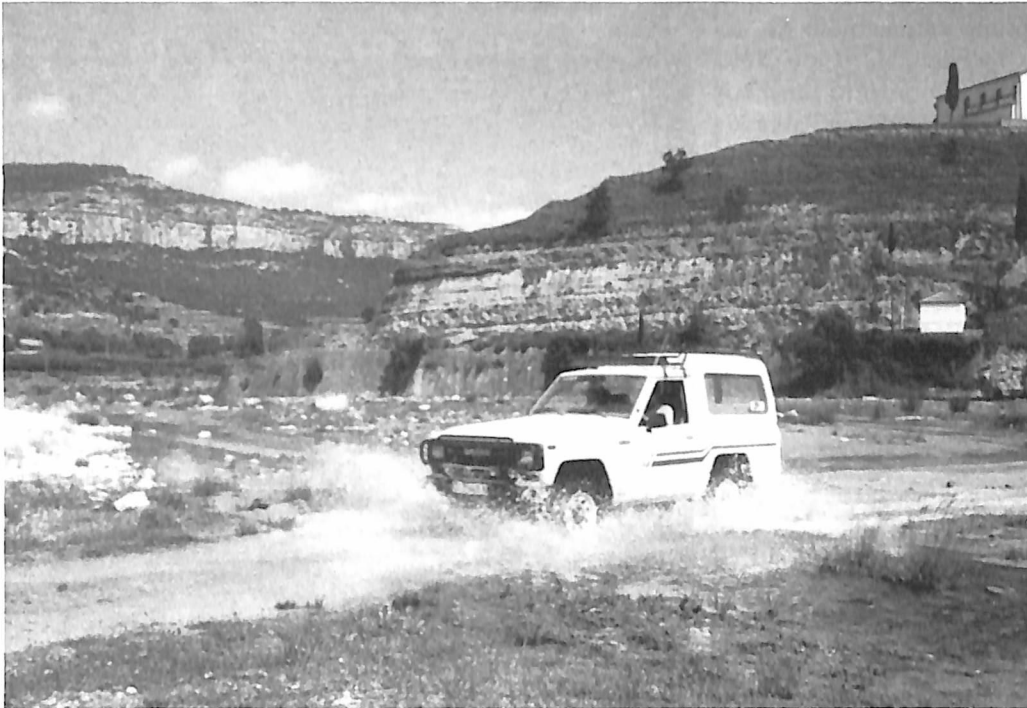
Saliendo de Forcall y cruzando el río Cantavieja/LAG.