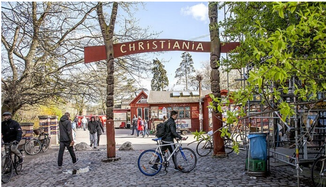
Il·lustració 2 Barri de Christiania

dia es pot observar com hi ha anuncis a la ciutat que animen a comprar accions de Christiania per un preu simbòlic (50 corones).