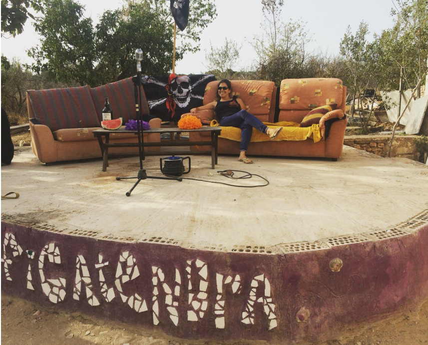
Il·lustració 6 La Figatendra (Godella)