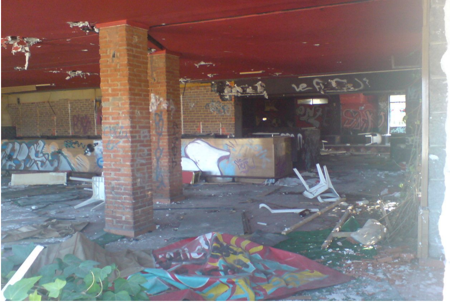
Il·lustración 5 Testa, antiga discoteca (la Fabrika) abans de 2011

La okupació de La Fabrika, es coneixia abans del 2011, com a “la fabrika de sueños” fins que es va quedar després només amb el nom de “La Fabrika”. La Fabrika, tenia una extensió de terreny molt ampla que es dividia en terrasses i els seus usos eren molt diferents: reunió de col·lectius de joves, rocòdrom, ateneu, gimnàs. Tenien una zona fora amb un escenari per a concerts així com terrenys de horta i un hivernacle. He considerat aquesta okupació com a rural o rururbana per dos principals raons: tenia una zona d’horta cultivable i es troba envoltada per naturalesa. La segona raó per la que la considere que és una okupació rururbana és perquè és rural en quant a la transmissió de certes formes de vida: el treball en el camp, comunitari, la convivència, una concepció distinta del temps, etc. No obstant el sufix de -urbà, ve donat perquè es troba en Collado-Villalba, un municipi de més de 60.000 habitants, que alguns especialistes en geografia humana no dubtarien de qualificar com a ciutat. També les activitats d’oci en l’espai okupat es semblen a les d’una okupa en la ciutat: concerts, fanzines, tallers, reunions de col·lectius, etc. Emperò una de les característiques que apropa aquesta okupa cap a la ruralitat és que la majoria d’assemblees, activitats i concerts es realitzaven a l’exterior, a l’ombra de els arbres, en els horts, en els camps, fet que en una okupació de tipus urbà es molt difícil d’apreciar, ja que en elles, l’edifici és el que conta, no els terrenys