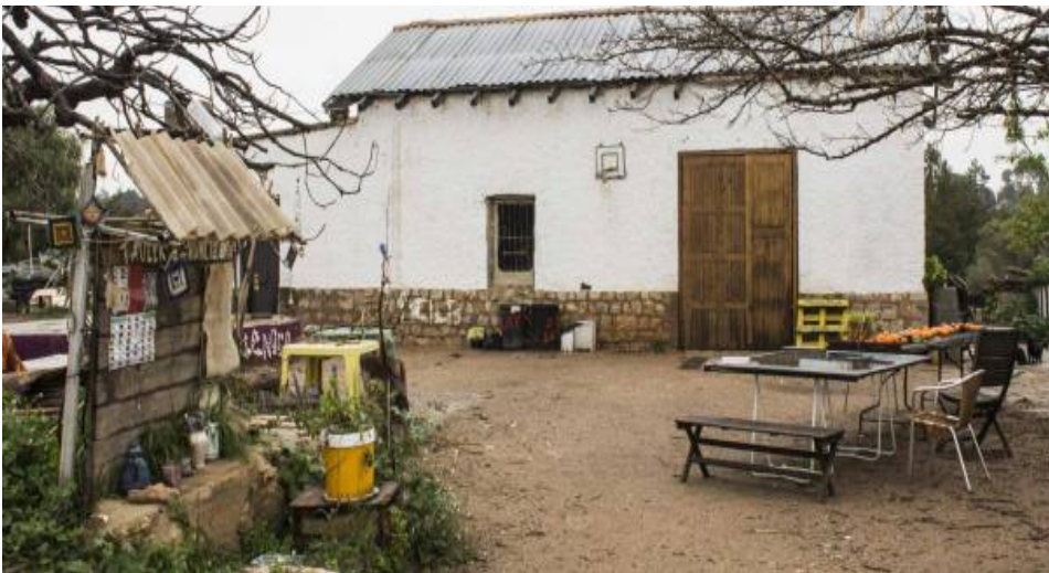
Il·lustració 7 La Figatendra (Godella)

La Figatendra era un projecte d'okupació rururbà per diverses raons: s'utilitzava l'espai exterior i els terrenys per a fer la major part de la vida, es donava un conreu de la terra, que s'utilitzava per els sopars i dinars de la pròpia okupa: no arribaven a l'autoconsum però moltes vegades els sopars que allà es feien duïen productes de La