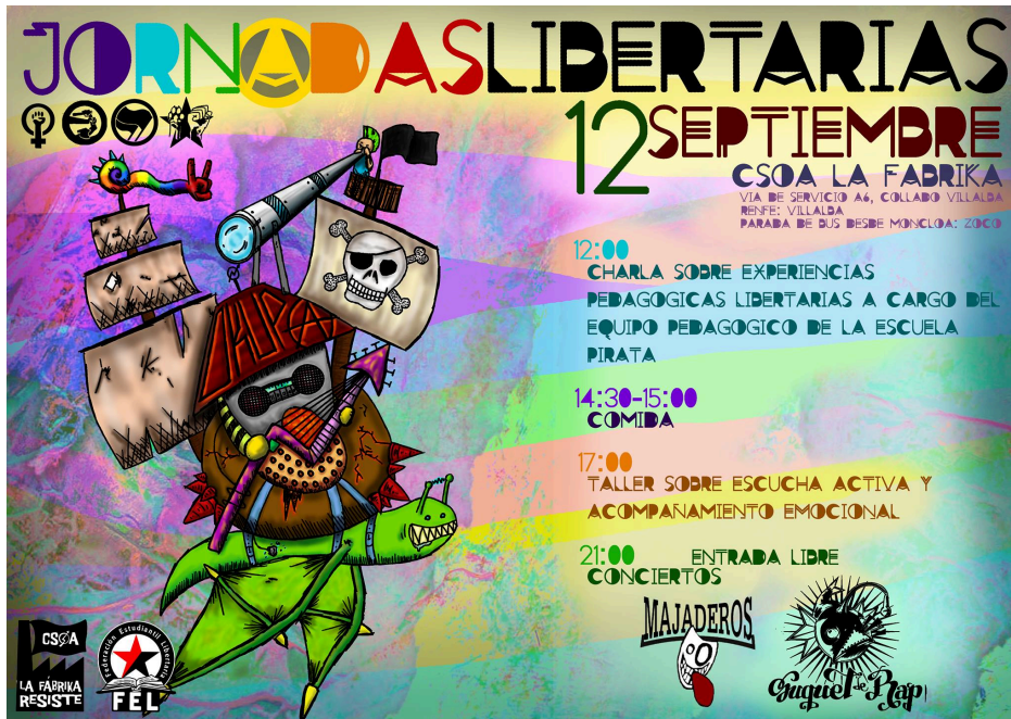
Il·lustració 3 Cartell de Jornades en el CSOA la Fabrika de Villalba

He de dir que va ser una experiència molt interessant, per la confrontació d'opinions, i perquè, un per un, de tota la gent que vàrem assistir, poguérem comentar les nostres respostes davant de tots i poguérem veure i analitzar els prejudicis que tenim a voltes sobre la gent major, els xiquets, o sobre com pensem que ajudem a una persona.