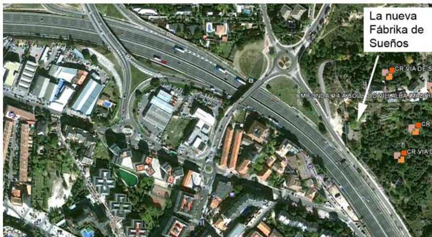
Il·lustració 4 Localització de la Fabrika després de l'okupació de 2011

El projecte de la Fabrika naix aproximadament fa 10 anys en Collado Villalba (Madrid) i pateix un desallotjament per part de l'Ajuntament en 2011, molt prop, segons una veïna de "la esquina de la calle de las mesas con la carretera de Galapagar" (csolafabrika, Youtube.com, 2011). El 20 de maig d'eixe mateix any els desallotjats de la Fabrika, realitzen una okupació en una localització diferent: en la antiga discoteca Testa, en la via de servei A6.