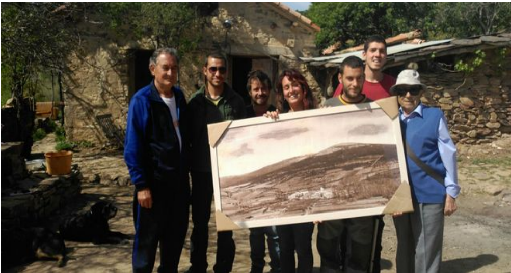
Il·lustración 9 foto dels okupants de Fraguas amb els antics veïns que abans hi vivien

població jove culturalment format que es nega a viure en un pis o a casa de els seus pares, característica de la okupació com a estratègia alternativa de vivenda. És al temps una okupació empresarial, donat que pretén crear una oferta cultural i una activitat econòmica al marge del mercat: cooperatives d'energia, posseeixen una cervesa artesanal pròpia, etc. És una okupació conservacionista, donat que el que es pretén es recuperar la memòria d'un poble abandonat, recuperar allò rural com a mode de vida. I finalment és una okupació política, perquè des del primer moment en que els okupes desobeeixen a l'autoritat per recuperar un poble, destrossat pel pas del temps i l'èxode rural, han fet una acció política: han proposat models alternatius de viure i de viure en societat. És en altres paraules, una okupació motivada per el tercer sentit filosòfic definit en aquest treball: la fugida. Aquesta fugida és el que explica la frase de “okupar per a viure” i suposa que no es possible canviar les condicions de vida des de la ciutat, o siga des de dins.