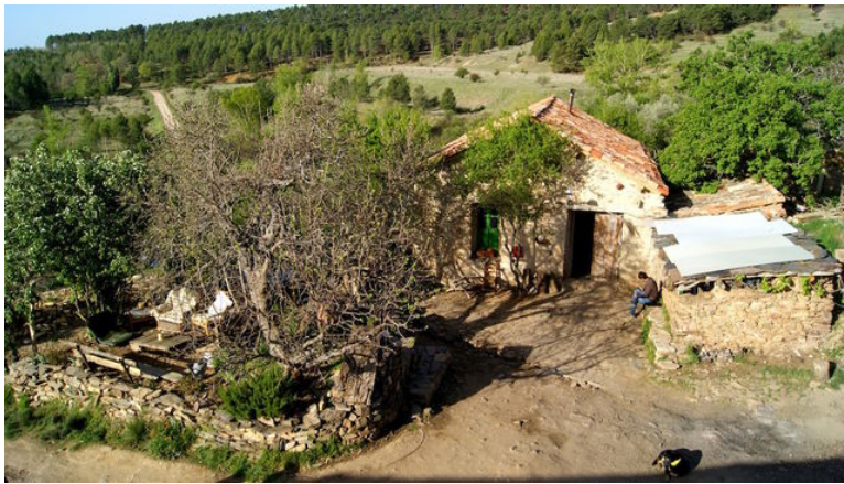
Il·lustración 8 Poble de Fraguas

la prohibició de construir en un terreny natural protegit. Per altra banda Les modificacions del paisatge i o construccions que han fet tant els okupants de Fraguas com de la Figatendra han sigut mínimes, i en ambdós casos respectant les estructures existents. En el cas de la Fábrika i la Figatendra, l'objectiu bàsic d'aquestes okupacions era oferir un tipus d'oci diferent a la joventut i el sentit filosòfic darrere de la okupació és el de una necessitat de crear cultura o contracultura. Fraguas suposa un pas més enllà que traspasa les fronteres conceptuals de l'okupació, suposa el canvi de la equació: “viure per a okupar” a “okupar per a viure”.