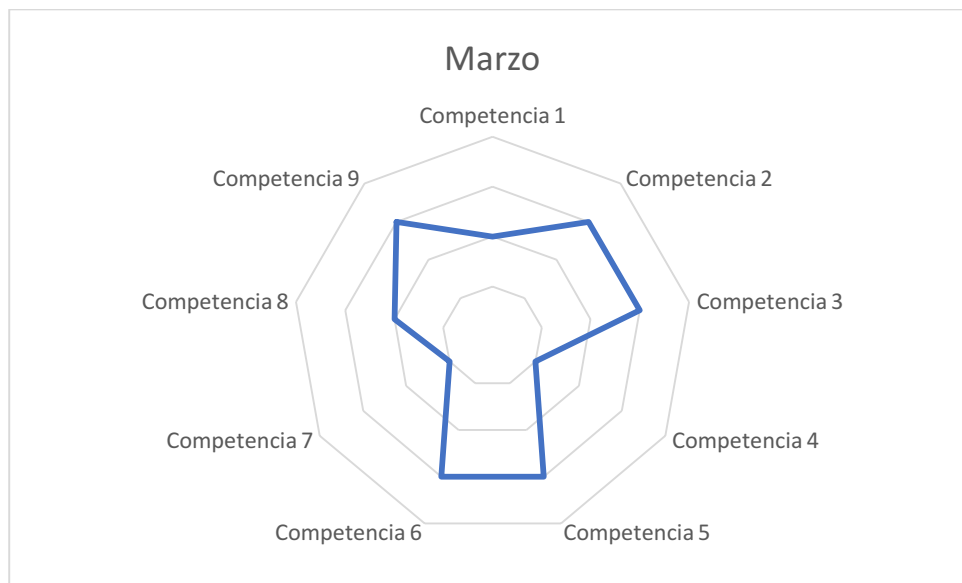
Gráfico de competencias mes de marzo