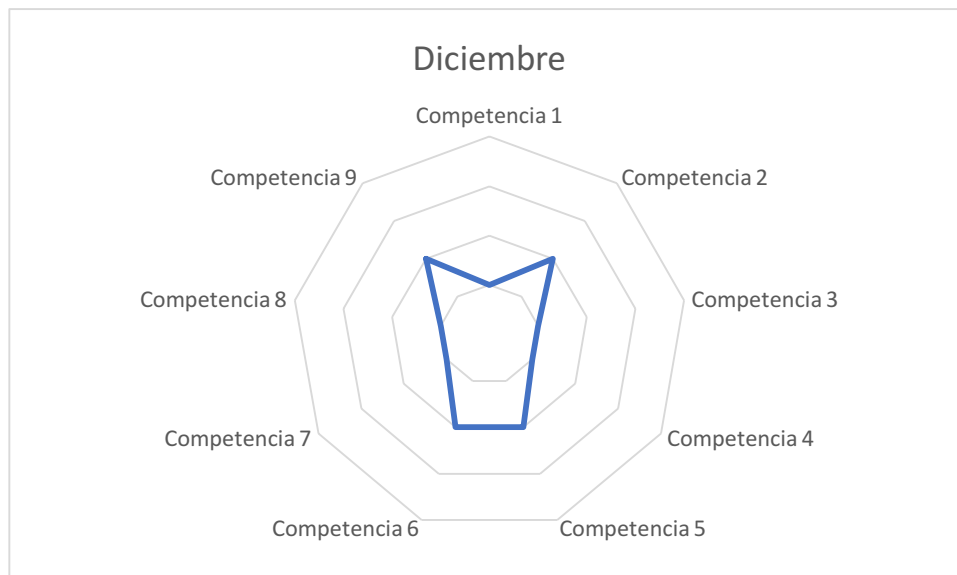
Gráfico de competencias mes de diciembre

Nivel inicial 2. Espero poder aportar opiniones y puntos de vista que refuercen o contradigan las investigaciones y estudios presentados en clase, para hacer el aprendizaje más enriquecedor y mejorar el espíritu crítico.