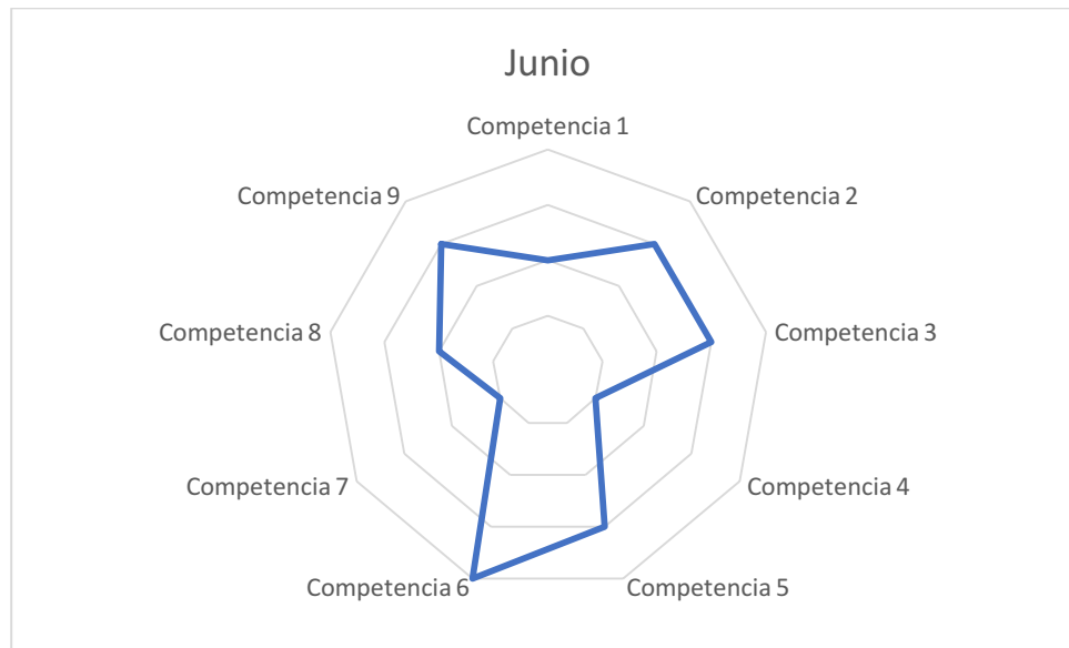
Gráfico de competencias mes de junio

La única competencia en la cual he experimentado una mejora significativa desde el mes de marzo hasta el mes de junio, ha sido la Competencia 6: Implementar las técnicas de gestión de Recursos Humanos e interpretar su relación con la salud psicosocial y el desarrollo personal y de grupos en las organizaciones. La mejora en esta competencia se debe a las prácticas externas, en las cuales he contribuido en los procesos de selección de nuevos perfiles. Además, he tenido la oportunidad de mentorizar durante las primeras semanas a la persona que se acababa de incorporar a la empresa, desarrollando por tanto pequeñas sesiones de formación on the job. Del mismo modo, he sido partícipe de los procesos de evaluación del rendimiento, así como de la utilización de herramientas de Project management.