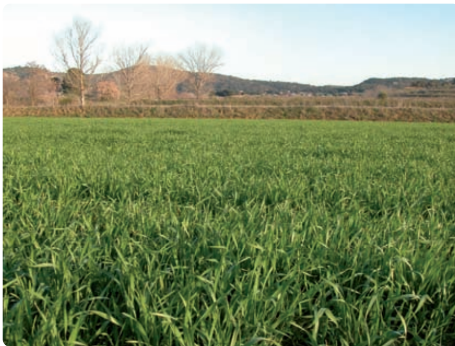
Una de las bases de la condicionalidad se basa en una estructura de cultivos en mosaico con tamaños de parcela relativamente pequeños.

Las principales causas de estas pérdidas pueden encontrarse en la reducción de los citados elementos típicos del paisaje agrario junto con el efecto de los plaguicidas menos específicos que, a menudo, han sido usados de forma excesiva o inapropiada, eliminando el resto de insectos y no sólo la plaga. Así, por ejemplo, la roturación de linderos o parches de vegetación natural supone una pérdida de hábitat para la perdiz, especie además de interés económico, y para la fauna auxiliar (predadores de plagas, insectos polinizadores, etc.); la menor proporción de barbechos de larga duración o de rotaciones de cultivo o el exceso de laboreo, reduce las zonas donde campea el sisón, especie amenazada, y contribuye a la pérdida de fertilidad del suelo; o la eliminación del arbolado disperso no productivo y viejas construcciones, conlleva la pérdida de posaderos para especies como el elanio azul, el cernícalo o la lechuza, que pueden con-