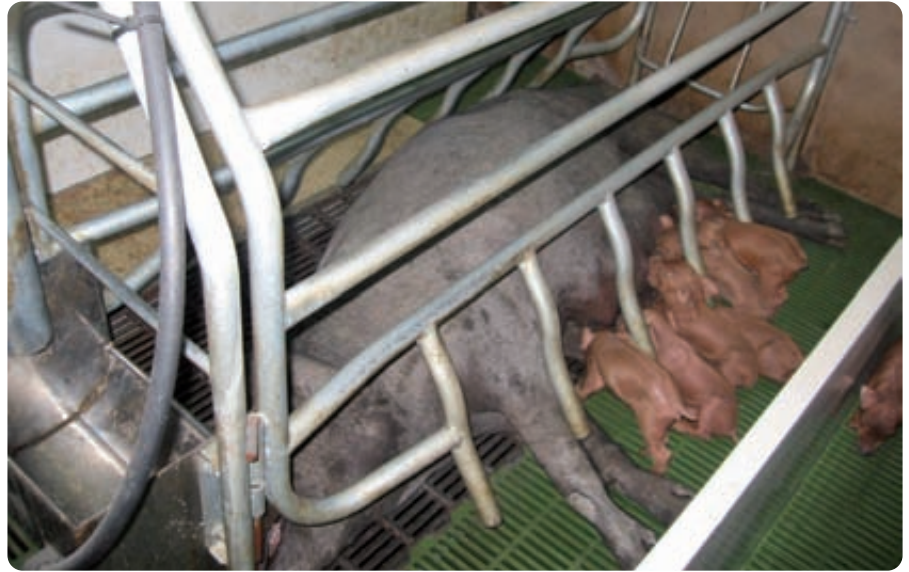
La condicionalidad también se extiende al control del bienestar animal, en respuesta a la cada vez mayor concienciación de la sociedad en torno a la protección de los animales.

Actualmente, en el mundo globalizado que nos movemos, las transacciones del sector agroalimentario se han convertido en el principal impulso económico en muchos países. El comercio de animales vivos y de los productos derivados de los mismos lleva consigo un gran riesgo de transmisión de enfermedades animales, que pueden ser el origen de crisis epizooticas a nivel mundial. Por ello, el ganadero asume su