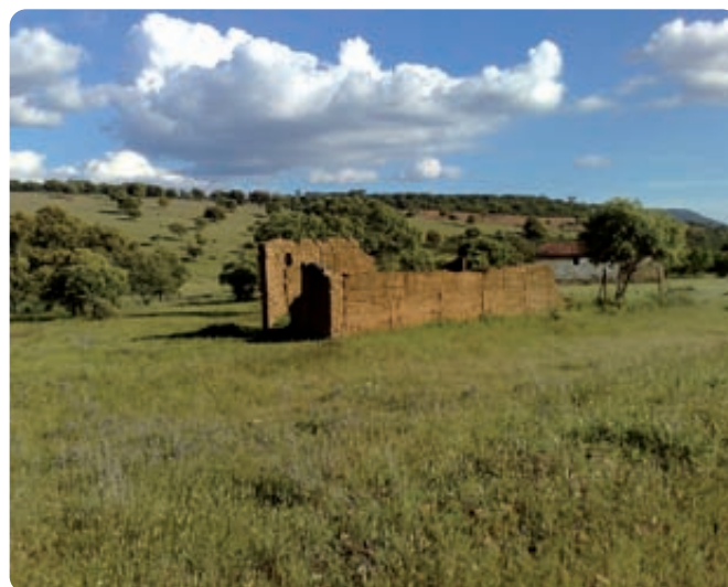
La condicionalidad incluye la protección de los elementos estructurales como antiguas construcciones agrarias o restos de las mismas, que forman parte de nuestro paisaje agrario.

las explotaciones, a continuación se enumeran, de forma genérica, algunos de los beneficios que se obtienen: