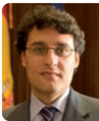
Fernando Miranda Sotillos. Presidente del Fondo Español de Garantía Agraria (FEGA).

Muchos hábitats valiosos están sostenidos por prácticas agrícolas y numerosas especies silvestres basan en ellos su supervivencia. Sin embargo, la agricultura y la ganadería pueden también repercutir adversamente en los recursos naturales.