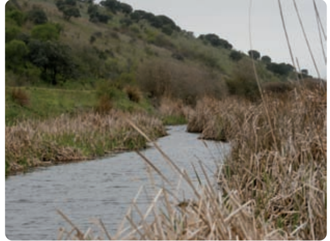
Al disminuir el proceso de erosión en las parcelas agrícolas se reduce la carga de tierra, piedras y restos de tratamientos fitosanitarios que se descargarían sobre ríos y embalses.

tiempo de trabajo, mejora de la gestión de la explotación, etc.