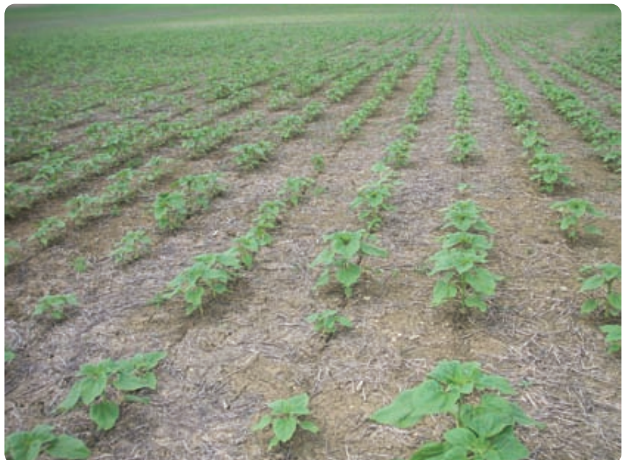
La siembra directa incrementa la infiltración del suelo, controla la escorrentía superficial y como consecuencia, la erosión.

En cultivos anuales el mantenimiento permanente de los restos de la cosecha no solo permite una buena protec-