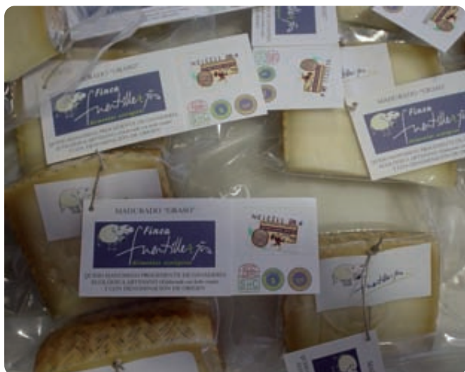
Las mejoras introducidas por el titular de la explotación en la misma, le facilitan el acceso a ciertos marchamos de calidad que le permiten diferenciar su producto del resto.