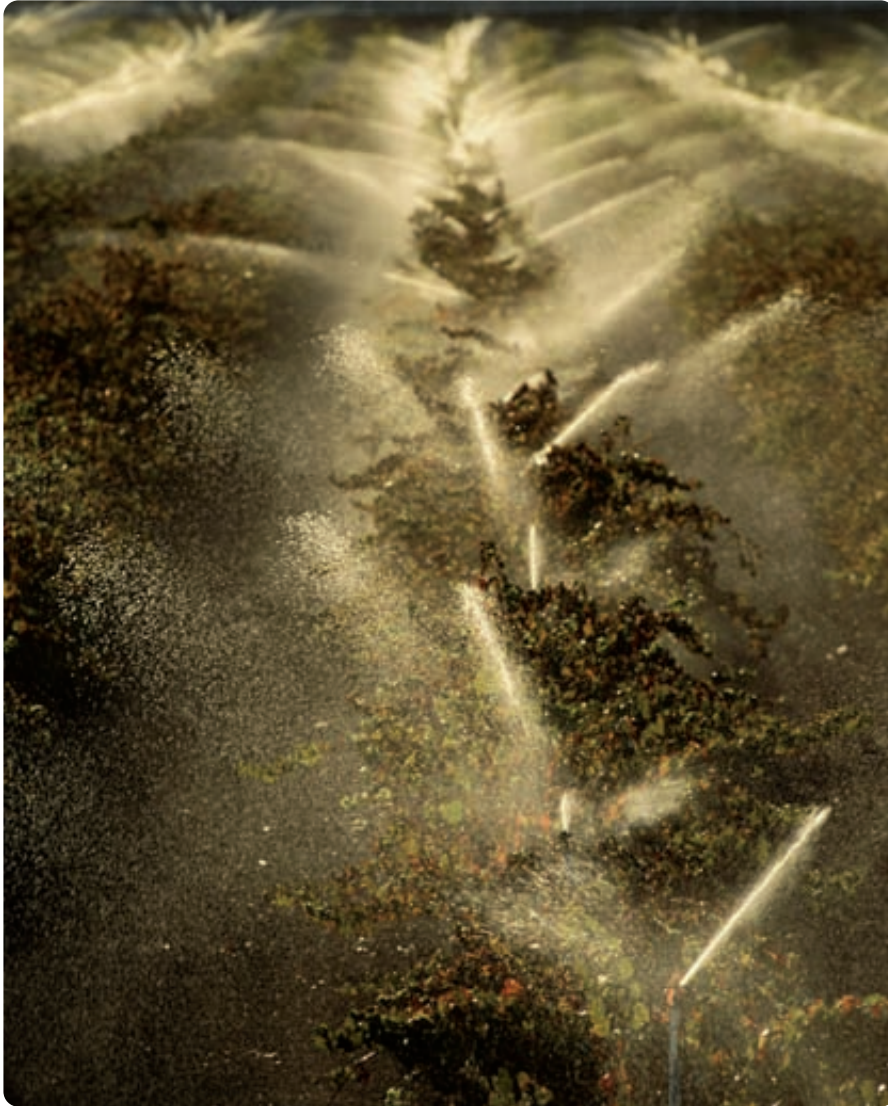
Es necesario diseñar los proyectos de regadíos, tanto de nuevas transformaciones como de modernización de los que hay en servicio, con criterios de eficiencia energética y ahorro de agua.

tarios empleados en aquéllas. Estos requisitos conformaban la práctica de la aplicación de diversas directivas. Posteriormente, el control se extendió a la correcta gestión de los residuos de las actividades ganaderas sin contaminación apreciable. Pero la condicionalidad se ha contemplado en la normativa con una perspectiva integral (holística), que abarca diversos elementos, tanto los cualitativos, ya mencionados, como los meramente cuantitativos, centrados éstos en conseguir el uso eficiente del agua.