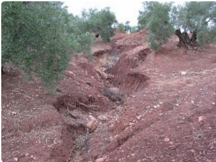
Surcos y cárcavas con una alta degradación y problemas graves de aluviones y sedimentación en las zonas próximas.