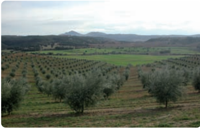
La condicionalidad incluye diversas normas para superficies con pendientes dirigidas al mantenimiento de una cubierta vegetal que evite los fenómenos erosivos más graves.