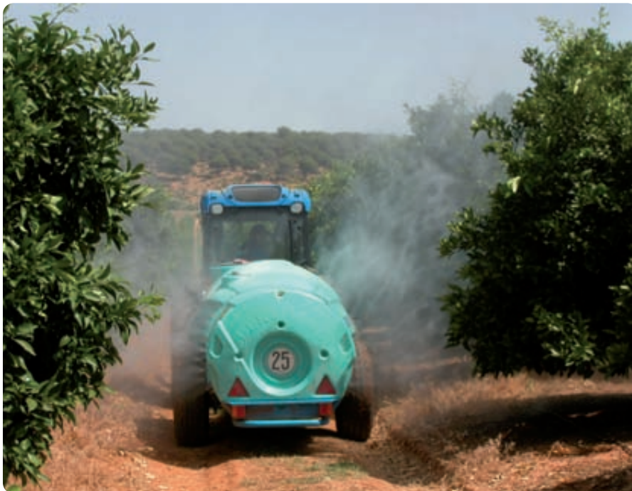
La conservación de los hábitats introduce obligaciones como la aplicación racional de los tratamientos fitosanitarios.