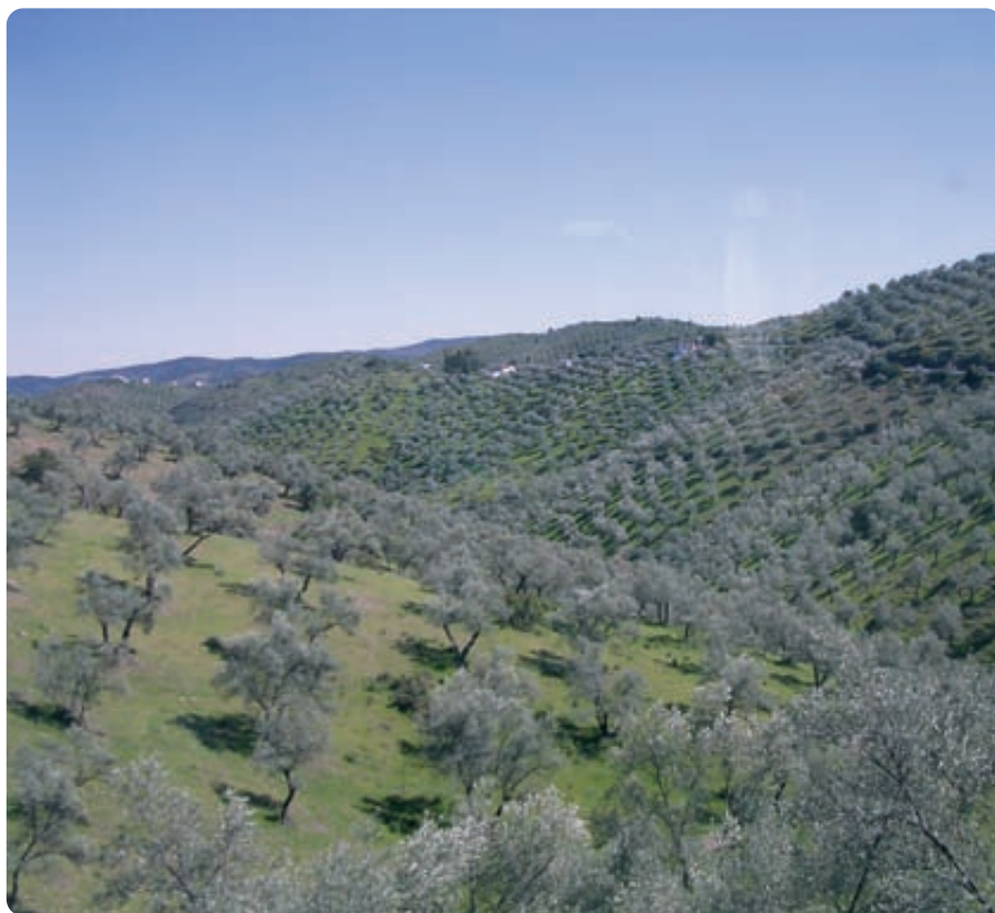
Olivares ecológicos en pendiente de la Cooperativa Olipe-Olivalle de Pozoblanco, (Córdoba), con elevadas pendientes y suelos poco profundos sobre pizarras. En esta cooperativa se gestionan de esta forma más de 9.000 ha de olivar.

Los pastos permanentes ( cuadro VI ) que han sido certificados ecológicos