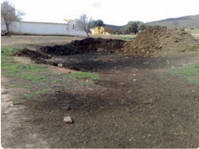
La quema de rastrojos o restos de poda (no sin autorización) repercute en una reducción del riesgo de incendio y por tanto se favorece la protección de las masas forestales.