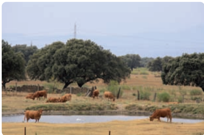
Un manejo combinado de cultivos y ganado extensivo es un objetivo de la condicionalidad.