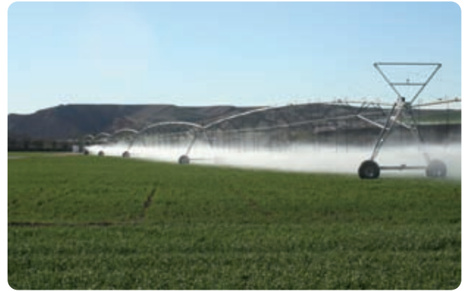
El requisito es que cualquier explotación con riego debe disponer de los permisos y las autorizaciones necesarias para ello y de los dispositivos de medición de caudales correspondientes.

Por último, pero en primer orden de prioridad junto con un uso mínimo y adecuado de los plaguicidas, el mantenimiento de los elementos estructurales no productivos del terreno es una cuestión clave para la conservación de la biodiversidad, que de hecho ya se incluye parcialmente, como se ha visto en los requisitos asociados a la Directiva de aves.