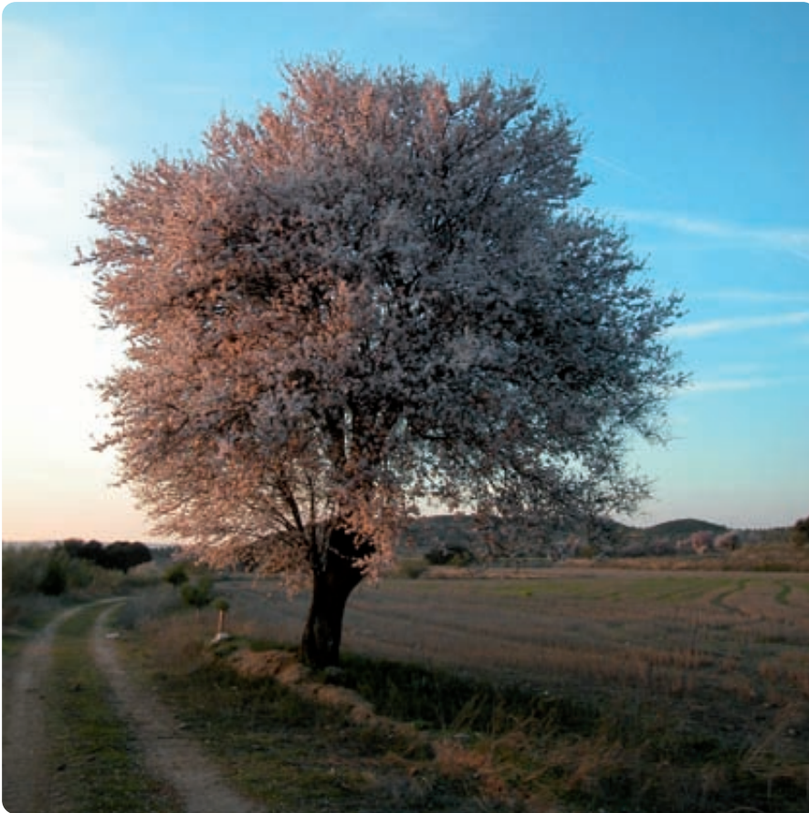
Es importante el mantenimiento de abundantes y dispersos testigos de la vegetación natural previa.

A continuación se exponen los requisitos y normas con mayor relevancia para la biodiversidad 4 ( cuadro I ) y la manera en que pueden beneficiarla 5 .