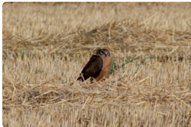
Los rastrojos resultantes de la labor de cosecha son un recurso valioso para numerosas especies, sobre todo para las aves.

número de árboles no productivos (como Castilla y León). Y si bien no es deseable que haya requisitos distintos en cada región, estas dos cuestiones en particular son fundamentales para la conservación de la biodiversidad en los sistemas agrarios, sin que supongan un perjuicio sustancial, sino incluso al contrario, para los cultivos.