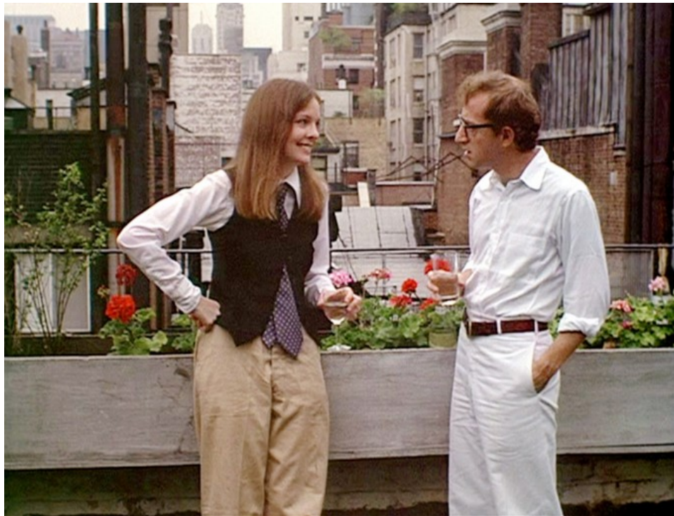
The Odissey (2017)

Poco a poco, este tipo de estilo que había quedado relegado a la moda masculina se fue democratizando, llegando a ser particularmente común en los años 70 y 80. Podía ser observado en todo tipo de ámbitos, desde las pasarelas al cine, con el ejemplo exponencial de la película del renombrado director de cine Woody Allen, Annie Hall . Así, Diane Keaton sería vista en diversas películas con una indumentaria que la caracterizaba por considerarse un personaje independiente e intelectual, contrastando con el resto de mujeres que aparecían en escena.