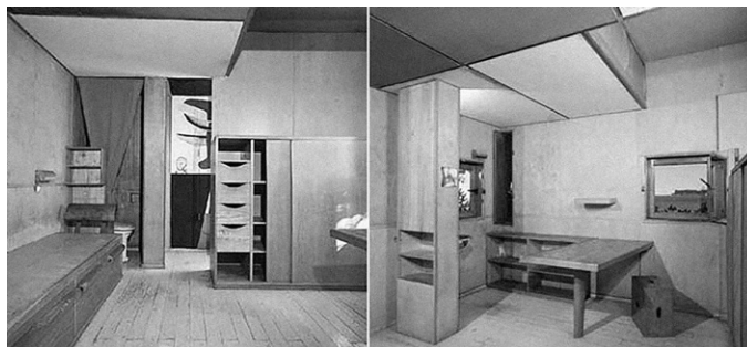
Fig. 6. Le Corbusier. Interior de Le Cabanon .

Pero los propósitos de Le Corbusier sobre la E1027, no quedaron sólo aquí. Era una casa que desde siempre le había maravillado; en ese sentido, nos recuerda Espegel que él «admiraba la villa E1027 y reconocía que con ella, Gray había conseguido distinguirse de sus contemporáneos» (2007: 129). Así, diez años más tarde de que pintara el primer fresco en las paredes de la casa, envió una carta a Badovici animándolo a reformar algunas estancias, e instándolo a eliminar algunas piezas del mobiliario que Gray había diseñado específicamente para cada lugar. Comenzaría una campaña de constante violación hacia el diseño original de la casa, tratando de asimilarla a los parámetros corbuserianos . Quería hacer suyo un diseño genial que no le pertenecía, y estaba dispuesto a hacer cualquier cosa por conseguir atribuirse aquella construcción.