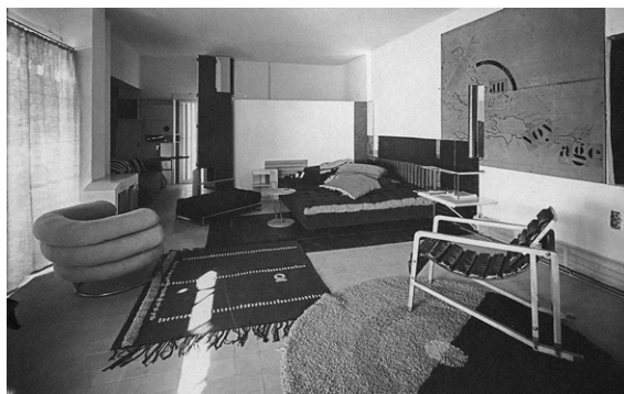
Fig 4. Eileen Gray, Exterior e Interior de Maison en bord de mer o E1027 , Cap-Martin Roquebrune, 1927.