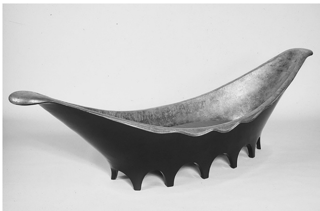
Fig. 3. Eileen Gray, sofa piragua o Canoe , 1921.

1993: 20). Toda esta reforma, como hemos advertido, fue muy importante en su carrera, puesto que le brindaría la oportunidad de realizar una intervención total, sin embargo, «el diseño más sorprendente de este apartamento fue el sofá piragua» (Fig. 3) (Dachs, 2013: 28), una pieza que ha caracterizado a esta diseñadora y que la vincularía al movimiento Déco, aun existiendo diferencias que se acentuarían con el desarrollo de su carrera. Esta chaise longue «combinaba texturas de la laca color marrón del exterior y la plata del interior y era sostenida por doce pequeños arcos» (Dachs, 2013: 28).