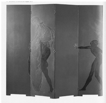
Fig. 2. Eileen Gray. Le Destin , biombo de cuatro paneles, 1913.

... con laca de color rojo oscuro sorprende por el empleo de estilos completamente distintos en cada uno de los lados. A pesar de que ambas reproducciones son bidimensionales y tienen la misma tonalidad, parecen señalar hacia dos tendencias artísticas muy distintas (Hecker, 1993: 13).