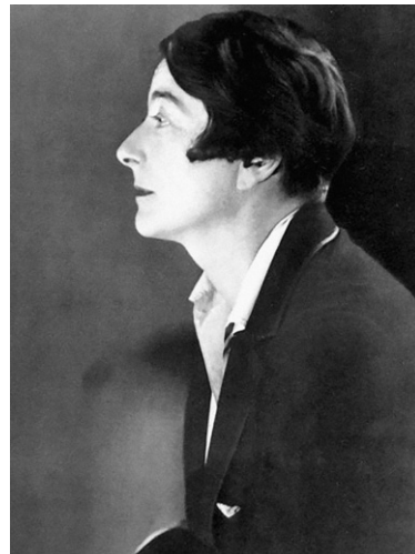
Fig. 1. Retrato de Eileen Gray realizado por Berenice Abbot en París, 1926.

Gray llegó a considerar a cada uno de sus progenitores de una forma bien diferente; su madre representaba para ella la autoridad, una mujer que «had a rather solemn face, as if she rarely smiled; a woman whose pride was hurt through the loss of the love of her husband» (Adam, 1987: 12). Mientras tanto, la figura de su padre tenía otras connotaciones para ella: