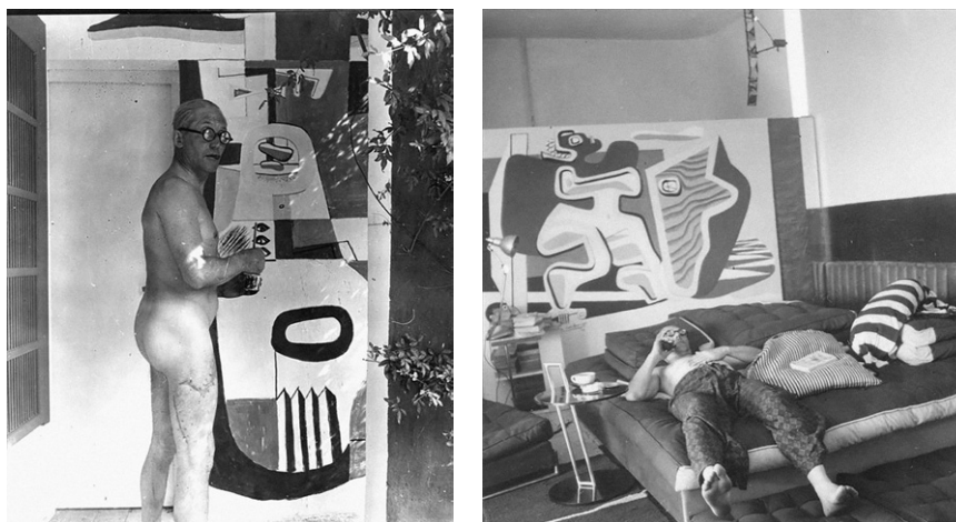
Fig. 5. Le Corbusier junto a unos de los murales en la villa E1027, s/f.

Esta relación se acabaría definitivamente en 1938, cuando Le Corbusier comenzaría a pintar, sin autorización, una serie de murales en la casa (Fig. 5). Algo que ella llegaría a considerar como «an act of a vandalism» (Adam, 1987: 311). Sin embargo, en este momento, Eileen no sólo se había distanciado de Badovici, sino que su relación sentimental estaba totalmente acabada, tanto que ella residía ya en una casa que construyó para sí misma en Castellar, una localidad a pocos kilómetros de Roquebrune hacia el interior. Ante estas circunstancias y recordando que la propiedad legal de la E1027 estaba a nombre de Jean Badovici, «no podía hacer nada para evitar que Le Corbusier «regalara» los murales a su propietario» (Marcos, 2011: 267).